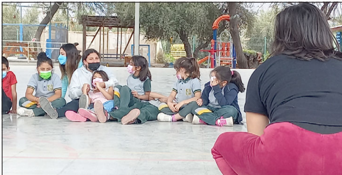
Alumnos de la escuela La Higuera de Santa María (en la foto), junto a sus pares de escuelas de Llay Llay, San Esteban y Calle Larga, participarán del proyecto ‘En Movimiento’ del Centro Cultural ‘Escenalborde’.