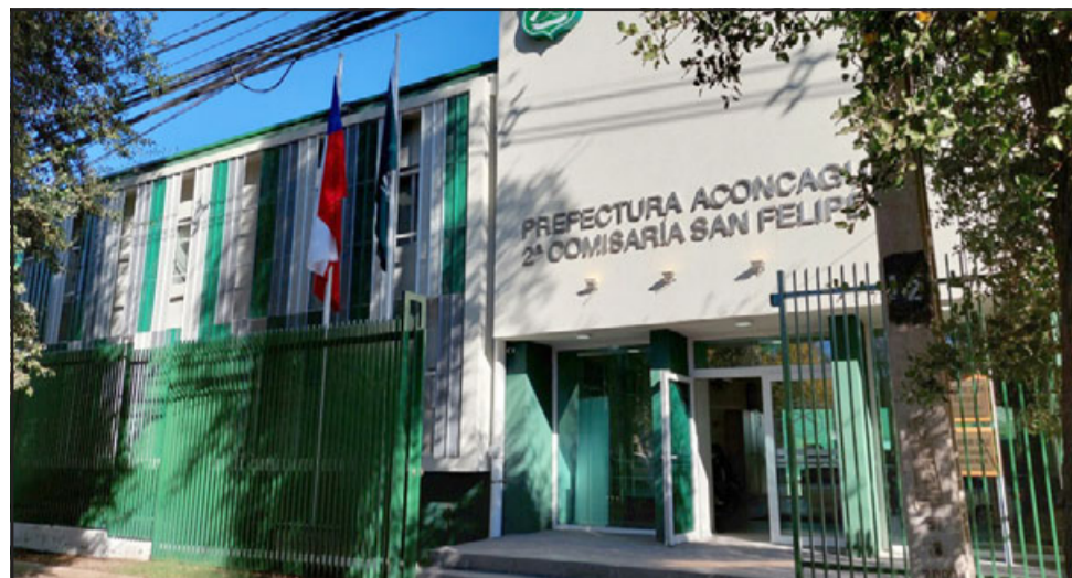
La Oficina de Postulaciones de Carabineros Aconcagua comenzó a atender nuevamente en dependencias del remodelado edificio de la Prefectura Aconcagua.

En tanto, desde el área de difusión del proceso de admisión, indicaron que los jóvenes interesados en cursar estudios en la Escuela de Formación de Carabineros, deben dirigirse a O'Higgins