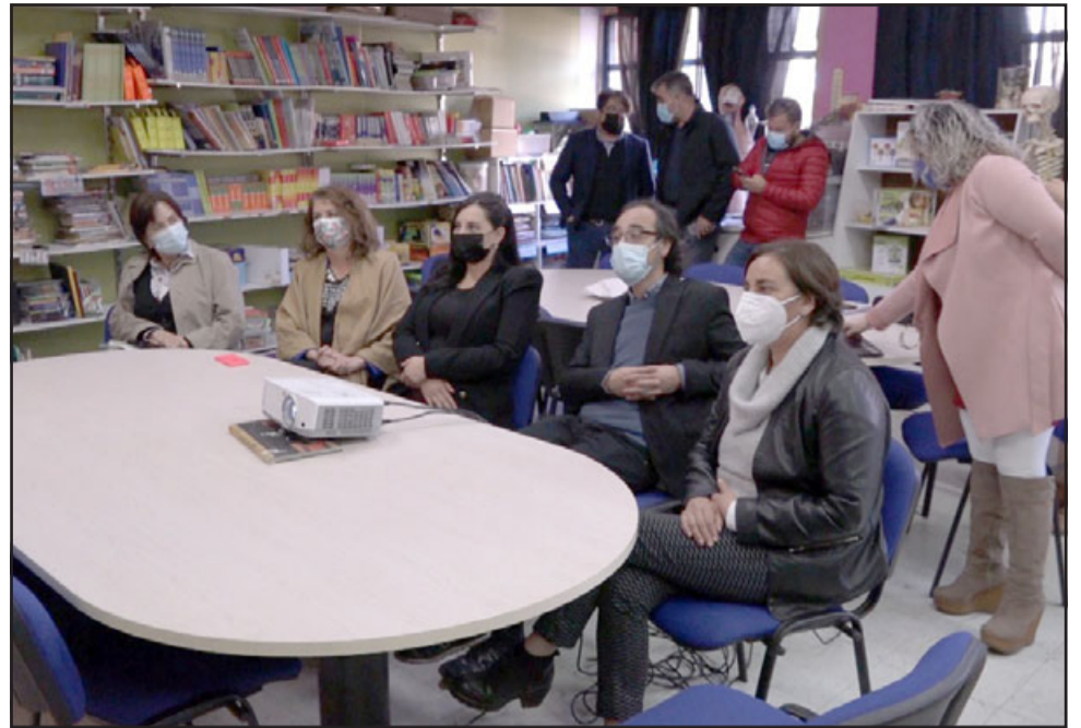
Autoridades visitaron la Escuela José Manso de Velasco para conocer el trabajo científico que se realiza con sus estudiantes.

La directora también precisó que es vital además contar con profesores que motiven a los estudiantes a conocer el mundo científico; «trabajar con profesores comprometidos, motivados hacia el área, es vital para motivar a los alumnos. Estamos felices porque además nos consideraron como una experiencia para darla a conocer».