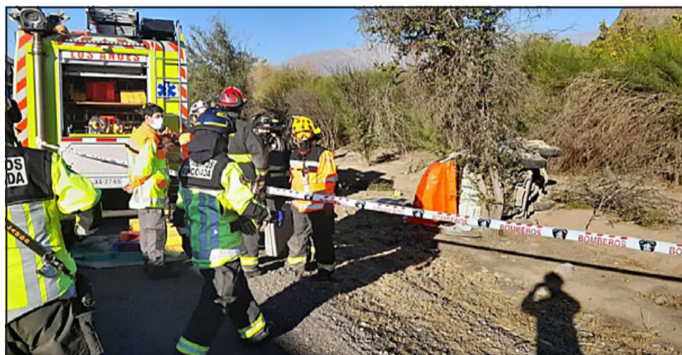
El conductor se desplazaba hacia el poniente cuando al enfrentar una curva, sobrepasó el eje de la calzada para volcar a un costado del camino, falleciendo aplastado por el pesado vehículo al salir eyectado durante el volcamiento.

El accidente ocurrió en horas de la tarde de ayer martes en la Ruta 57 Los Libertadores.