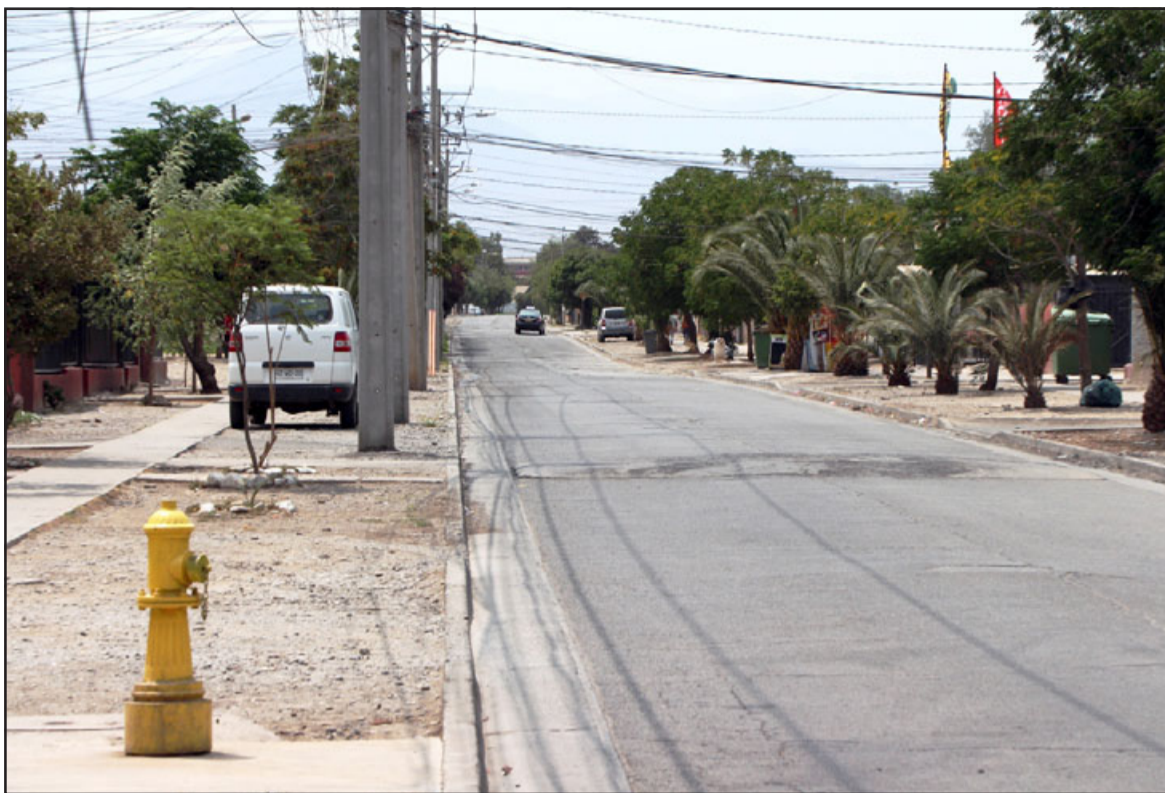
Bastaron un par de años para que esta arteria, recién construida por la empresa que construyó las viviendas, fuera destruida básicamente por la acumulación de aguas lluvias que desembocan en el sector.

- No alegan tanto porque, por ejemplo, las micros decían que el camino estaba tan malo que ya no