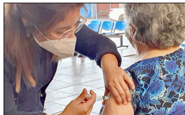
Sólo un 43,8% de las personas mayores de 65 años de edad ha recibido la cuarta dosis, siendo el mayor porcentaje por rango etario; no obstante, por calendarización, este grupo debería tener cerca del 90%.

Asimismo se precisó que se espera que este invierno puedan generarse algunas otras enfermedades asociadas a las bajas temperaturas, sobre todo pensando en los menores de edad que han retornado a clases presenciales, razón por la cual se está haciendo un plan con pediatría de los hospitales porque este invierno será distinto, habrá circulación de otros virus.