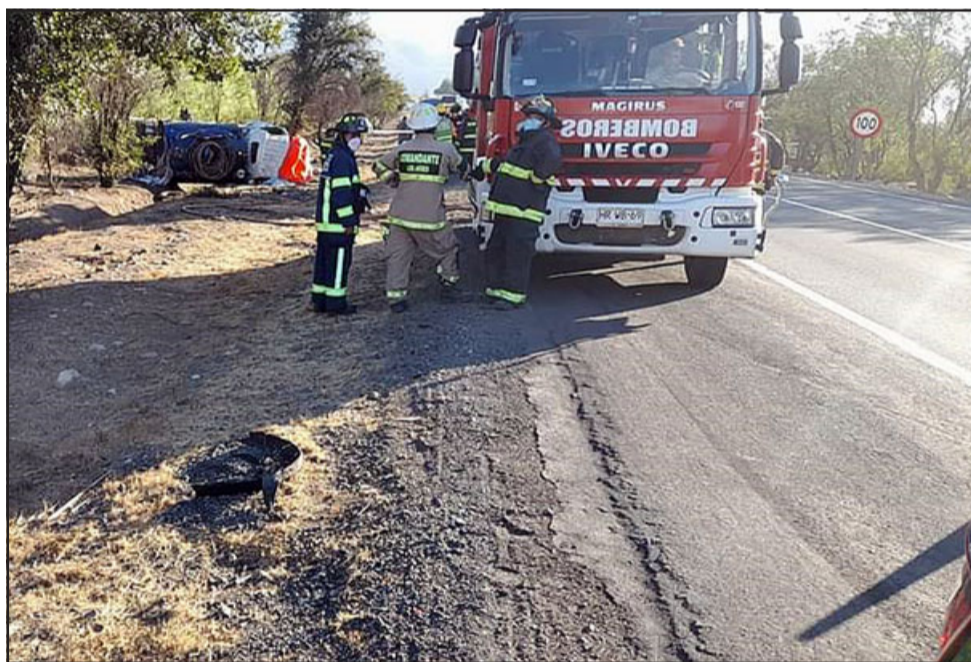
Al fondo se puede apreciar el camión volcado y personal de Bomberos que se hizo presente en el lugar para atender la tragedia.