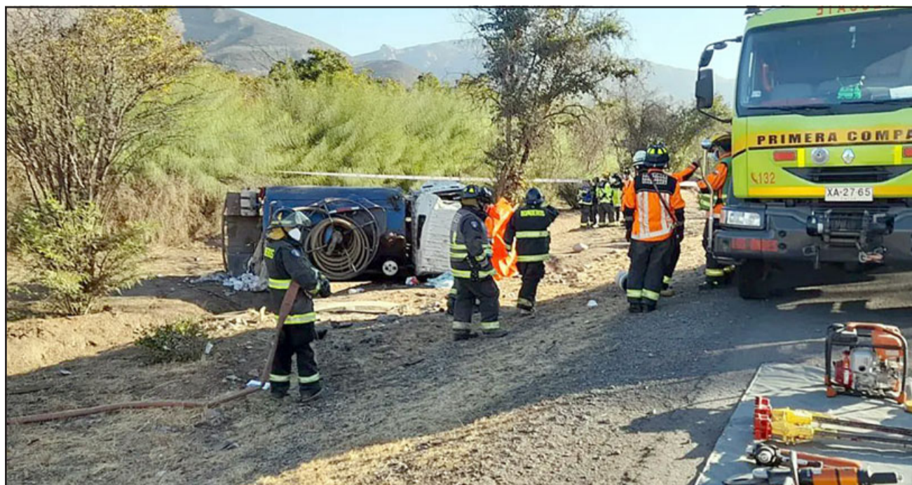
TRAGEDIA.- La tragedia ocurrió este martes a eso de las 15,30 horas en el sector Pedrero de la comuna de Calle Larga.

El oficial, sobre la presunta causa basal del accidente, dijo que en este momento se barajan varias hipótesis como la velocidad, «la carga que mantenía, que haya habido algún elemento extraño en la ruta, algún animal que se haya cruzado, un tercer vehículo involucrado. A medida que