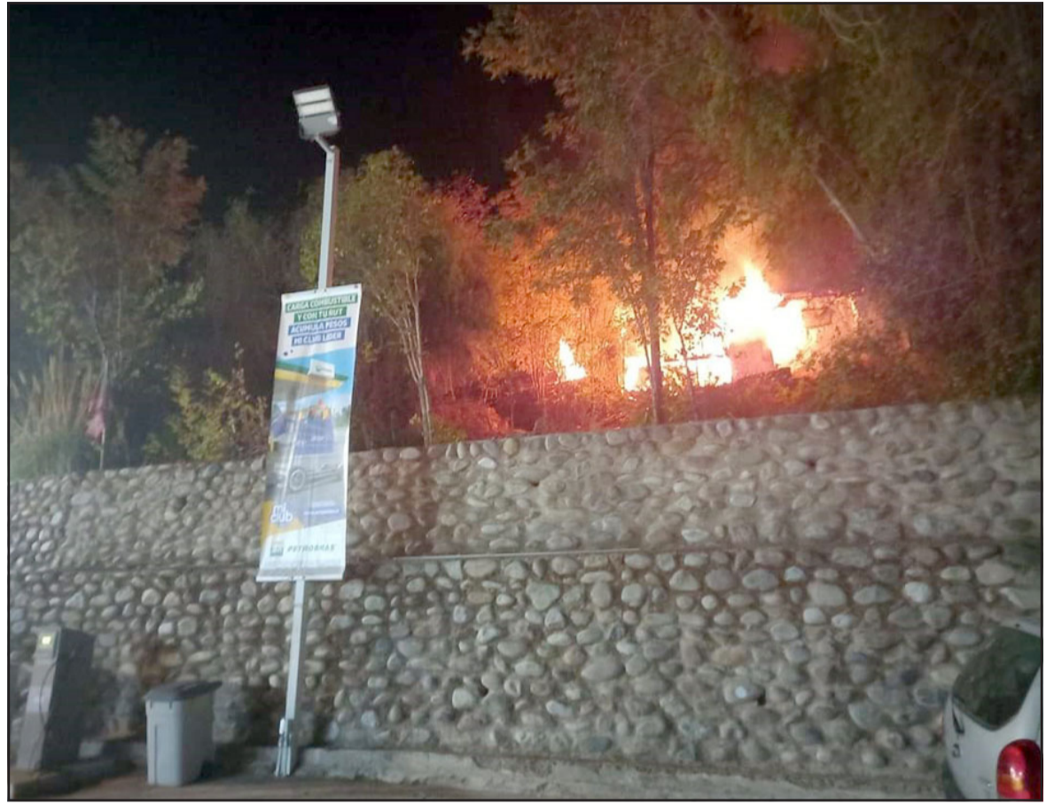
Las llamas consumiendo la casa en el Cerro El Llano de Putaendo.