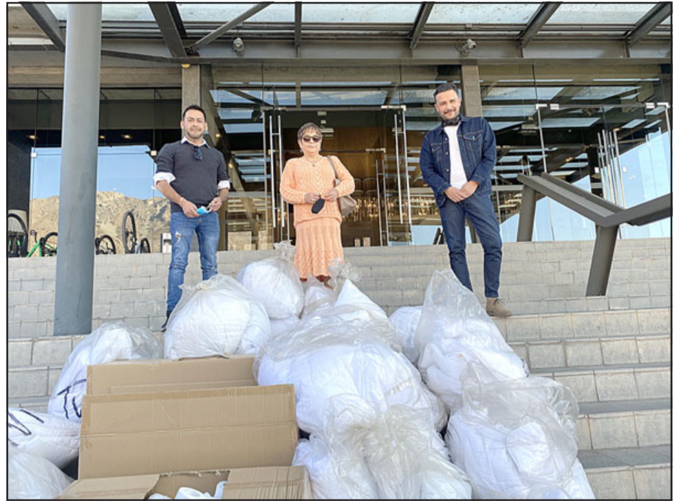
Representantes del Hotel del Valle entregaron una serie de implementos en perfecto estado para quienes pernoctan y hacen uso del albergue municipal.

Quienes deseen sumarse con aportes para quienes más lo necesitan, se pueden acercar al albergue municipal ubicado en calle Salvador Allende N°131 en la Población Ambrosio O'Higgins, o en Dideco de la Municipalidad de Los Andes en calle Las Heras 196, esquina Membrillar.