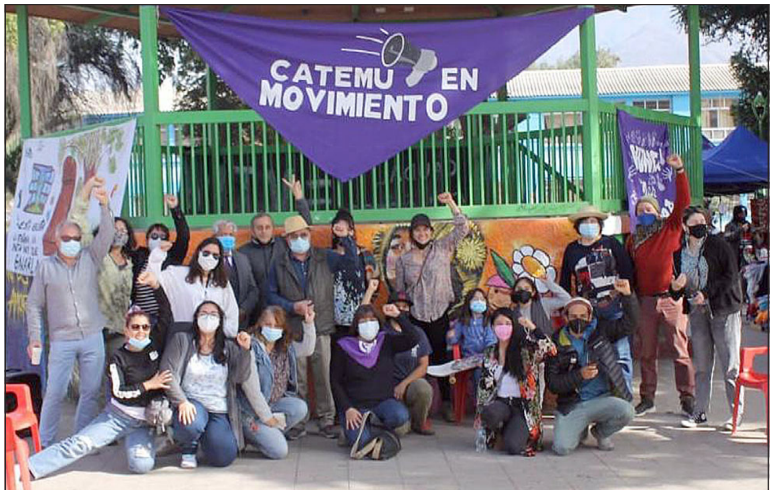
Los integrantes de 'Catemu en Movimiento'.

Rodríguez aprovecha para hacer un poco de historia, indicando que esta Ley de Riego fue promulgada en el año 1985 «con el fin de promover las inversiones en sistemas de riego y drenaje, entonces el Estado comenzó a entregar subsidios a los agricultores para obra de infraestructura de riego, hasta ahí todo bien. El problema que a lo largo desde el '85 hasta ahora ya han pasado casi