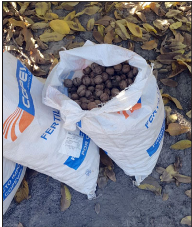
Las nueces robadas estaban valuadas en 500 mil pesos.