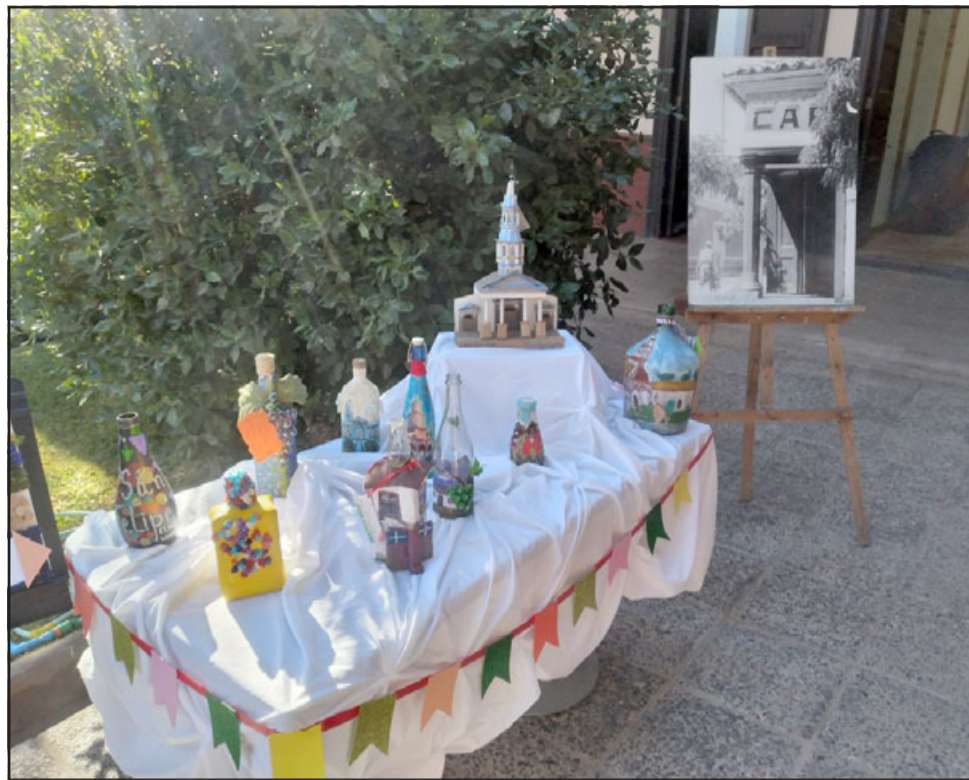
Parte de los trabajos ganadores del concurso 'Embotellarte' realizado el año pasado.