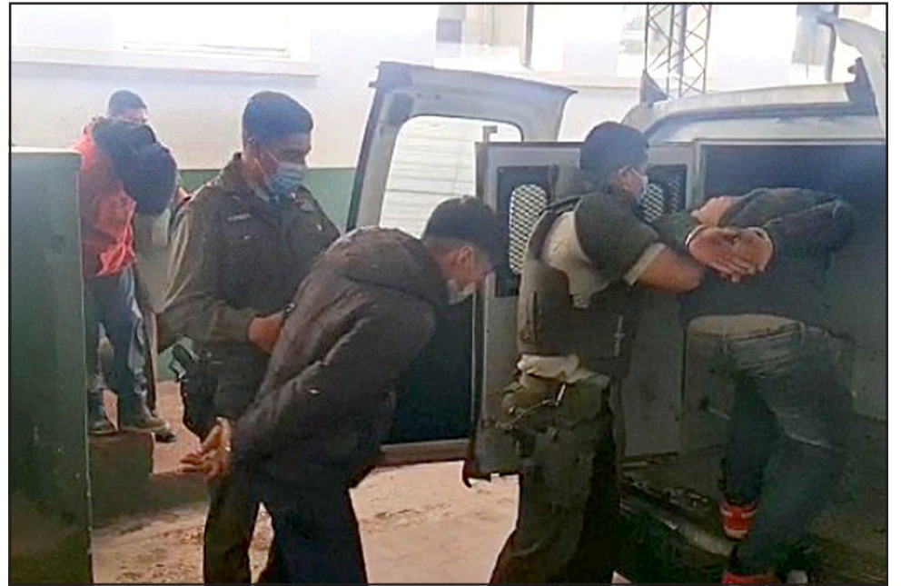
Siete personas fueron detenidas por robo de nueces en la comuna de Rinconada.

• Uno de los detenidos registraba dos órdenes de aprehensión vigentes por el delito de porte de arma blanca y violación de morada.-