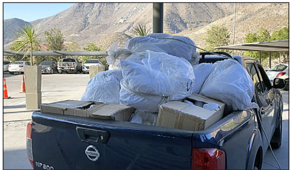
El Hotel del Valle de Casino Enjoy respondió al llamado del municipio con un importante aporte en ropa de cama, productos sanitarios y de higiene.