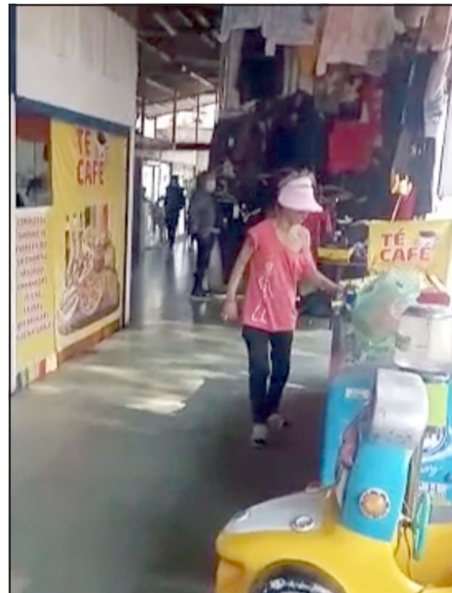
La mujer que provocaba incidentes en el terminal rodoviario fue trasladada hasta el Hospital Psiquiátrico de Putaendo.