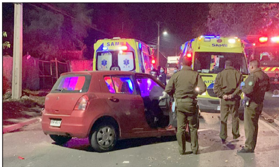
Una persona falleció tras chocar contra un poste en el sector de El Tambo en San Felipe.