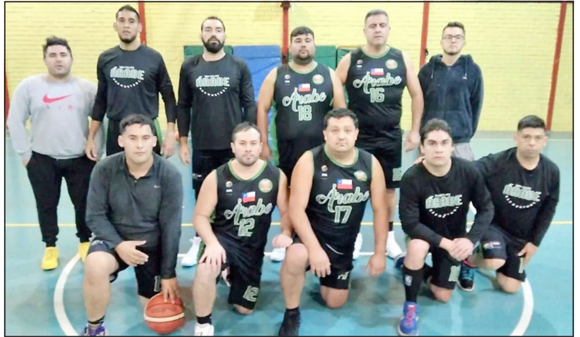
Los de colonia asoman como grandes favoritos en el torneo de Apertura de la ABAR.

Espartanos 77 – Prat B 85 Arca de Jafet 45 – CMB (Mixto) 80 Prat 51 – Árabe 69