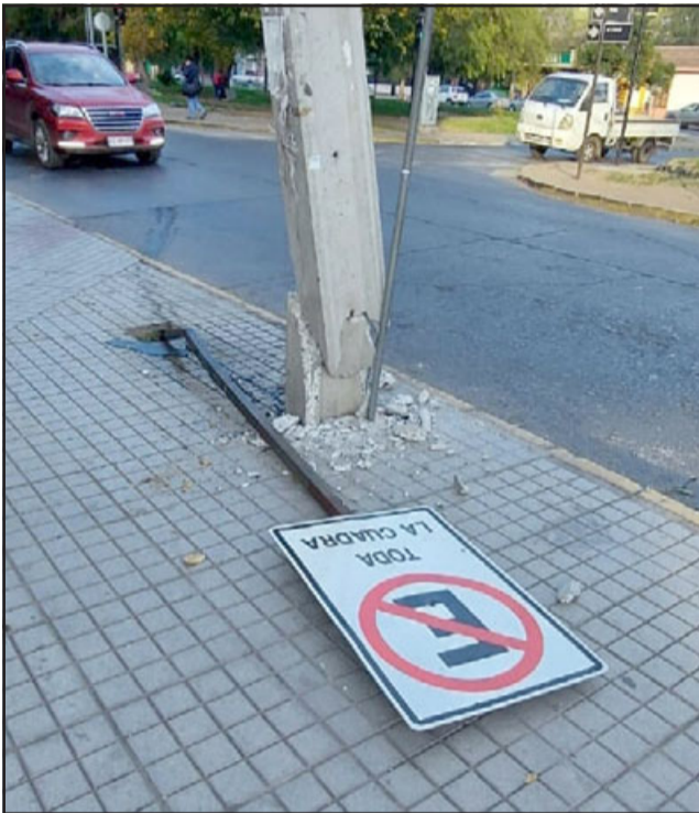
La señalética de 'No estaciona' quedó tirada en el suelo mientras el poste resultó seriamente dañado.

El conductor de un vehículo chocó un poste ubicado a la entrada del Terminal Rodoviario de San Felipe, ubicado en la Avenida Yungay, dándose posteriormente a la fuga. El hecho se registró este día viernes en horas de la madrugada.