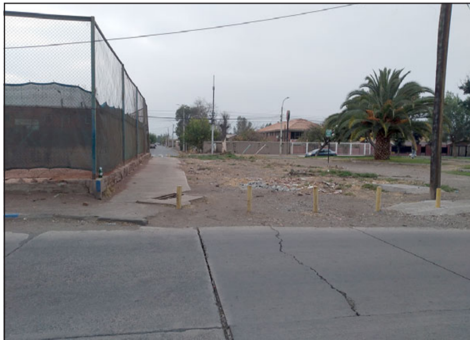
Aquí se construirá la continuación de calle Artemón Cifuentes tras el club de tenis.