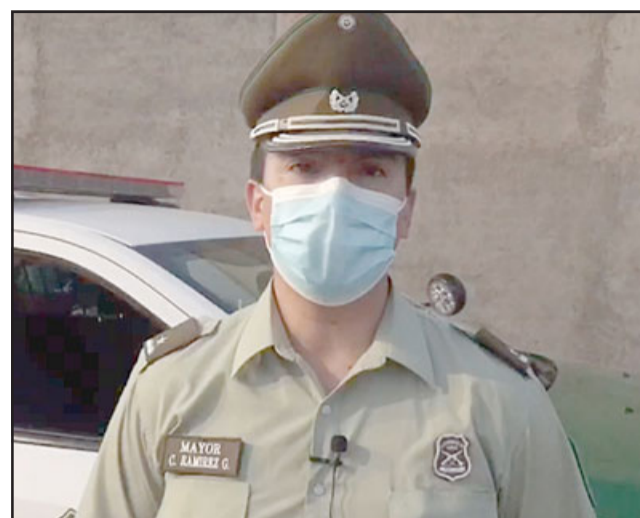
Mayor Cristian Ramírez Galdámez, comisario de San Felipe.

- No, no alcanzaron a robar, no lograron su cometido, dándose a la fuga del lugar, siendo rápidamente detenidos por Carabineros conforme a todas las coordinaciones que se hacen. Estamos conformes con el trabajo desarrollado, las coordinaciones que están dan-