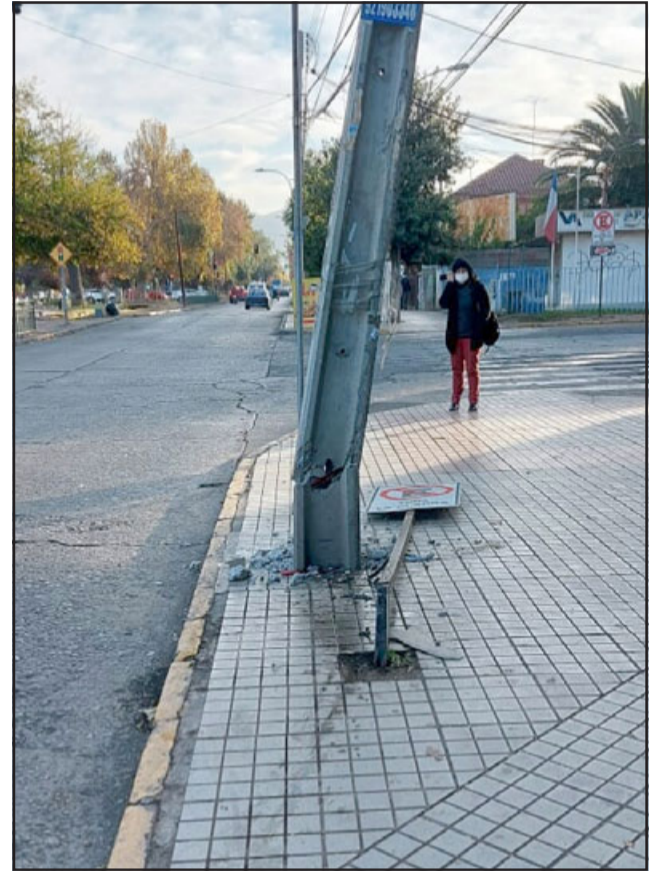
Acá se ve el poste, la altura en que se partió a poco menos de un metro de altura.

También en otro hecho que les llamó bastante la atención, fue que un grupo de sujetos a bordo de un furgón, ingresaron en la noche al interior del terminal solicitando un cargador a los guardias. Algo inusual. Por ende no le facilitaron lo pedido por un tema de seguridad.