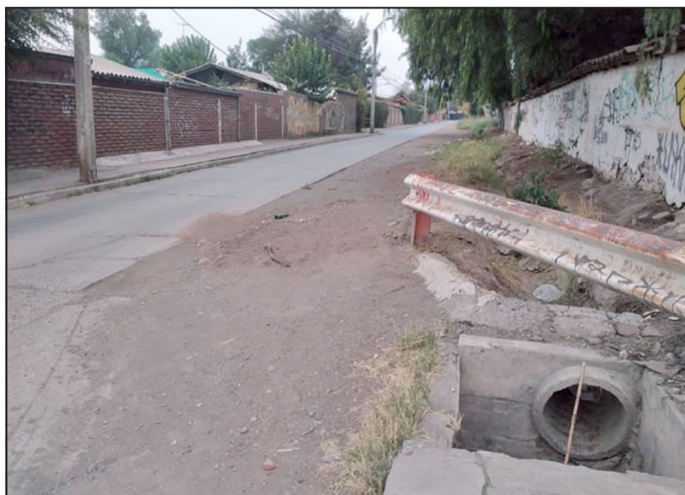
Este es el canal que será entubado en el marco de este proyecto.