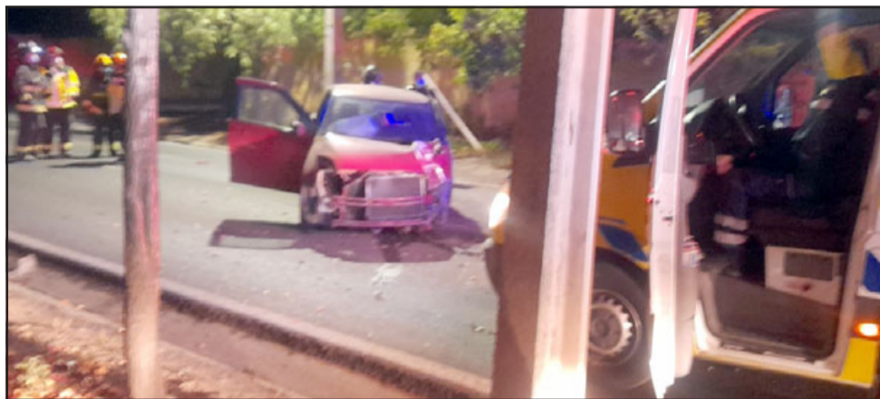
Así quedó el automóvil tras impactar contra el poste.

formó es sólo un vehículo, sin acompañante ni tampoco con terceros lesionados».