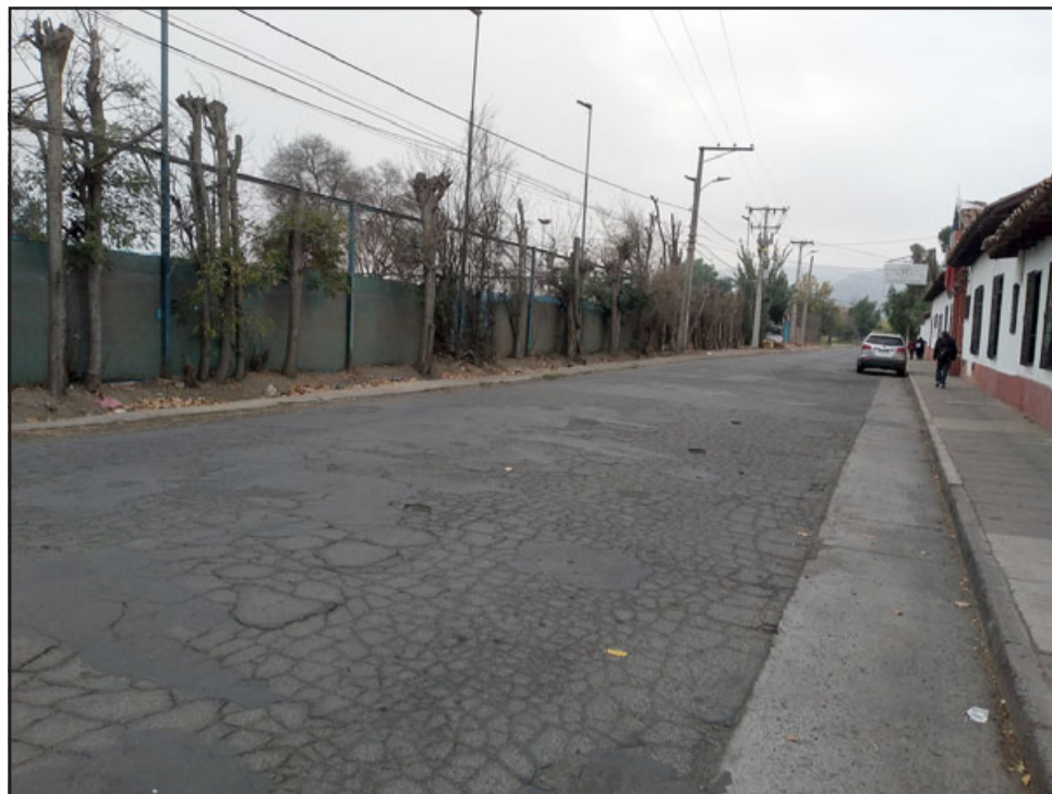
Así luce actualmente Yungay a un costado del club de tenis, el proyecto contempla el mejoramiento de esta vía.

Obras que se espera comiencen en las próximas semanas y que contemplan cortes de tránsito en el sector para la ejecución en sí del proyecto. «Todo este proyecto va a generar algunos cortes de tránsito en el lugar, se ha conversado con la comunidad, vamos a hacer cortes dejando vías de emergencia en el sector, en términos generales para avanzar con los plazos de 6 meses es trabajar con cortes totales».