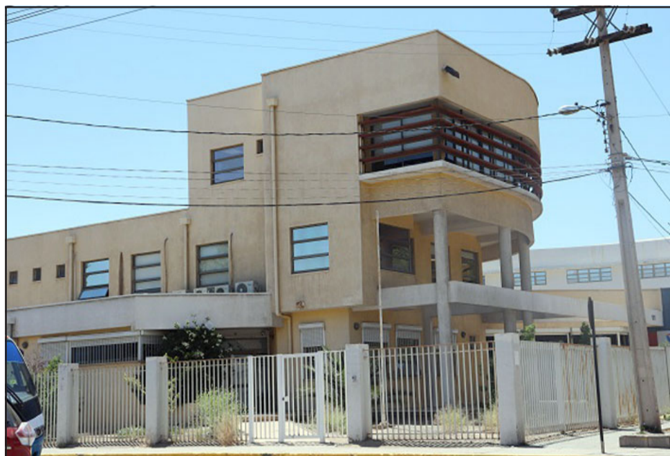
La fiscalía local de San Felipe fue escenario de un singular y curioso acto de ¿amedrentamiento?.

n todo caso se ignora si se trataba de arma de fuego o a foguero, o incluso adaptada.