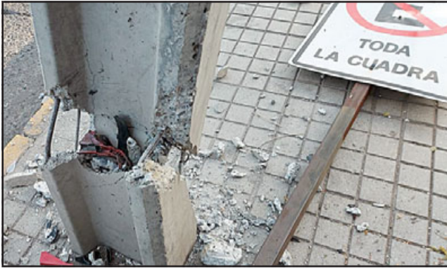
Solo la estructura de hierro del poste evitó que éste cayera, lo que habría provocado un daño aún mayor.