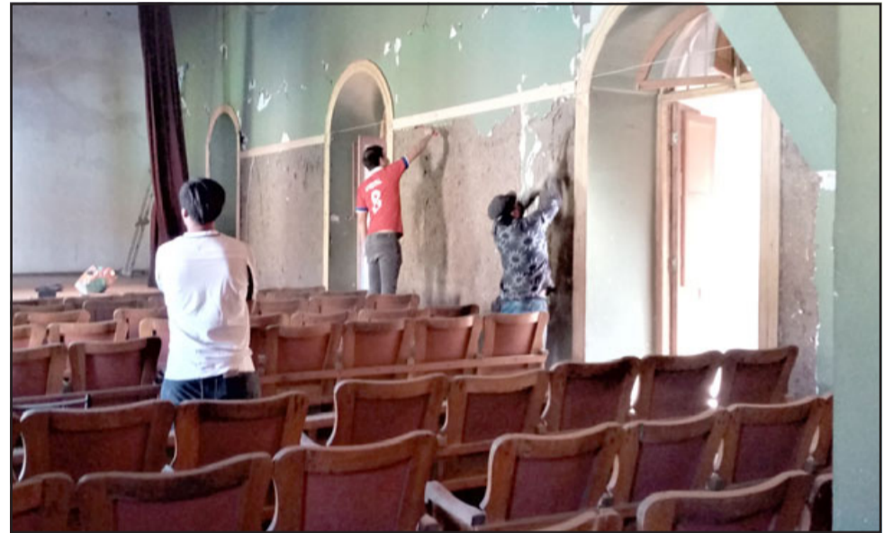
Las mingas comunitarias de restauración patrimonial, enmarcada en la campaña 'Teatro Cervantes de Todos', donde cada sábado de mayo se reúnen a trabajar voluntarios(as) para dejar en condiciones de uso el emblemático teatro ubicado en calle Bulnes.