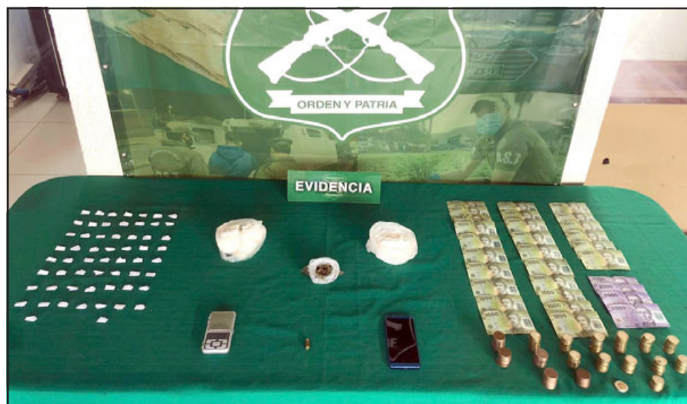
Pasta Base de cocaína, marihuana elaborada y otros elementos más fueron incautados tras un allanamiento en una vivienda en la comuna de Los Andes.