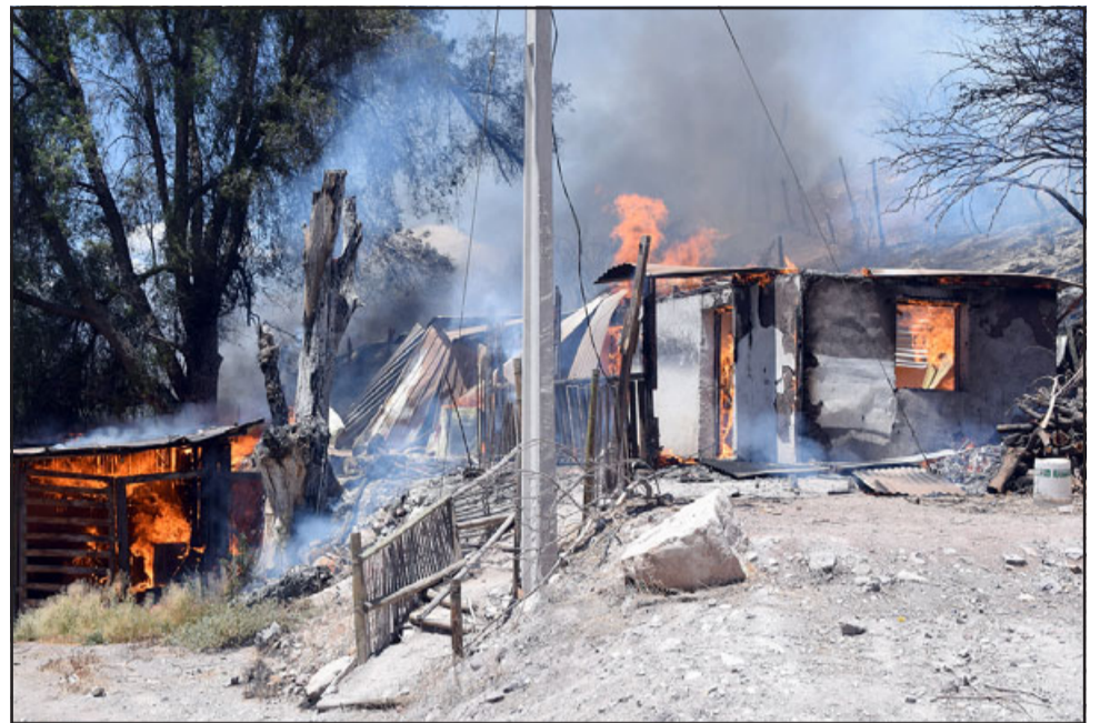
A las 4 de la madrugada se recibió un llamado telefónico informando que se estaba produciendo un incendio de pastizales en el sector de calle Encón, el que resultó ser estructural finalmente.

Emergencia que comenzó como un llamado de pastizales pero que fue cambiada rápidamente a estructural. «A la llegada del oficial de la primera instancia señaló que no se trataba de un incendio de pastizales, sino que de un incendio es-