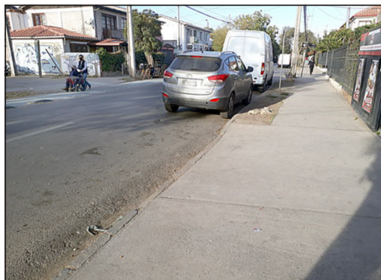
En este lugar, detrás de la SUV gris, concluyó el asalto que se inició poco antes en el pasaje Manuel Tapia que alcanza a verse a la izquierda.

- Yo llamé al tiro a Carabineros y deben haber llegado en unos cinco minutos más o menos, ahí todos se fueron hacia arriba con Carabineros y mi papá los acompañó.