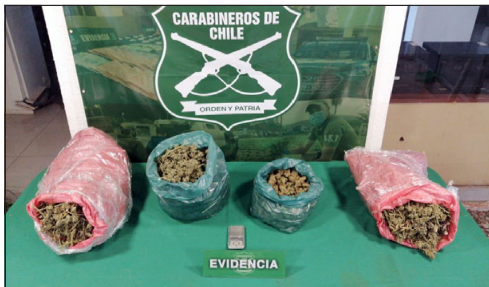
Más de seis kilos de marihuana elaborada decomisó el OS7 de Carabineros de Aconcagua desde una vivienda en la comuna de Catemu.

Dos importantes procedimientos llevados a cabo por personal del OS7 de Carabineros de Aconcagua que logró sacar de circulación más de 7 kilos de droga en nuestra zona que serían comercializadas en el sector.