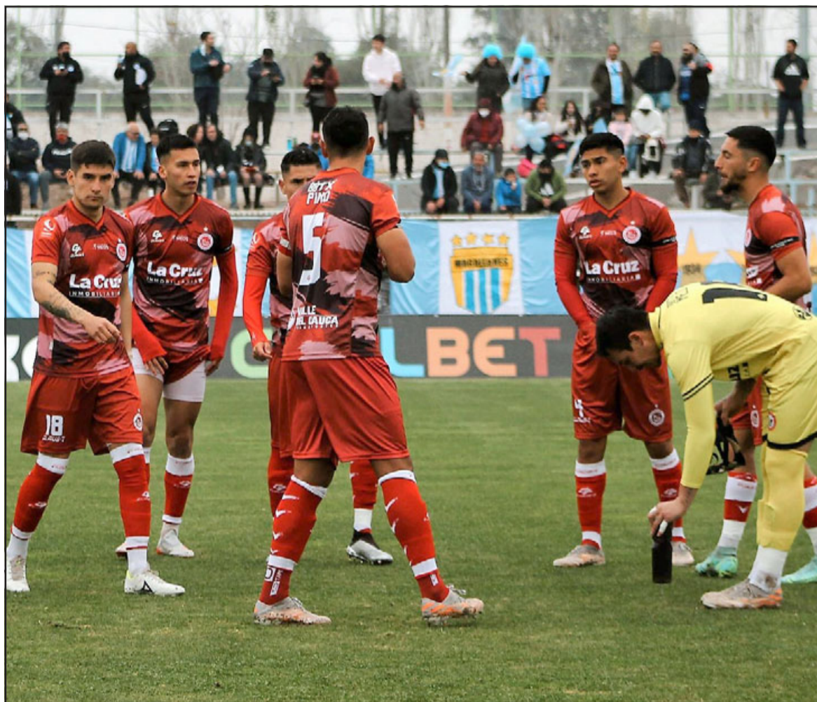
Mañana el cuadro albirrojo enfrentará al sub colista del campeonato.

En la conversación con El Trabajo Deportivo, el longevo deportista aportó, además: «No hice el tiempo que acostumbraba para la distancia, pero estoy muy contento con los 7 minutos que logré en promedio por cada kilómetro, nada mal si se tiene en vista que no había entrenado mucho y además no estaba en el peso ideal; ahora esto era algo personal para probarme que puedo seguir corriendo que es lo que más me gusta hacer».