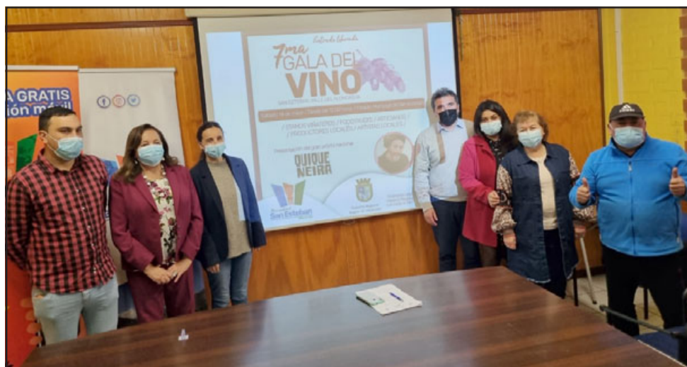
Este martes se realizó el lanzamiento de la 'Gala del Vino' de San Esteban, actividad que tendrá lugar este sábado desde las 12.00 horas, en el Estadio Municipal de San Esteban.

«Esta es una tradición muy relevante para la gente de San Esteban, porque están muy identificados con los viñateros. Esta festividad implicará un aporte para los emprendedores y para potenciar el turismo, que es una de las características que destaca a esta comuna», afirmó la CORE