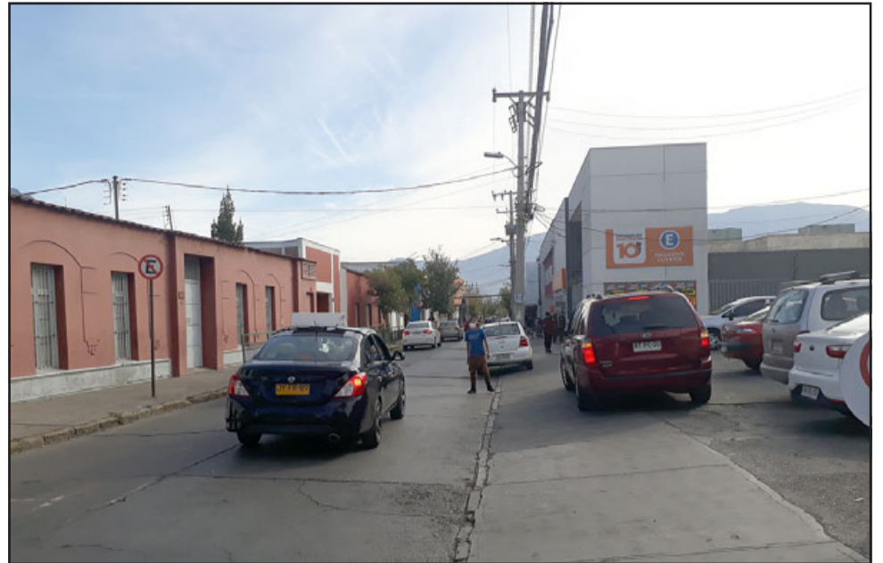
Los taxi colectivos son una necesidad para miles de sanfelipeños que se movilizan en este tipo de vehículos.

Además se manifestó sorprendida la presidenta de la UNCO San Felipe «porque encuentro que es un monopolio, ellos lo ha-