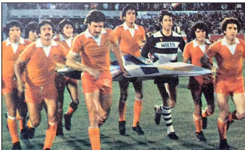
Jugadores del histórico Cobreloa que fue doble finalista de la Libertadores, estarán presentes en Santa María.