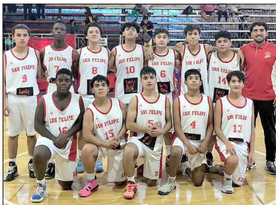
San Felipe Basket protagonizará uno de los grandes pleitos en la Libcentro.