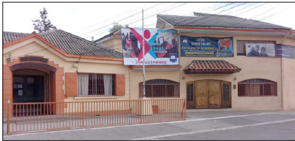
La tranquilidad del Liceo Darío Salas de Santa María se vio bruscamente alterada cuando un alumno golpeó al inspector del establecimiento.

«El día de hoy (ayer) están suspendidas las clases porque vamos a trabajar en el tema de los protocolos, porque existe uno y se llevó bien a cabo, porque ningún