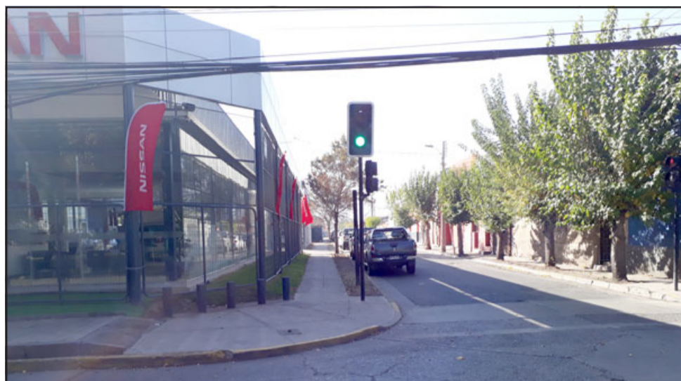
Esta es la automotora donde Carabinero frustró un robo durante la noche de este miércoles.

Aprovechamos para consultar sobre una reunión realizada este día miércoles en la tarde con vecinos en la Escuela 58, donde participaron otras autoridades. Al respecto indicó que fue una cita donde fueron invitados por la Unión Comunal de Juntas de Vecinos, donde se puede evacuar información de primera fuente; «tener una retroalimentación de todas las cosas que eventualmente se puede mejorar. Así es que en ese contexto se pudo reunir la alcaldesa, la delegada presidencial, los respectivos encargados de seguridad de