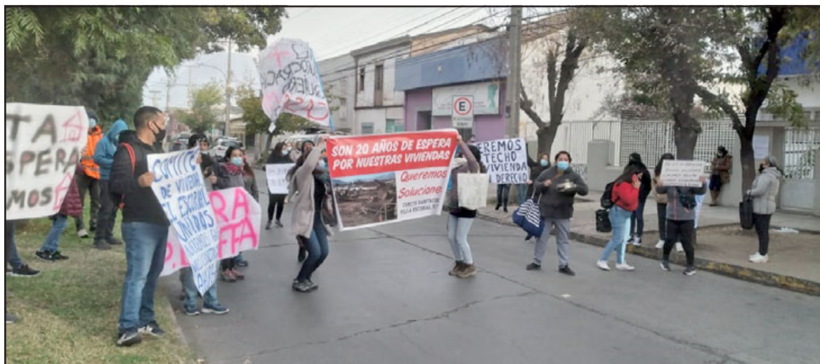
Familias pertenecientes al Comité Habitacional Villa Escorial II Etapa, se manifestaron frente a la oficina del SERVIU.