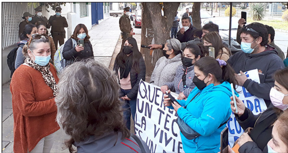
Familias pertenecientes al comité se fueron satisfechas con la respuesta desde SERVIU.