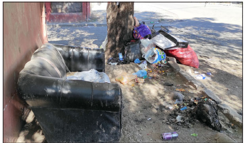
MUEBLES VIEJOS.- La Municipalidad de San Felipe lleva años intentando retirar estos muebles viejos del lugar, los inquilinos se oponen.

Diario El Trabajo habló con el administrador