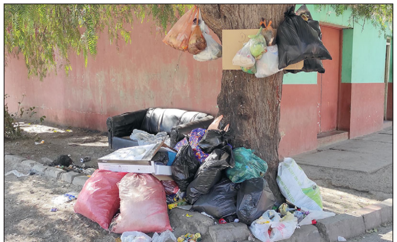
CITÉ DE EXTRANJEROS.- Esta es la triste postal que los vecinos de este pasaje deben soportar regularmente en una vivienda en la que, según ellos, viven cerca de 50 personas.