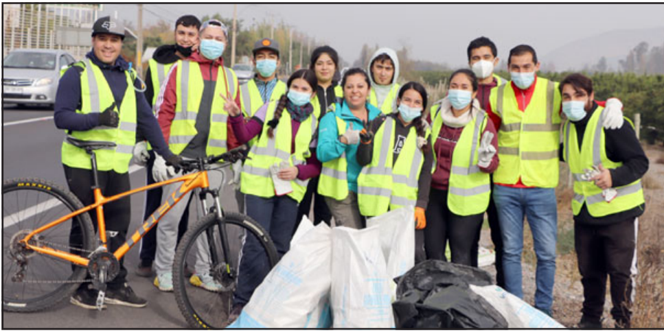
Integrantes de grupos juveniles, acompañados incluso del alcalde, efectuaron la limpieza en toda la faja de la ruta, a la altura del sector de Escorial.