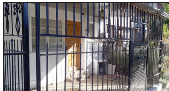
Al interior de esta vivienda ocurrió el cobarde ataque sexual a la joven guardia de seguridad de sólo 22 años de edad.

- ¿O sea se descarta que haya habido una