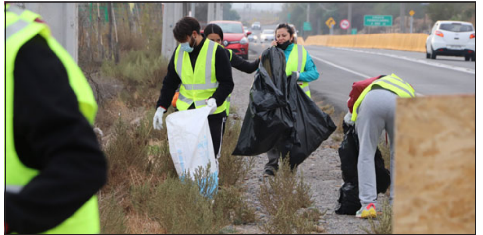
Los jóvenes voluntarios se levantan muy temprano un día sábado, dejando de lado su descanso para colaborar con la comunidad.