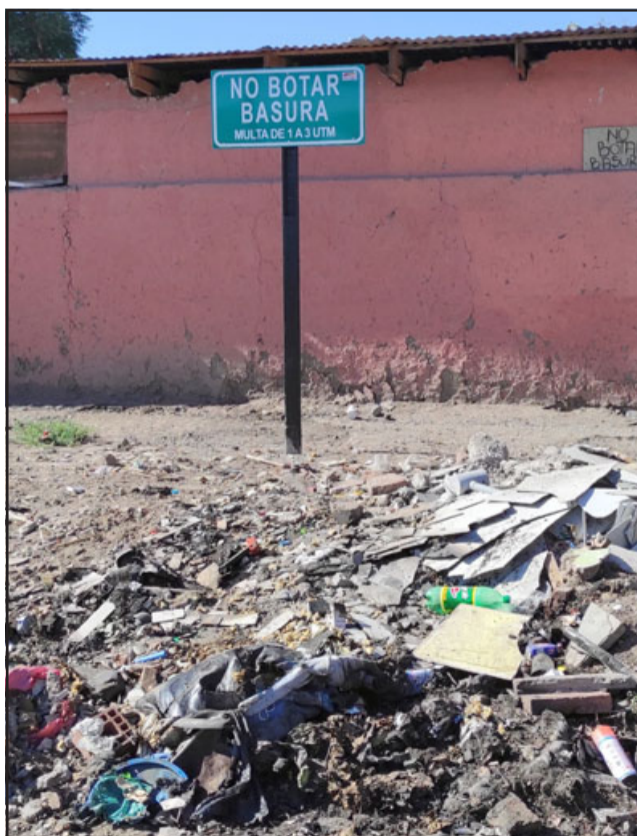
NO ACATAN.- Aunque haya señalética prohibiendo arrojar basura, de igual forma pocos lo respetan.