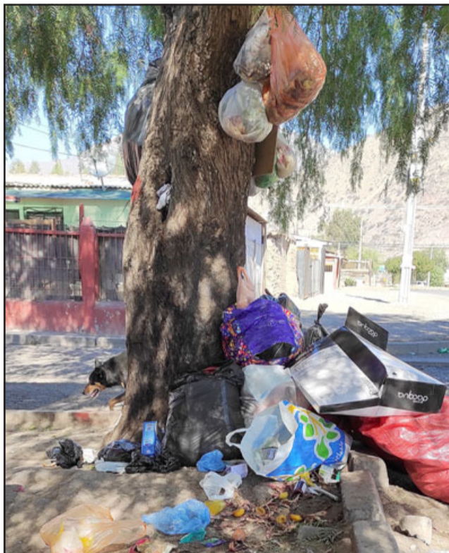
NAVIDAD EN MAYO.- Parece un 'Árbol de Navidad', pero en este caso son bolsas de basura. Los vecinos aseguran que a veces hay ratones, orinan las personas y defecan en esa esquina.