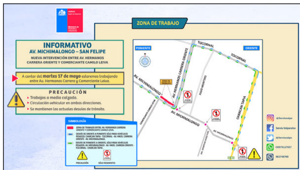
A partir de hoy comienzan obras en Avenida Michimalonco, entre calle Hermanos Carrera y Comerciante Camilo Leiva.

Respecto del avance de las obras en el tramo 3, que contempla la parte más cercana a la rotonda Monasterio, y que provocó una serie de inconvenientes y reclamos de parte de los vecinos, la respuesta a la solicitud de