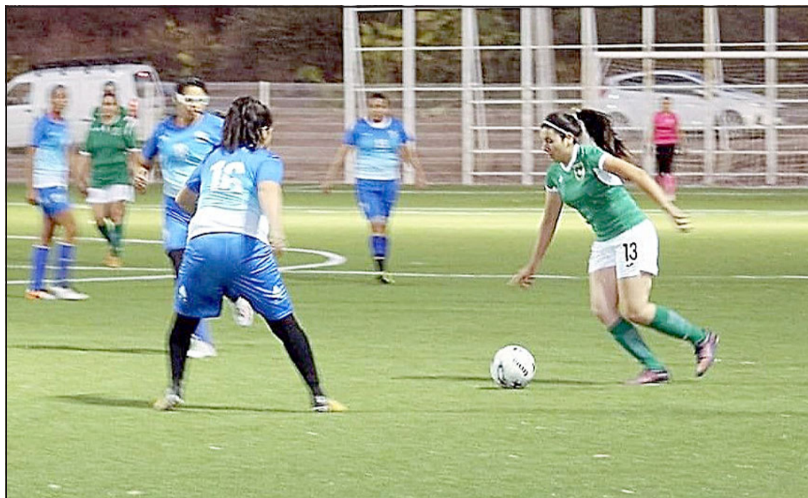
Este sábado se levantará el telón en la Copa de Campeones de mujeres.