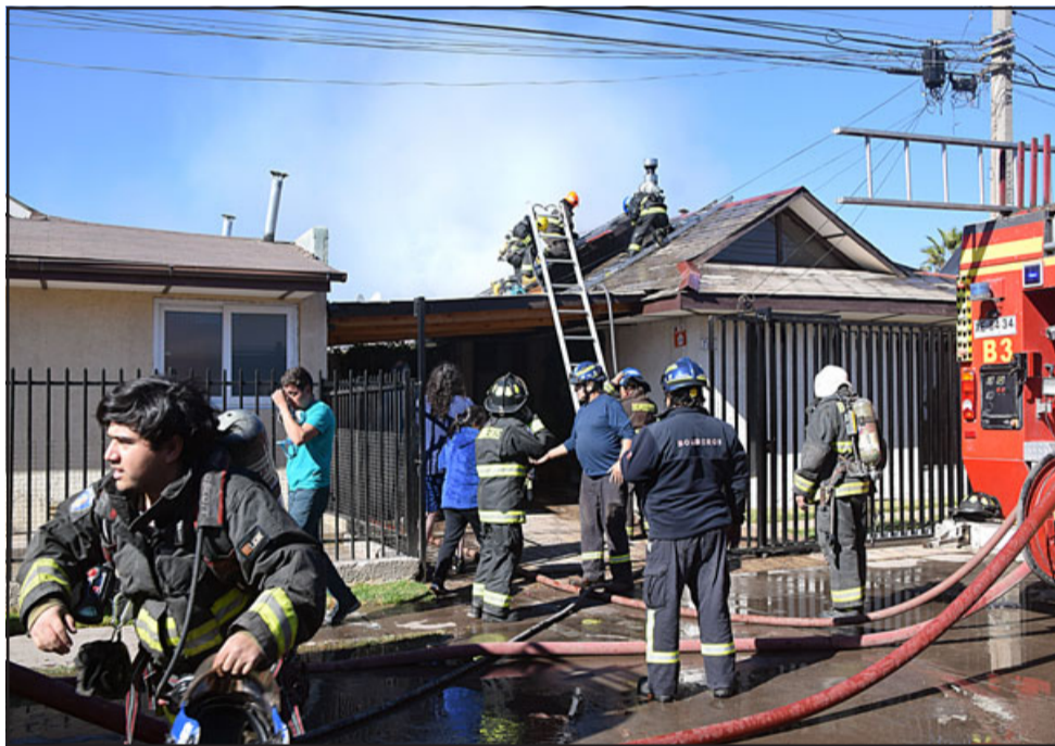
DESPLIEGUE BOMBERIL.- Se necesitó más de medio centenar de voluntarios de las siete compañías de Bomberos de San Felipe.