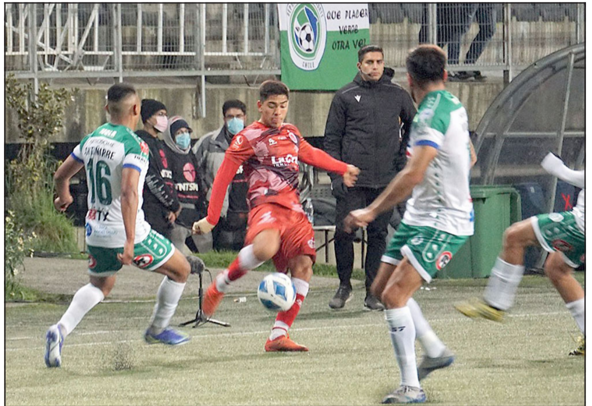
Ante Deportes Puerto Montt el Uní Uní sufrió su segunda derrota en el actual torneo.

Con esta caída, la segunda que sufre en el torneo, San Felipe quedó ubicado en la cuarta plaza en la tabla de posiciones con 21 puntos (tres partidos menos), ya muy lejos del súper líder Magallanes que tiene 40.