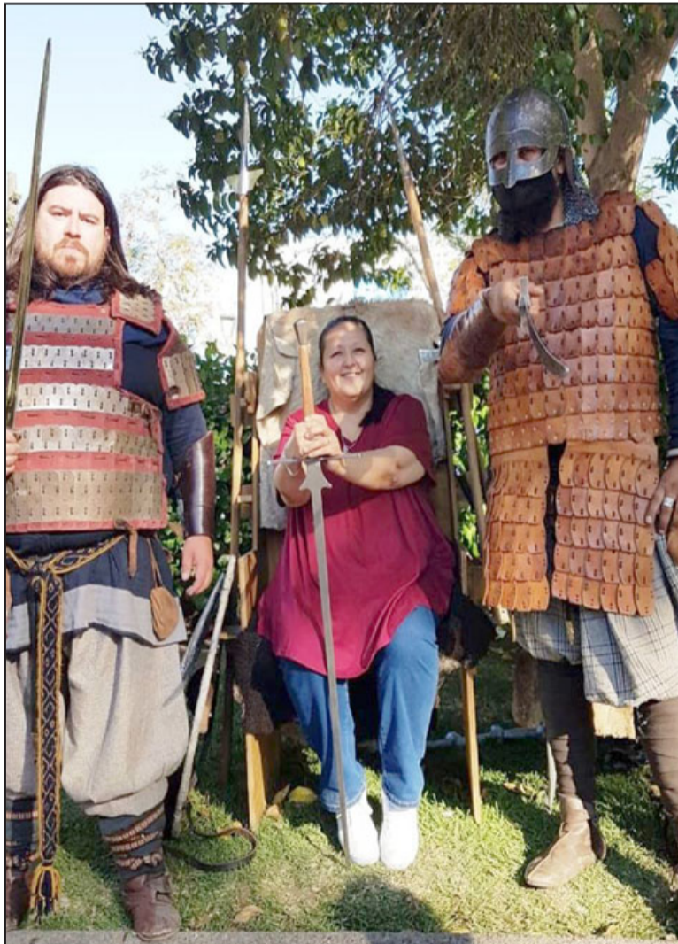
VIKINGOS A LA CHILENA.- Algunos exponentes llevan años dedicándose a este tipo de actividades recreativas en Aconcagua.