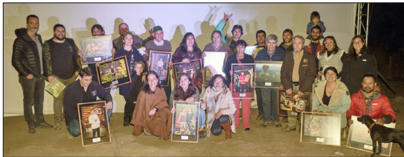
Ellos son los protagonistas del largometraje, quienes a través de su oficio o trabajo son un aporte al territorio del Aconcagua desde la cultura y las artes, la gastronomía, el deporte, la protección al medioambiente y a la diversidad de la flora y fauna.

cagua, con el fin de dar a conocer y trabajar sustentablemente en el patrimonio material e inmaterial del territorio. «Poder mostrar a la comunidad los tesoros vivos del valle es fundamental para el desarrollo de éste. Como Fundación Lepe, contar historias como las de los Talentos del Aconcagua resulta primordial porque ellos representan la identidad del Valle, la cual es muy diversa. A través de sus oficios y pasiones cada uno de ellos y ellas aportan al desarrollo sostenible de este territorio. Una de las misiones de la Fundación Lepe es contribuir a visibilizar a esta comunidad y el valor que hay detrás. El patrimonio cultural, material e inmaterial del Valle, junto con la promoción y transformación hacia un sociedad ambientalmente sustentable es muy potente, por lo cual vamos a seguir trabajando unidos para seguir desarrollando nuevas iniciativas