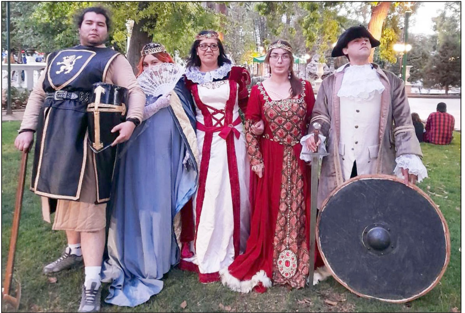
SIEMPRE CAMERATA.- Camerata Aconcagua también participó en esta sexta versión de la Feria Medieval de San Felipe.