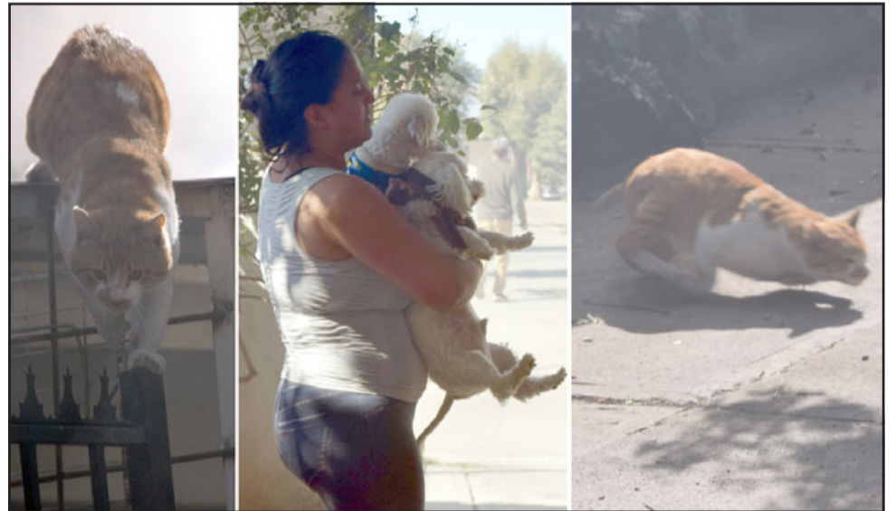
HUYEN POR SUS VIDAS.- Las cámaras de Diario El Trabajo captan cómo este felino logra ponerse a salvo por los techos hasta llegar a la calle, mientras que esta vecina logra sacar con vida a sus pequeñas mascotas.