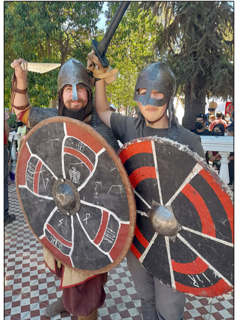
VIENEN LOS VIKINGOS.- Cada uno de ellos cuenta con identidad propia, han investigado mucho para elaborar estas indumentarias.