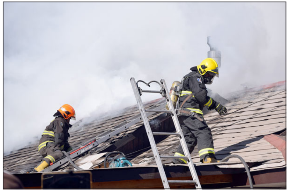
HÉROES EN ACCIÓN.- Los 'Caballeros del Fuego' debieron destechar la vivienda para controlar los focos calientes en el entretecho de la casa afectada.