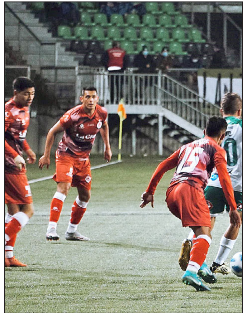
La zaga sanfelipeña controla un embate ofensivo de los 'delfines'.