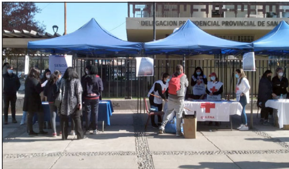
Iniciativa tiene por objetivo concientizar a los más jóvenes en el cuidado y prevención de esta enfermedad.