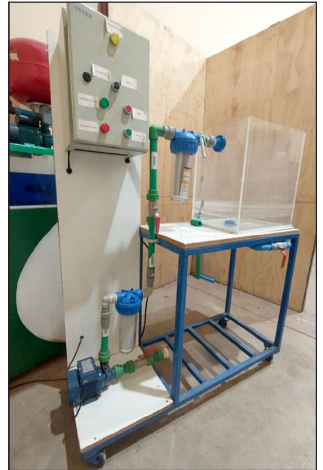
GOTAA GOTA. - Con el proyecto 'Gota a Gota' (reutilización de aguas grises) tenemos a Benjamín Montenegro y Leonardo López.