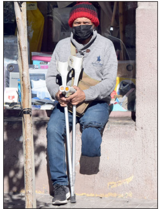
APOYEMOSAL 'MACHA'. - Este amigo sanfelipeño lleva años recibiendo monedas en calle Prat, ojala nuestros lectores le ayuden a obtener esa pierna ortopédica.