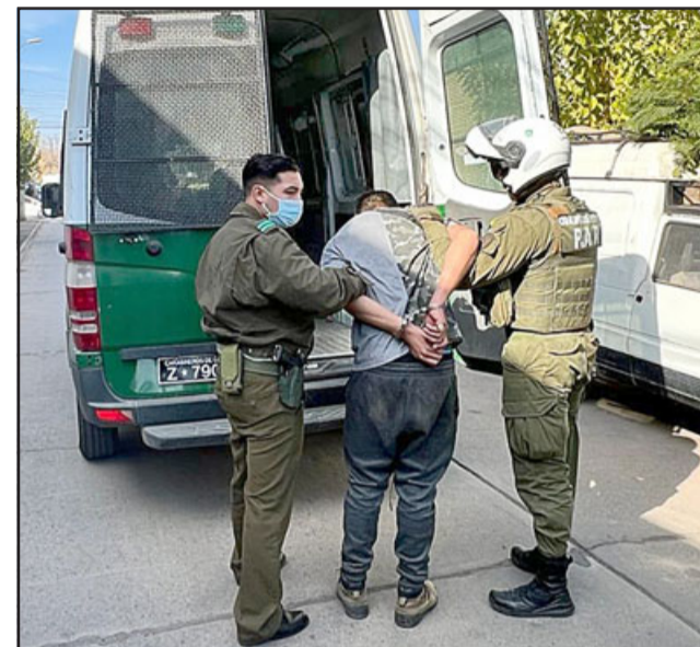
El sujeto detenido siendo subido a un furgón policial.

• Banda 'Los Che' irrumpió a punta de pistolas en el local ubicado en Avenida O'Higgins en julio de 2019.-