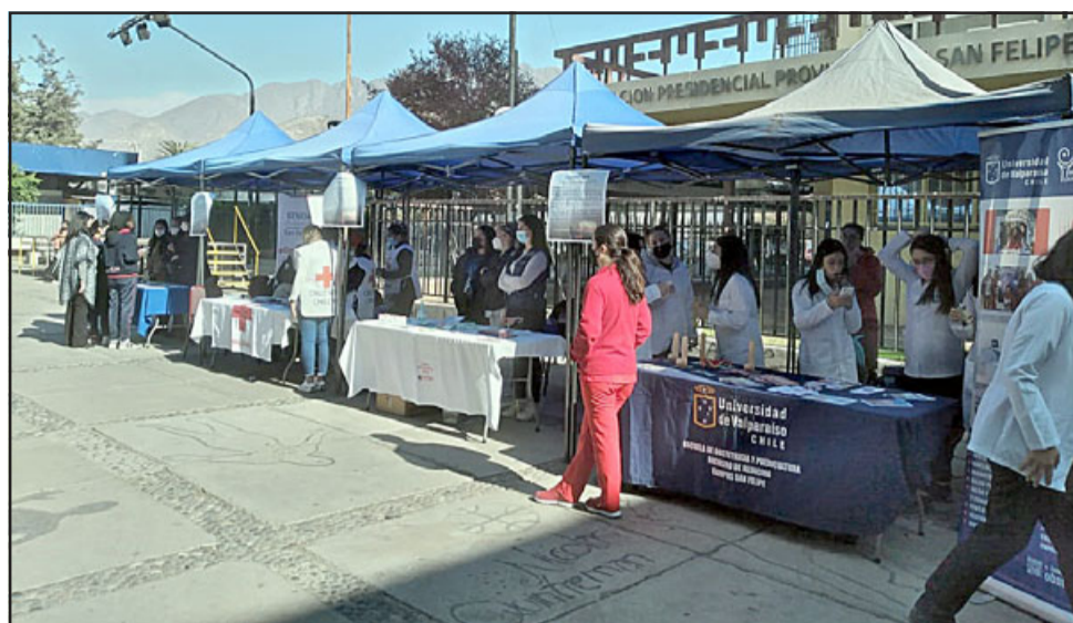
Distintos actores de la salud presentes en la feria educativa del VIH Sida.