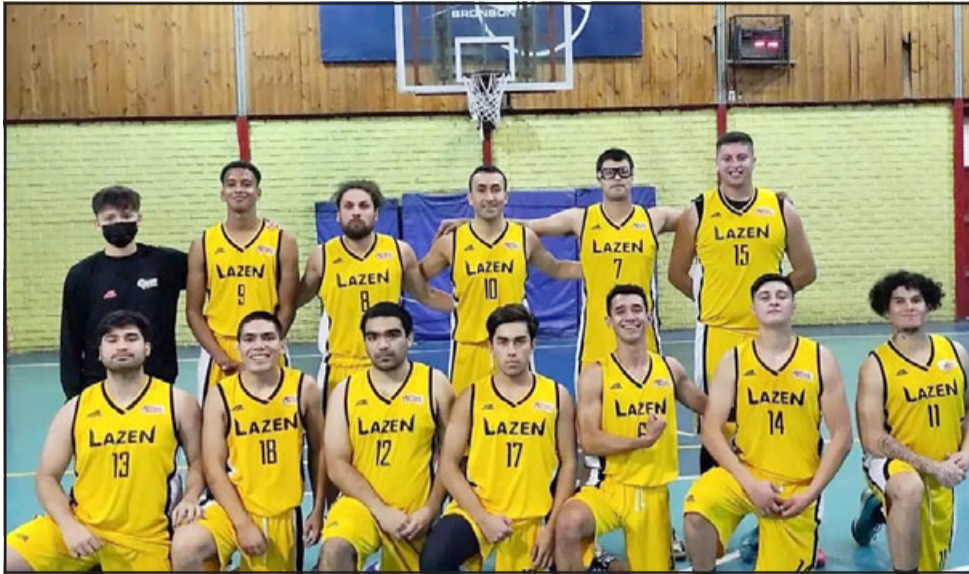
Lazen es uno de los líderes de la Primera División del torneo de la Asociación de Básquetbol Alejandro Rivadeneira (ABAR).