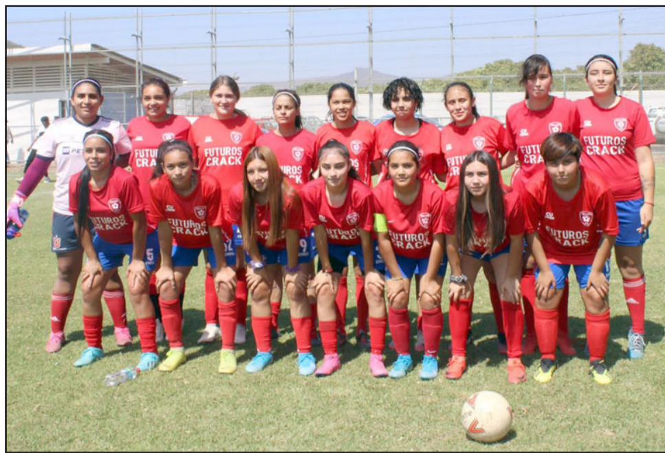
El equipo femenino de la Escuela de Fútbol Futuros Crack de Catemu, que desde el próximo 29 de agosto y hasta el 05 de septiembre representará a Chile en las Islas Galápagos.

- Es un torneo internacional donde por lo que tengo entendido y me ha hablado el organizador, hay hasta una selección mexicana