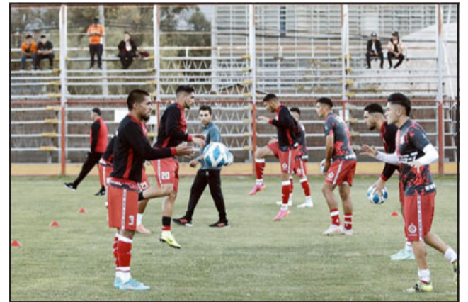
Los albirrojos están obligados a ganar si quieren seguir soñando con el premio mayor de la B.