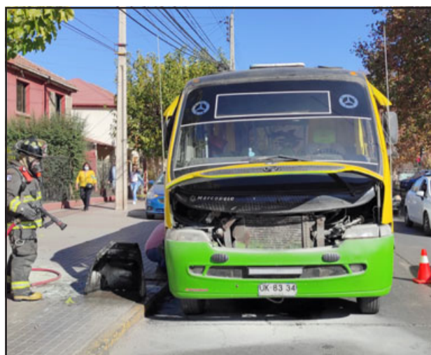
tuación. El incidente ocurrió la tarde de este miércoles.

Un repentino incendio en el motor de un microbús de transporte público obligó a su conductor a detenerse de emergencia en la esquina de Avenida Yungay con calle Merced. Rápidamente este mismo conductor logró desmontar la pieza protectora del motor para aplicar el químico del extintor de incendios, controlando él mismo la situación. Al lugar llegó una unidad de Bomberos para asegurar la si-