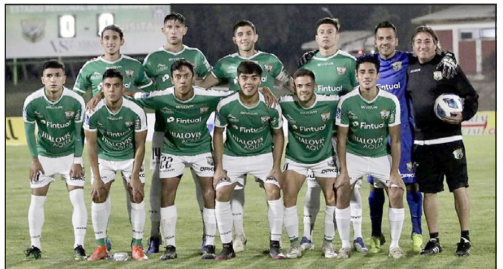
Trasandino enfrentará mañana a Independiente en Talca.