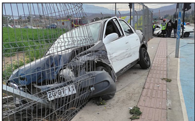
PUDO SER PEOR.- Este vehículo terminó incrustado en un terreno agrícola luego de la colisión, llevándose a su paso la malla metálica.