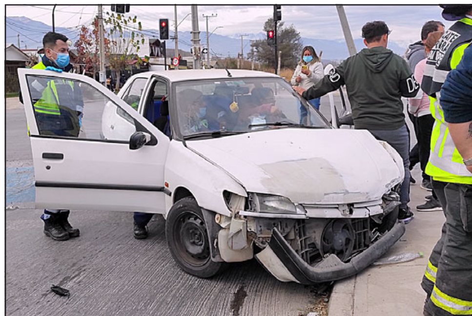
MUJER LESIONADA.- Una mujer adulta resultó lesionada en esta colisión. Personal médico la atendió minutos después.