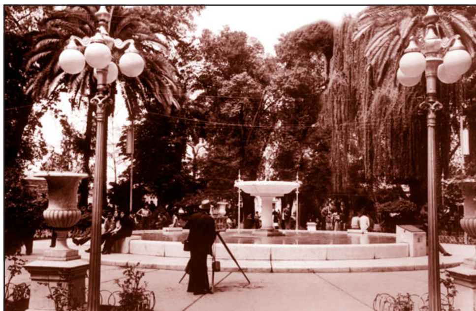
NUESTRA PLAZA.- Así lucía nuestra Plaza de Armas en los años ochenta, fotos como esta estarán en exhibición este sábado.