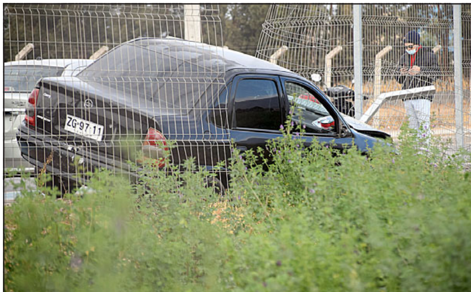
SE SALIÓ DE LA VÍA.- A lo lejos la lente de Diario El Trabajo capta el vehículo que quedó metido en un terreno agrícola tras romper la malla perimetral.