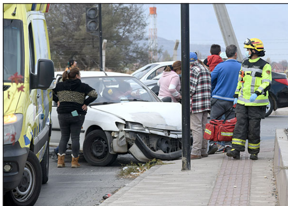
APARATOSO.- Personal de Bomberos, SAMU y Carabineros atendieron esta colisión registrada en el cruce de los semáforos de las avenidas Hermanos Carrera Norte y Oriente a las 13:16 horas de este viernes.