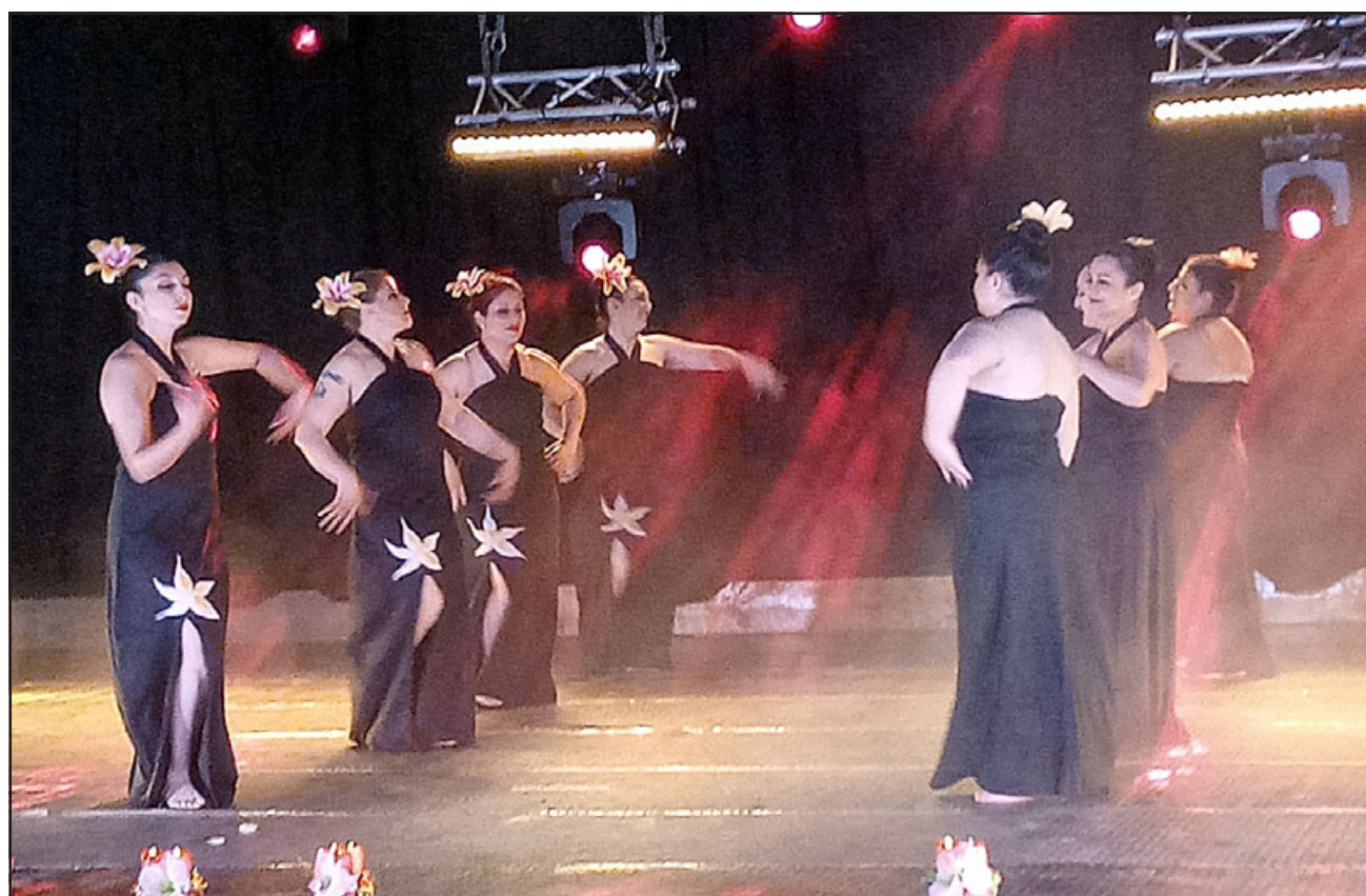
GRATIS.- Varias agrupaciones artísticas y culturales de la zona estarán presentando sus trabajos de manera gratuita.