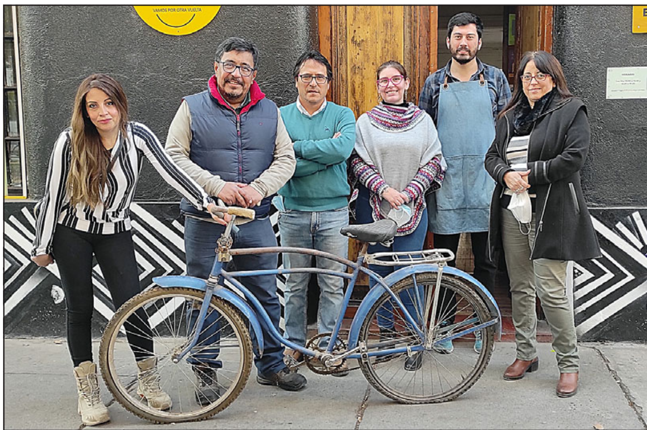
ELLOS AL FRENTE.- Aquí tenemos a parte de los artistas involucrados en esta celebración del Día del Patrimonio.