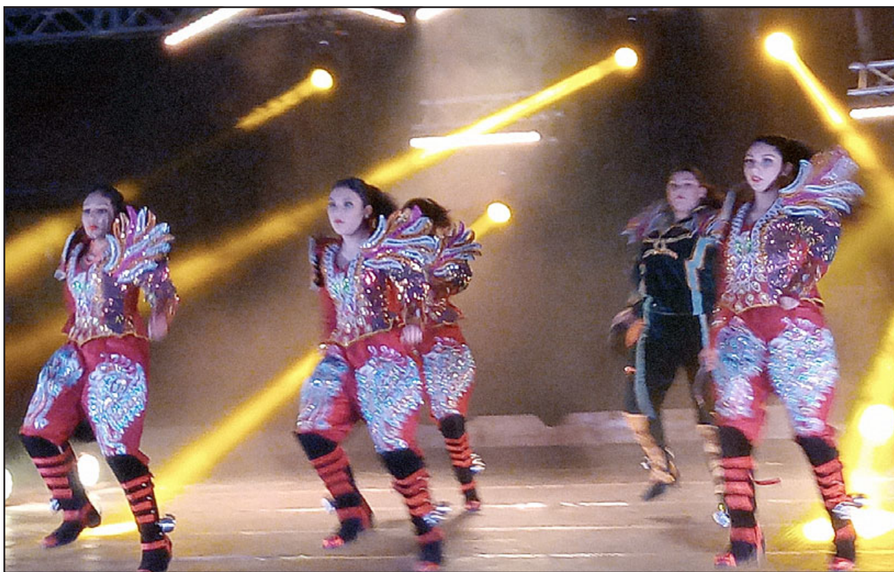
TODA LA SEMANA.- Danza, literatura, historia y cultura esta semana en Putaendo, actividades para celebrar la Fiesta de los Patrimonios. Ellas son Semillas de Orolonco.

Continuamos con un viernes igual de intenso mis amigos del Valle del