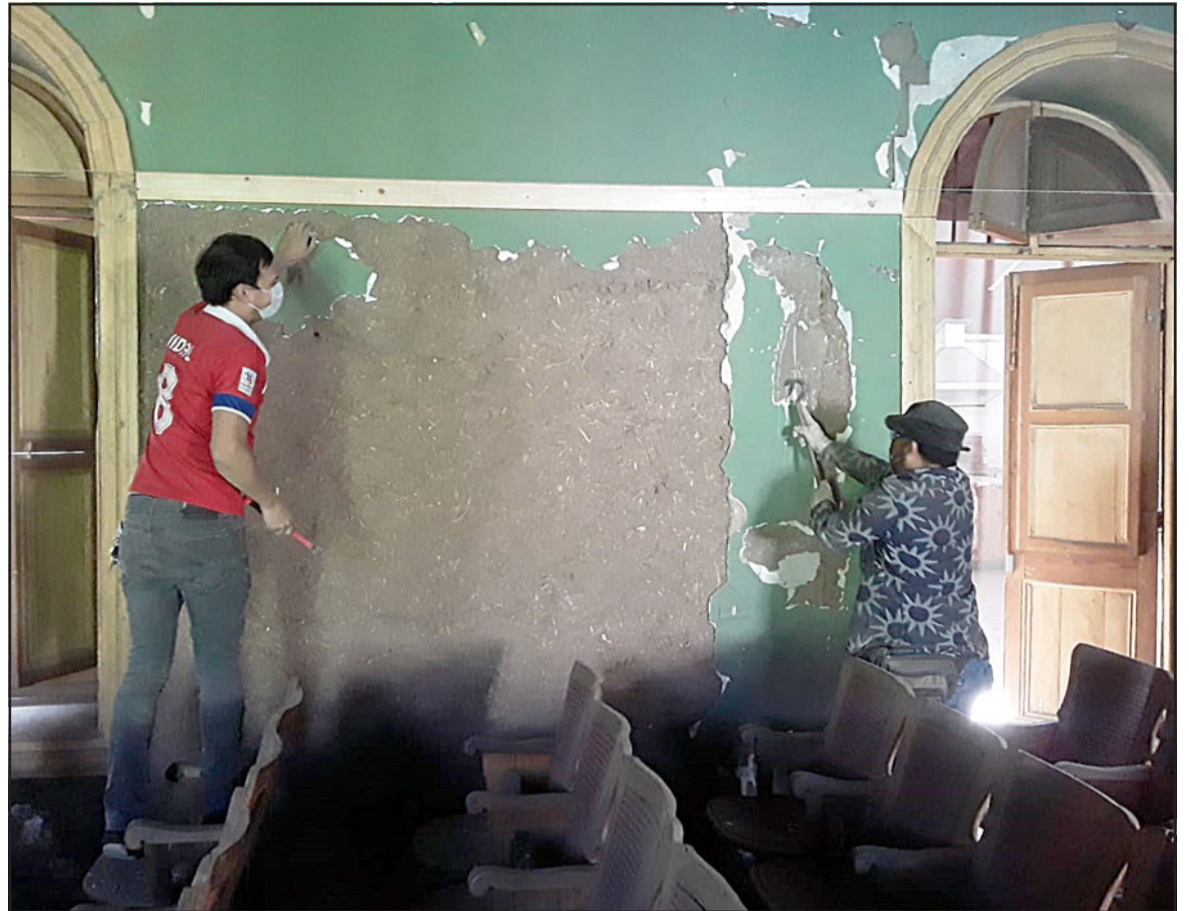
CASI LISTO.- Toda esta semana han estado trabajando los promotores para poner en funcionamiento el Teatro Cervantes, de Putaendo.