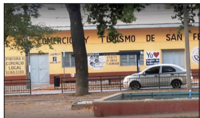
Cámara de Comercio de San Felipe ve con preocupación posible 'migración' de bandas de comercio ambulante desde Santiago.

Sin ir más lejos, y según aseguró Gajardo, « se han detectado bandas que vienen con camiones a vender verduras, no son simplemente personas que necesitan