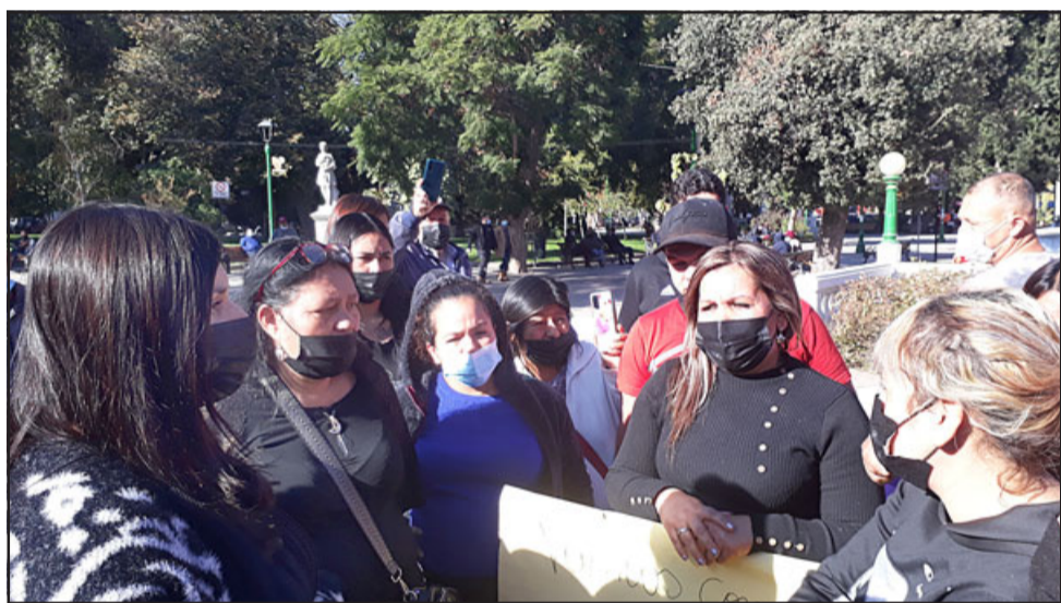
La Delegada Presidencial Provincial, primera de izquierda a derecha, en pleno diálogo con las comerciantes, quienes le planteaban respetuosamente sus inquietudes.

pedido nada gratis, a mí me gusta trabajar. Necesito horario flexible, mi hijo tiene dos años y ha tenido problemas que no orina bien, se hace pipí, tengo que ir corriendo hacia allá, me ha pasado, tengo las pruebas, entonces no puedo trabajar hoy en día en un trabajo normal, de hecho yo soy ingeniera comercial, me vine de Santiago hace dos años para acá con mi hijo y me ha costado un montón encontrar trabajo», dice.