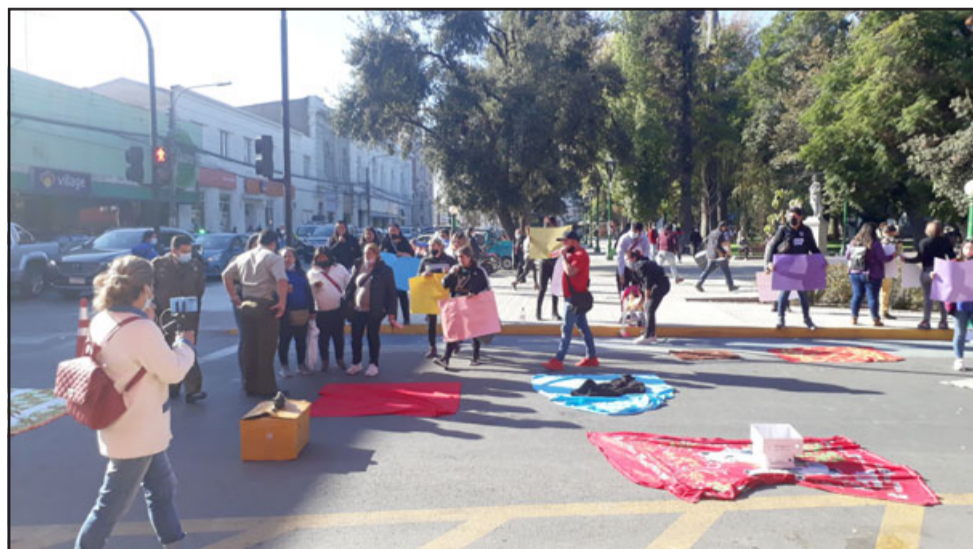
Carabineros conversó con los comerciantes para que subieran a la acera de la plaza y así no interrumpir el flujo vehicular.

Indicar que toda la manifestación se hizo en completa calma, no hubo altercado alguno. Carabineros por medio del capitán Rafael Ramírez Vallejos conversó con los comerciantes para que abandonaran la calle y subieran a la acera. Esto debido a que por algunos minutos cortaron el tránsito, colocando conos y sus paños en el suelo, algo tan característico del comerciante ambulante.