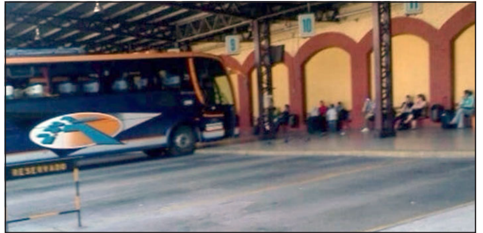
Falso fiscalizador robó un computador desde el interior de un bus 'Ahumada' la tarde de este martes en el terminal.

«Se sube mi amigo al bus, nos colocamos a conversar y la misma persona que supuestamente era fiscalizador, se ofrece a dejarle el computador (al interior de su mochila) en los compartimentos sobre los asientos, lo hace, y seguimos conversando. Todo esto rápido, cerca de 5 a 10 minutos, y pasa entre medio de nosotros, pasaron unos segundos y alguien grita '¿De quién era el computador que estaba arri-