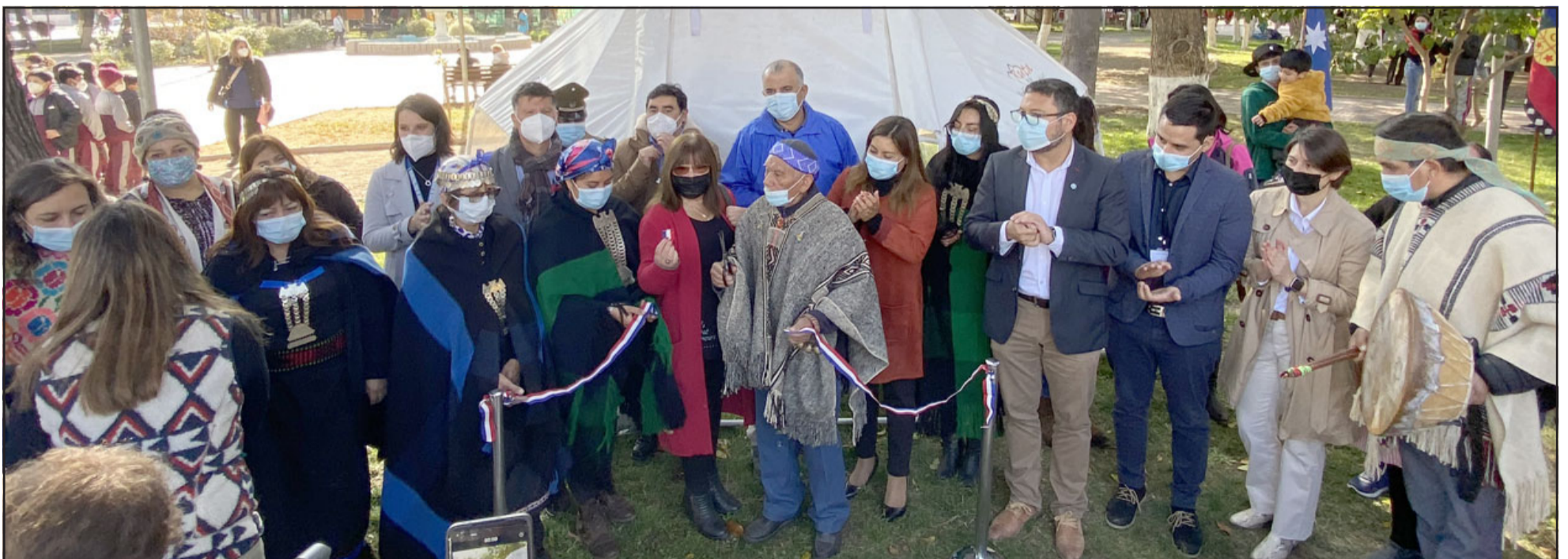
Representantes de agrupaciones Mapuches del Valle de Aconcagua, directores de departamentos y concejales de la comuna de Santa María.