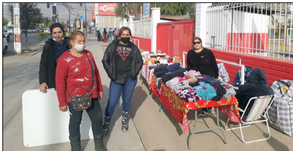
Las mujeres comerciantes ambulantes que se instalaron frente al estadio municipal de Avenida Maipú.

En otro aspecto dice que es una pena para ellos que los traten de delincuentes en las redes sociales. «Pucha yo he leído montones de cosas, también he comentado porque soy ser humano, me molesta, me da rabia, pena, la gente sin conocernos hable de nosotros y tratanos de delincuentes, siendo que somos mamás solteras, esforzadas y aquí andamos dando la lucha, estamos de temprano acá y no anda casi nadie, pero hay que probar hacerle un llamado a la gente que se acerque a comprar nuestras cositas, que vengan a