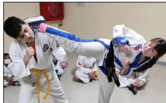
EN VILLA ARGELIA.- Estos pequeñines van poco a poco perdiendo el miedo al combate, las clases se impartirán los miércoles de las 18:30 a las 20:00 horas.