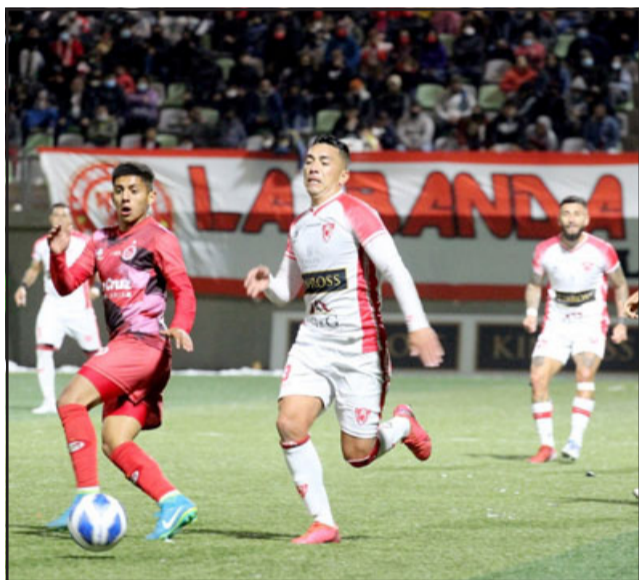
El Uní Uní logró un trabajado triunfo por la mínima sobre Deportes Copiapó.