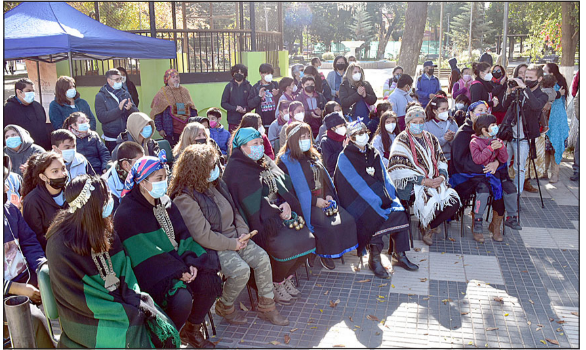
GRAN CONVOCATORIA.- El sábado 21 de mayo, en horas de la mañana y hasta las siete de la tarde se desarrolló esta actividad en la Plaza de Armas de Santa María.

MUY CREATIVAS.- Estos exponentes fabrican jabones, medicinas, artesanías, reciclan productos para darles nuevos usos en casa.