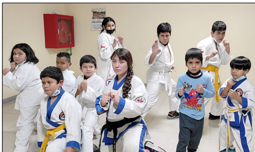
HAY CUPO.- Acá tenemos a la nueva generación de niños karatecas que están recibiendo clases gratuitas en la sede vecinal de Villa Argelia.

pacio para realizar este acto social, las clases se impartirán los miércoles de las 18:30 a las 20:00 horas, los interesados en matricular a sus hijos pueden llamar al +56976515784», comentó don Víctor.