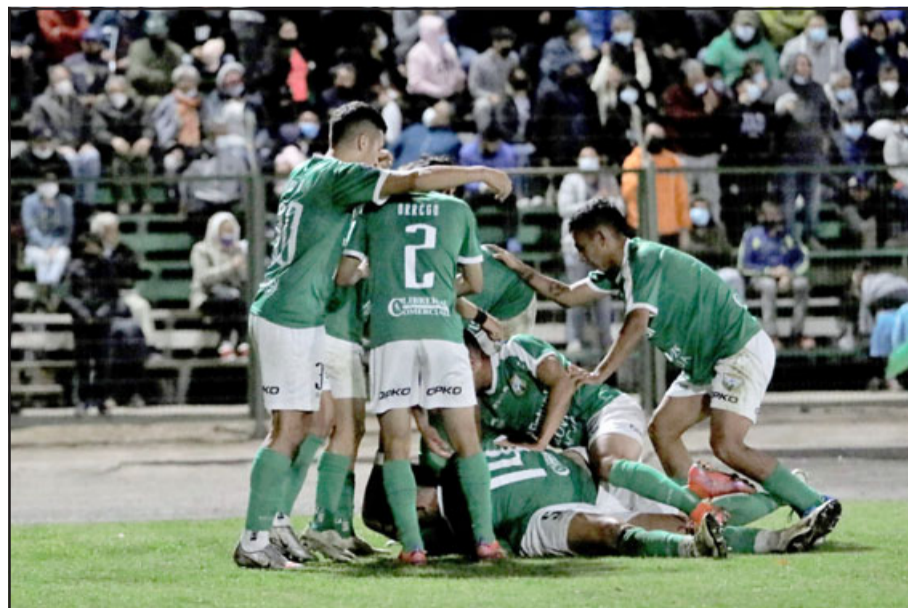
Los andinos deberán hacerse fuertes de local para seguir sumando.

12:00 El Manzano – Independiente Almendral 12:30 New Life – Las Bandurrias 12:30 Santa Laura – La Capilla (Calle Larga) 16:30 Victoria de Morandé – Sara Braun 16:30 Nacional – Brasil (Putando)