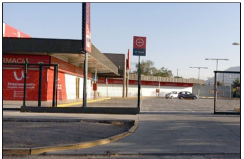
Tres personas detenidas dejó robo y posterior agresión con un arma blanca a un guardia en el supermercado Unimarc de Encón.

El comisario de Carabineros de nuestra ciudad puntualizó que estos sujetos «fueron detenidos con lo robado en las inmediaciones donde se cometió el ilícito y se puso todos los antecedentes a manos del Ministerio Público», destacando «el profesionalismo empleado, fueron varios los carros que llegaron al lugar y el accionar policial que permitió la detención de estas tres