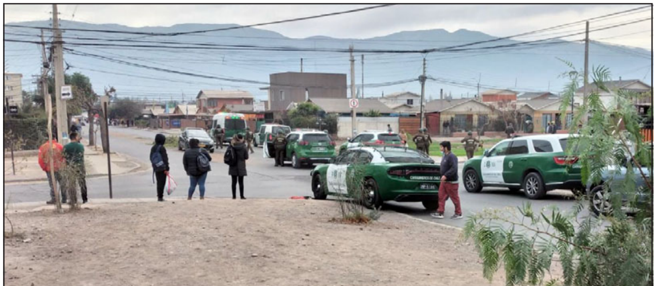
Gran contingente policial este viernes en Santa Teresa, donde un grupo de vecinos avergonzó a todo el sector luego de agredir a Carabineros para proteger a un delincuente que se movilizaba en una motocicleta robada.

«Yo condeno este tipo de actos, es un acto cobarde en el cual se ataca a la institucionalidad de Carabineros, puesto que mi personal es-