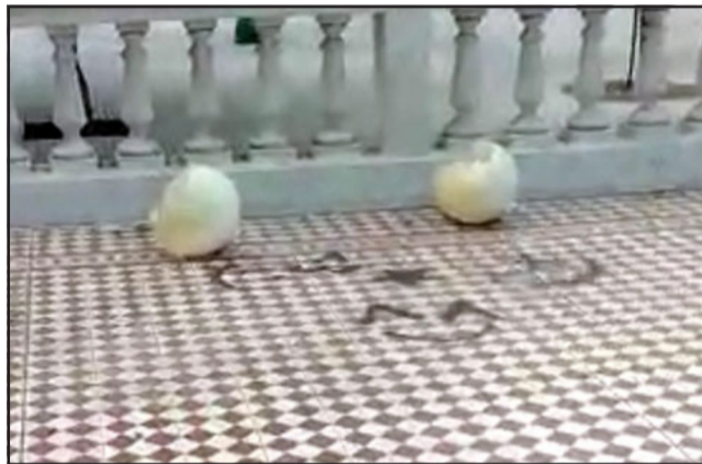
Así lucía la terraza de la Plaza de Armas tras ser vandalizada por desconocidos.

gistro de las cámaras de seguridad, la edil sostuvo que «lo estamos evaluando, todo sirve, así que si alguien tiene algún tipo de información, la sumaremos a la información que ya tenemos».