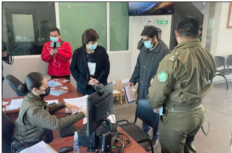
Municipalidad de San Felipe presentó denuncia por graves daños en la terraza de la Plaza de Armas.

Dstrucción de un espacio público de toda la ciudad que además ha generado un gasto millonario para el municipio en cuánto su reparación. «Hay que certificar todos los antecedentes,