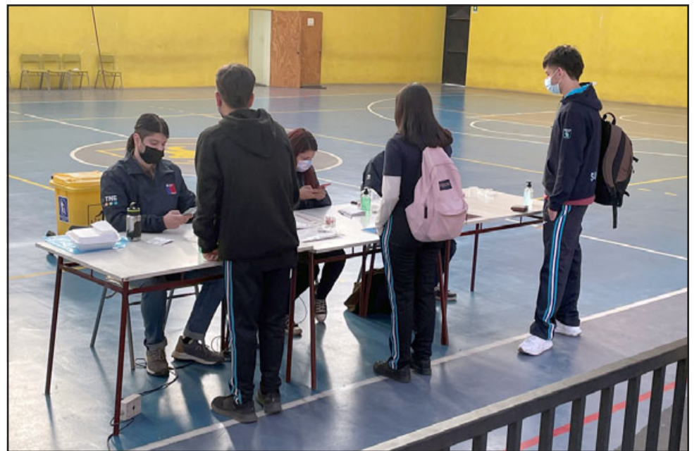
Tal como el pasado miércoles 25 de mayo, la revalidación se debe realizar en el Liceo Corina Urbina (foto), en San Felipe, o en el Liceo América, en Los Andes.

El horario de atención es de 09,00 a 17,00 horas en ambos módulos dispuestos, tanto en San Felipe hoy martes 31 de mayo, así como también mañana miércoles 1 de junio en Los Andes.