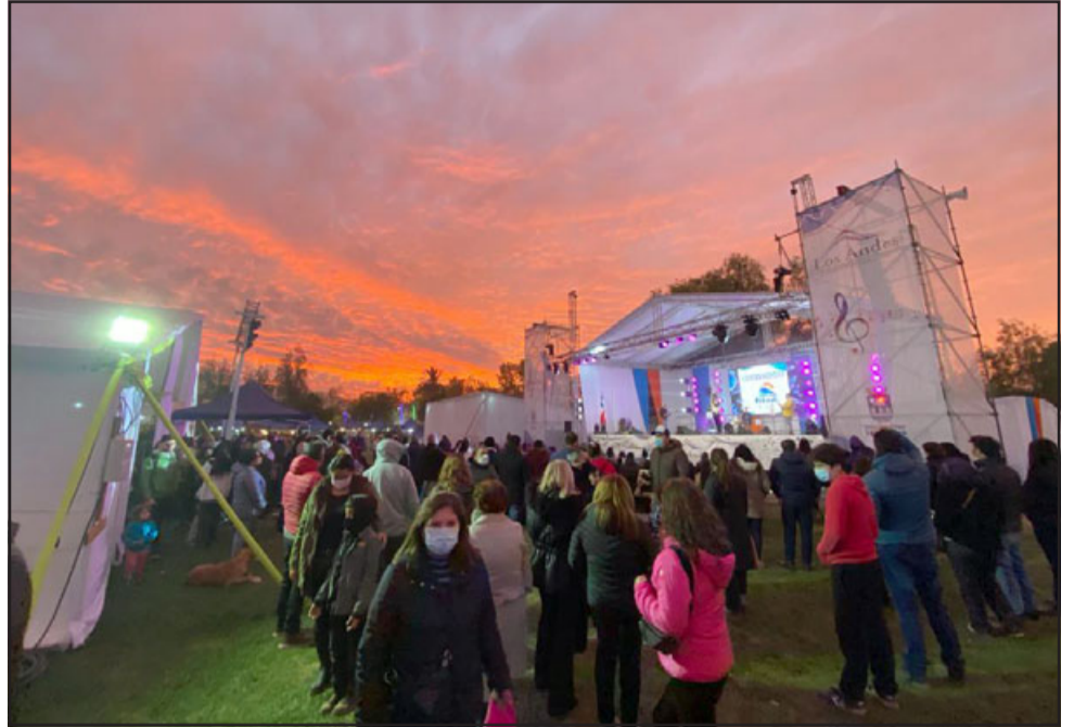
La 44ª Filan tuvo un récord de asistencia con 44.151 visitantes, dato que se obtuvo gracias a la cuantificación que se hizo por primera vez en la actividad.