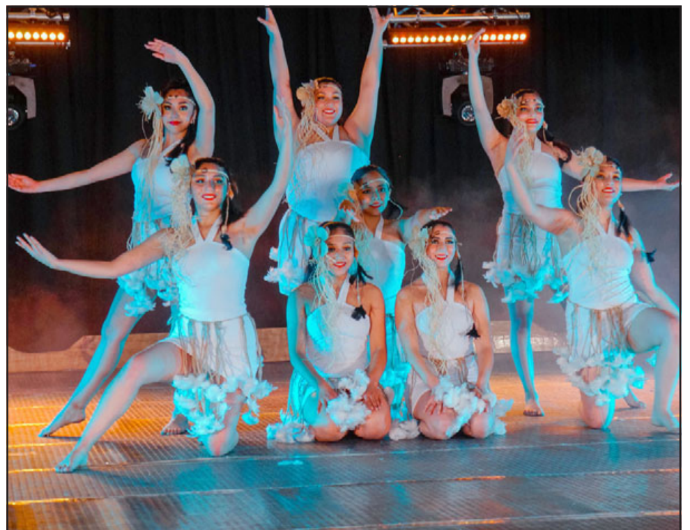
CALIDAD INTERNACIONAL.- El dominio escénico de estas jóvenes bailarinas deja muy en alto el nombre de Chile y Putaendo.