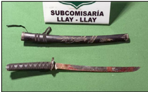
Esta es la katana con que agredió a la mujer.

Impactante y brutal caso de violencia intrafamiliar