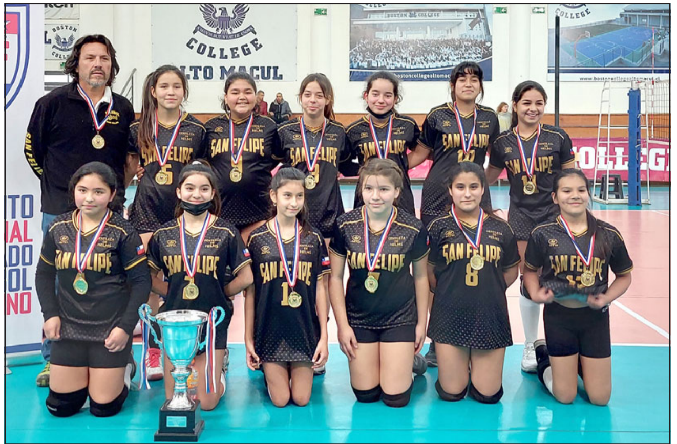
GARRA DE CAMPEONAS.- Ellas son lideresas a nivel país del Circuito Nacional Federado de Vóleybol U12 femenino.

- Se jugaron siete partidos, ganamos en el Clasificatorio, perdimos uno muy ajustadamente, justamente contra el Boston College, que era el local. Clasificamos a la final contra el Bos-