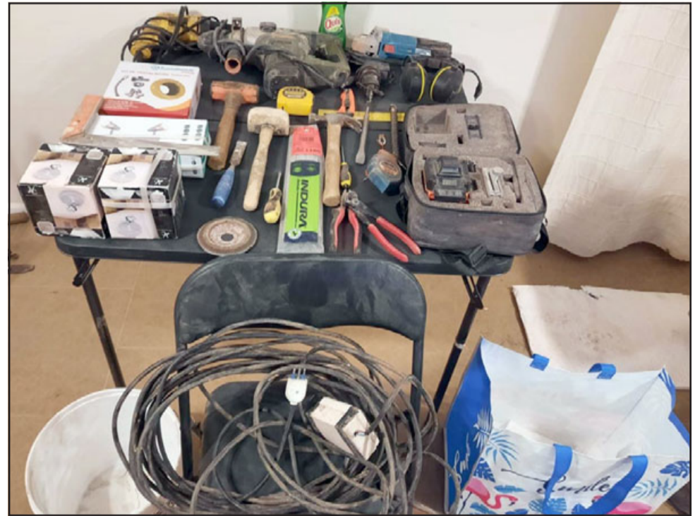
Estas son las especies que recuperó Carabineros.

que fue a través de un llamado telefónico que «se recibió información respecto a la comisión de un ilícito de delito de robo en lugar habitado que estaría afectando a un vecino, específicamente un domicilio particular emplazado en la calle Juan Fuentes Gallardo de acá de la comuna, y rápidamente personal de Carabineros se constituye, y conforme a las características proporcionadas por las víctimas, de la persona que había ejecutado el delito, procede a efectuar la vigilancia y los patrullajes correspondientes y divisa a esta persona. Específicamente lo que habían visto era una persona que portaba un tarro y una bolsa también en la cual transportaba las especies sustraídas, quien al ver la presencia de Carabineros rápidamente se da a la fuga de infantería, deja las cosas botadas en el piso y empieza a eludir