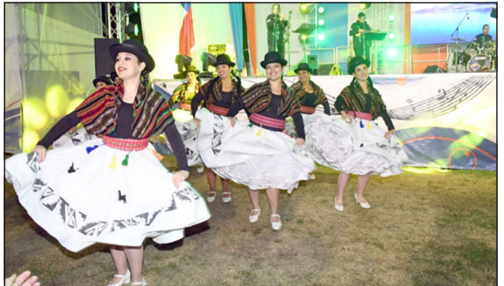
Presentaciones musicales de 11 grupos o artistas, principalmente locales, bailes, muestras, de los más destacados ballets y bailarines de la comuna.