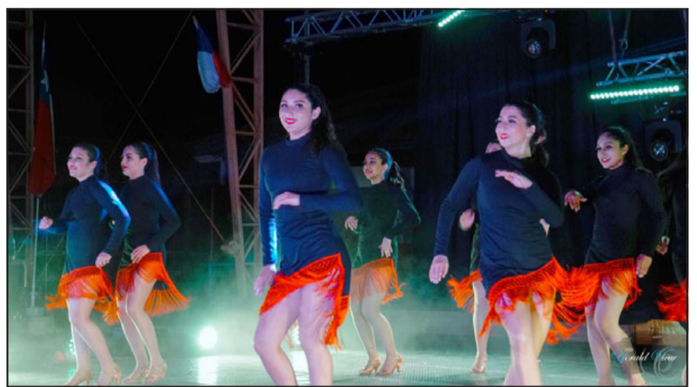
SIN FRONTERAS.- El Folklore latinoamericano es el fuerte de esta academia aconcaguina, se han presentado dentro y fuera de Chile.

Teatro Lavalleja, Parque Rodó, Colegio San José, Plaza Independencia, Uruguay. Roberto González Short