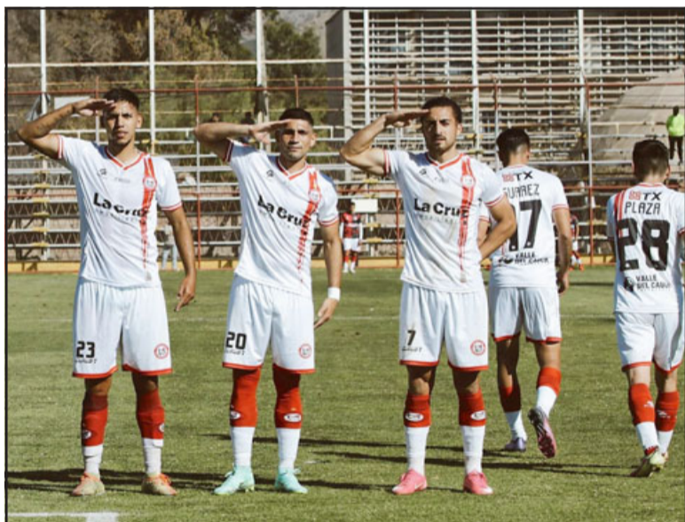
Tres puntos que pueden valer oro son los que esta tarde intentará apropiarse Unión San Felipe.