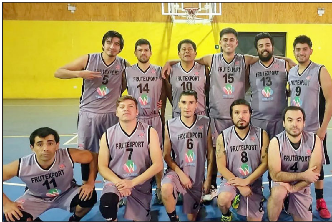
Frutexport y el Sonics protagonizaron el que quizás fue el partido más emotivo de la fase regular de la ABAR.