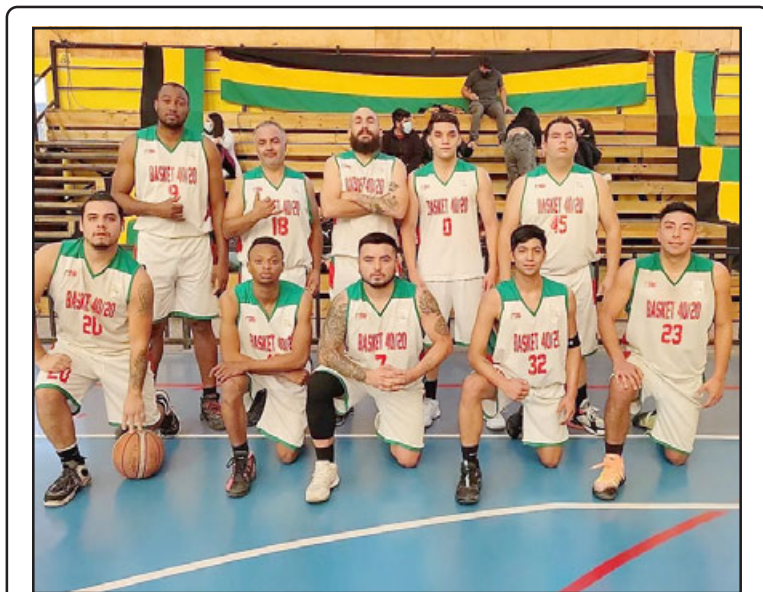
Le Bajon llega como favorito al cuadrangular final del ascenso de la Asociación de Básquetbol Alejandro Rivadeneira.