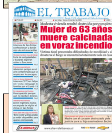
Nuestra última edición en papel.

COMERCiantes EN LA LUCHA.- Pasadas las 11:00 de la mañana de este jueves, un grupo de al menos una docena de comerciantes ambulantes de San Felipe se manifestaron pacíficamente en el frontis de la municipalidad de nuestra ciudad, pidiendo soluciones y derechamente poder volver a trabajar en las calles del centro. Finalmente los comerciantes indicaron que «había muchos comerciantes que llegaban de otra ciudad y nadie los fiscalizaba, no había inspectores, antes andaban con Carabineros revisando si se pagaban los permisos y ahora nada, ellos dejaron que llegara gente de todos lados».