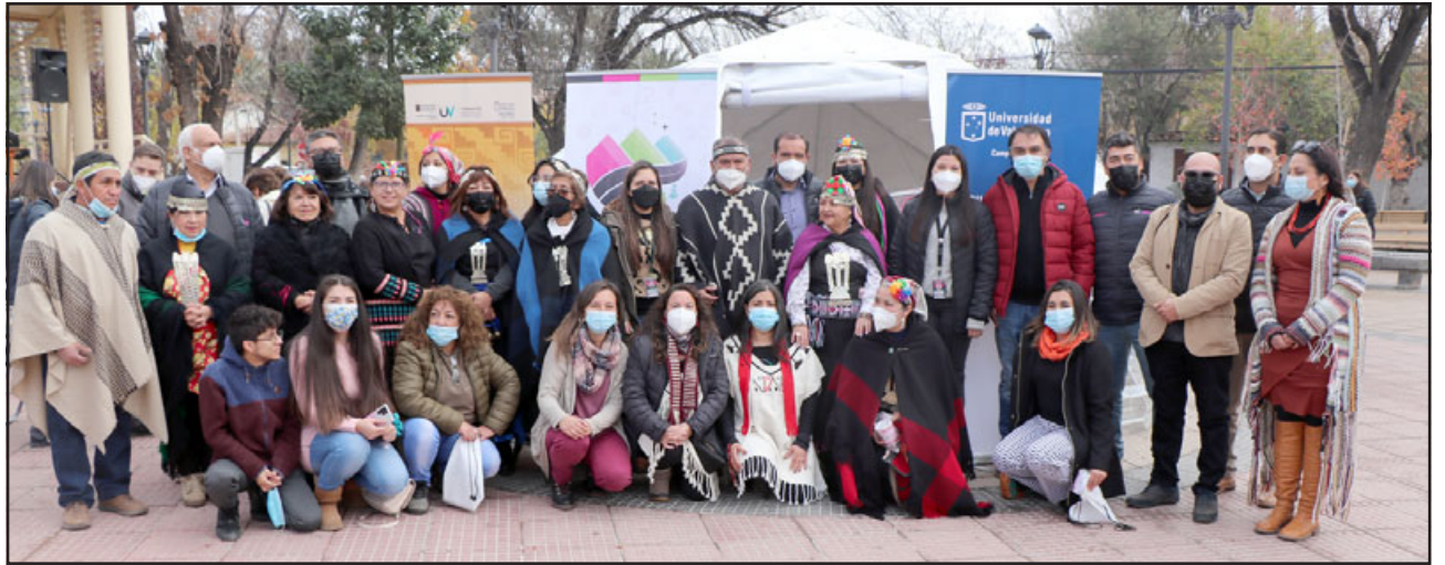
La 'Ruta de la Medicina Ancestral' estará presente en la Plaza de Calle Larga hasta mañana sábado 4 de junio

En la Plaza de Calle Larga finaliza su recorrido por el Valle de Aconcagua la 'Ruta de la Medicina Ancestral', iniciativa desarrollada por la Escuela de Medicina UV y las asociaciones indígenas de Aconcagua y que contempla la muestra y comercialización de productos de medicina ancestral, hierbas medicinales, tejidos a telar, joyería mapuche, así como la instalación de un domo en el que se realizan actividades complementarias como charlas de cosmovisión, salud y buen vivir y talleres de