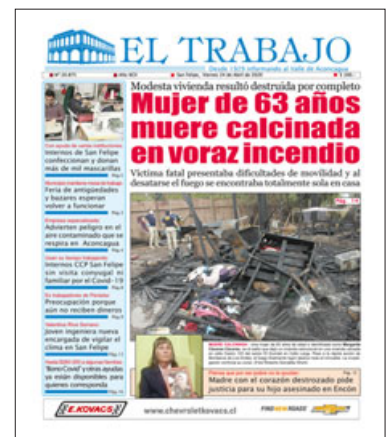
Nuestra última edición en papel.