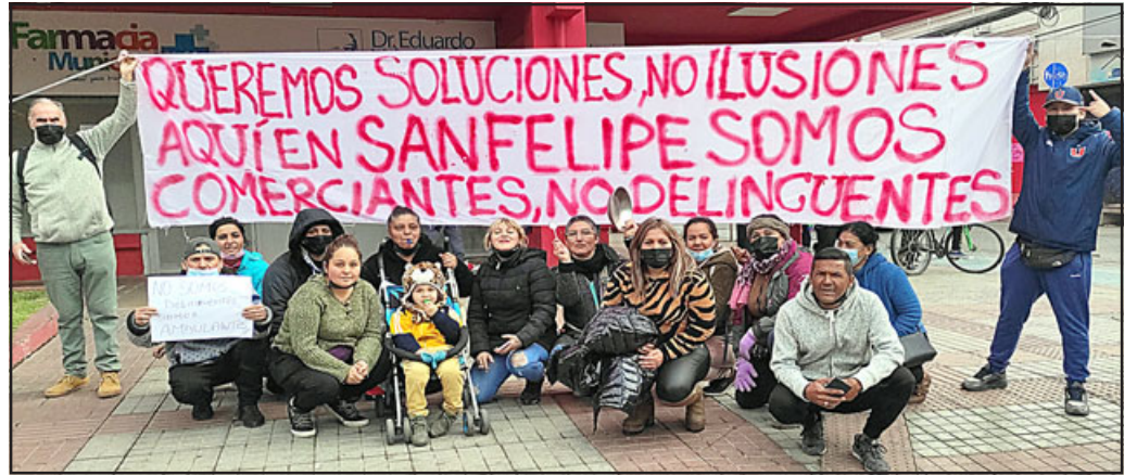
Poco más de una docena de comerciantes ambulantes llegaron hasta el centro esta vez no a trabajar, si no a protestar frente al municipio.

Respecto de la intención por formalizar sus trabajos, precisaron que «queremos formalizarnos, pero no tenemos la ayuda de nadie, nadie nos ha llamado para formar una mesa de diálogo con esas propuestas, no. Tenemos intención de