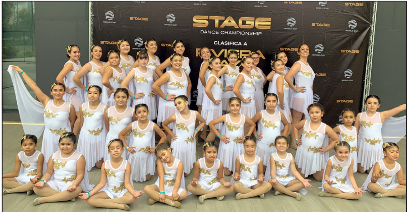
DELEGACIÓN DORADA. - Aquí tenemos a las bailarinas aconcagüinas dejando muy en alto el nombre de San Felipe en el Stage Dance Championship, que se desarrolló en Santiago en el Centro de Eventos Hilaria en Huechuraba, Santiago.