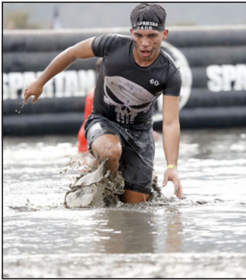
Una de las pruebas más duras fue tener que pasar por el agua.