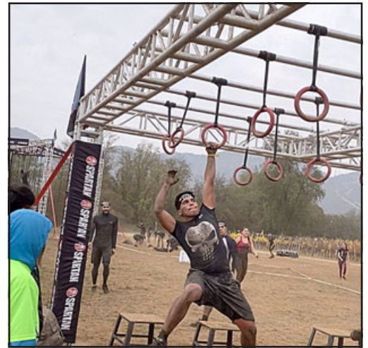
Acá pasando por las argollas que requiere un gran esfuerzo físico.

Al finalizar agradeció a todas las personas que lo han apoyado, especialmente a sus padres.