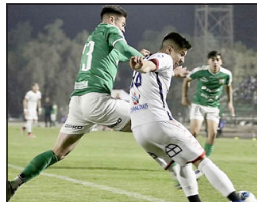
El equipo de Los Andes ha experimentado un alza en su rendimiento.