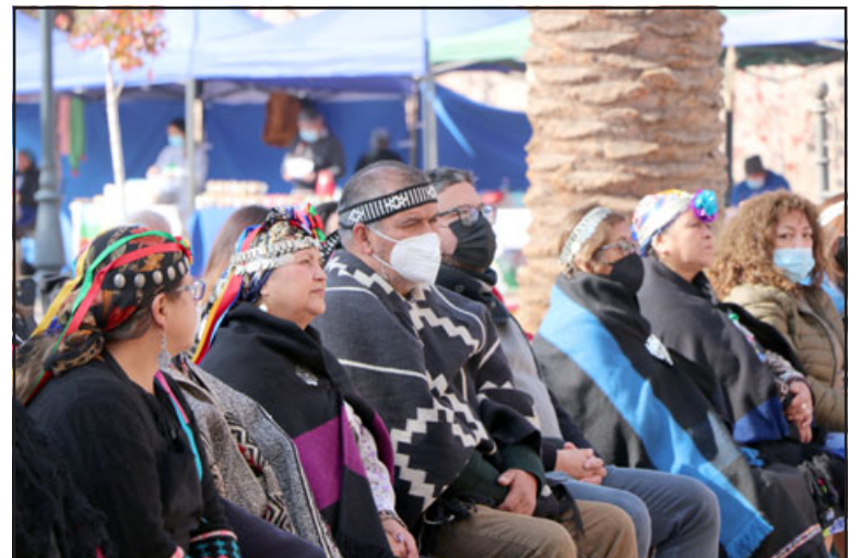
La actividad busca visibilizar acciones realizadas por un grupo de mujeres facilitadoras de la medicina ancestral, reconociendo los distintos saberes, cosmovisión, costumbres e historias socio geográficas que determinan las formas de entender y cuidar la salud.