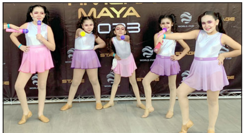
SON LAS MEJORES. - Estas pequeñitas también regresaron con sus medallas y una gran sonrisa, ya se preparan para México2023.