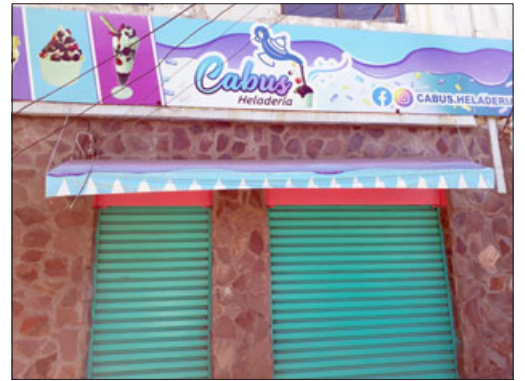
Esta es la heladería donde una vez más atacó el delincuente del tatuaje de garra, quien solo en el mes de mayo ha cometido más de diez robos similares a éste.

- Sí, es horrible de hecho llegar, ver el local hecho tira porque aparte como rompieron la pared, tuvimos que ir... plata que no teníamos, conseguí, ir a comprar más fierros, pagarle a un soldador para que fuera ese mismo día sábado a soldar, reforzar con fierros, madera gruesa para poder recubrir, gasté casi 200 mil pesos ese día sábado de plata prestada porque me dejaron sin nada, y para más remate tuve que arreglar