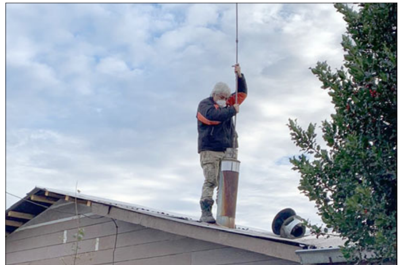
No es necesario contratar a personal especializado, ya que cualquiera puede realizar esta labor al comprar los kit de limpieza que venden en el comercio.