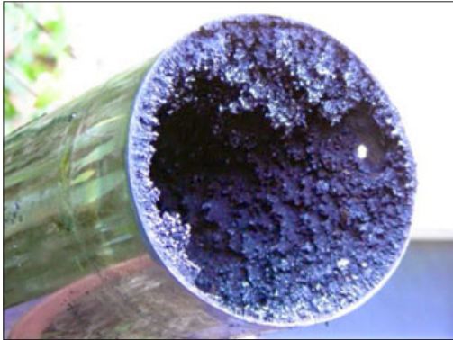
Así luce el ducto de una estufa a leña que no ha recibido mantención. El material que se acumula con los años termina por inflamarse provocando el siniestro.

ciones, sobre todo en las estufas que queman mechas porque se deben realizar cambios a las mechas, porque si no se realizan, liberan muchos gases, y los gases de la combustión al interior del hogar pueden producir intoxicaciones. Por eso es que se recomienda cambiar la mecha una vez al año, así como también vaciar el combustible que queda de un año para otro al interior de la estufa», cerró el bombero.