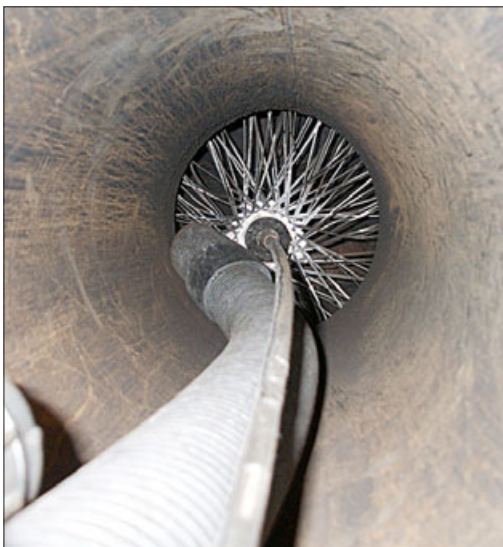
Mantener los ductos limpios es clave para disfrutar del calor de las estufas a leña sin sufrir la destrucción de la vivienda.