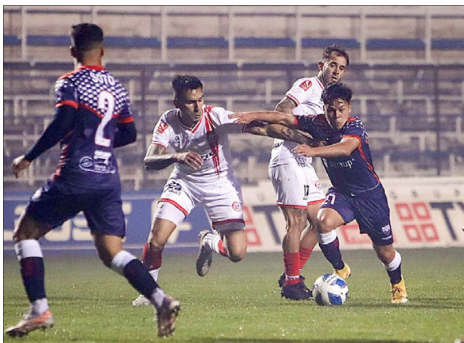
En una actuación muy deficiente el Uní Uní debió conformarse con un pálido empate en blanco frente a Recoleta.