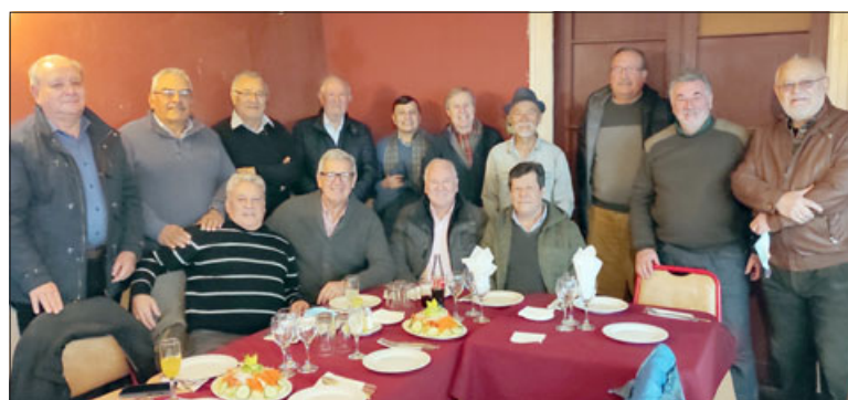
TODOS JUBILADOS.- Las cámaras de Diario El Trabajo registraron el cálido momento de este encuentro de egresados 1970 del Liceo de Hombres.

- Ya pudimos juntarnos alrededor de 22 alumnos con los cuales compartimos vivencias y nos acordamos de nuestros compañeros que ya no están con nosotros. Nos acordamos de nuestros profesores, de nuestras anécdotas, tuvimos conversaciones, nos entregamos un Diploma de Honor donde se indica claramente que cada uno de nosotros se lleva el diploma con los 52 años de haber egresado, tuvimos una torta de cumpleaños también por los 52 años, la cosa es que en esta oportunidad ya en 2022 nos hemos juntado en dos veces ya y lo que nosotros vamos a seguir