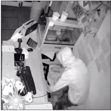
¿Hasta cuándo seguirá libre?