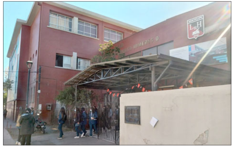
EL LICEO.- Son 184 años de trayectoria los que cumplió el Liceo Dr. Roberto Humeres Oyaneder de San Felipe.

Y es que además en dicha ceremonia, se pudo apreciar la inclusión en el colegio, ya que el cuadro artístico, de baile propiamente tal, estuvo encabezado por estudiantes extranjeros. « Ellos tienen la gracia, ellos eran todos