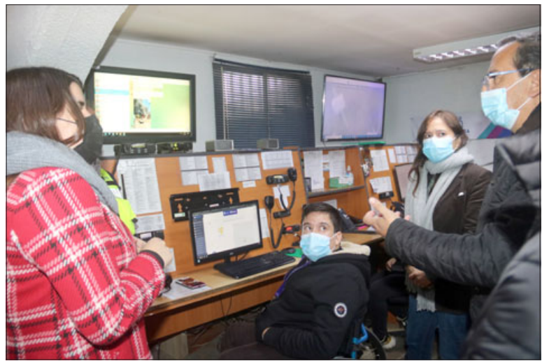
Parte del recorrido por las dependencias de la Municipalidad de Quilicura, fue conocer la central de cámaras de televigilancia y de consultas de un número telefónico propio que tiene dicha comuna de la capital para recibir denuncias sobre emergencias.

«Estamos muy contentos que puedan venir a conocer la experiencia que estamos llevando adelante y, también, no podemos ser ilusos, necesitamos de las instituciones, necesitamos del Gobierno Central para que todos nuestros dispositivos comunales sean efectivos», precisó la alcaldesa.