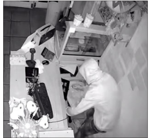
El delincuente del tatuaje vacía la caja de la heladería Cabus. Pese a su historial delincuencia la justicia continúa dejándolo en libertad cada vez que es detenido.