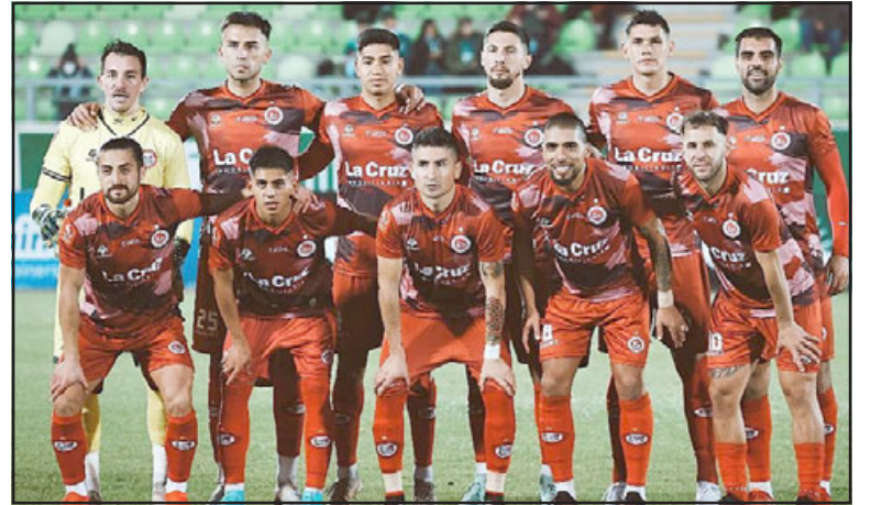
Mañana el Uní Uní jugará su primer encuentro por la fase 3 de la Copa Chile frente a la UC.