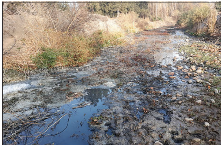
Como una verdadera cloaca luce el que fuera un precioso estero en el sector Chorrillos de Santa María.

- No tengo idea de qué es la espuma, pero siempre ha habido espuma ahí en la salida, así es que no tengo idea, no soy experto en el cuento, pero siempre ha salido espuma. Y usted ve el estero el color que tiene, el agua es un agua negra, es bastante insoportable a ratos el olor, o sea no se soporta en la noche. En la noche