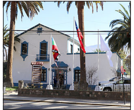
Desde la Municipalidad de Panquehue, el asesor jurídico aseguró categóricamente que dicha Corporación no ha incurrido en la ilegalidad, pues cuando se cumple con los antecedentes legales para solicitar una patente, ésta no se puede negar.

Del mismo modo Castañeda recalcó que la acción judicial con la indemnización señala-