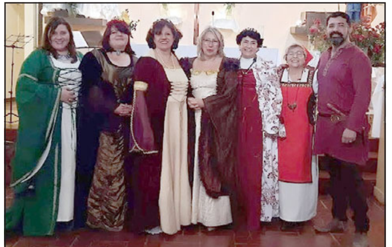
SIEMPRE CAMERATA.- Así como se han lucido dentro y fuera de Chile, una vez más Camerata deleitará a los presentes hoy viernes en la Catedral.

acústica maravillosa, realizando los cantos. Este será el primero de una serie de conciertos que se darán en distintos lugares del Valle, próximamente contaremos más detalles al respecto», Gaete.