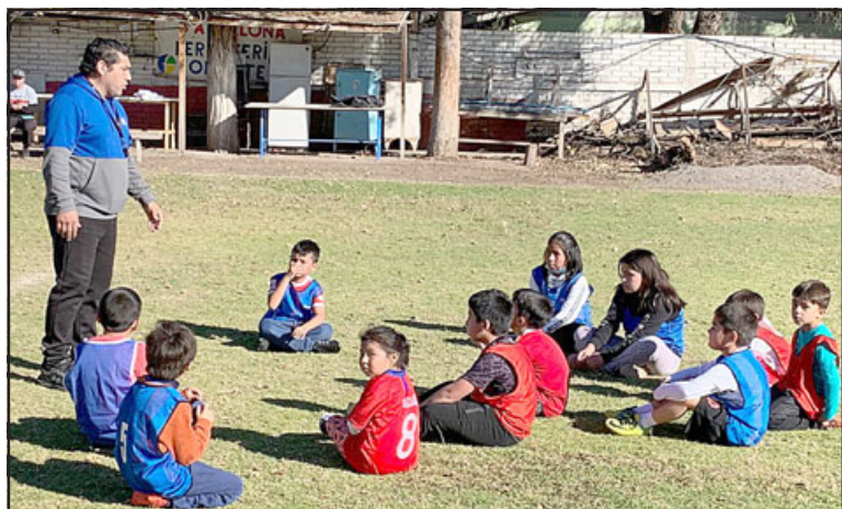
Uno de los monitores entregando indicaciones a niñas y niños.

- Desde la nueve de la mañana a una de la tarde el día sábado. Al finalizar reitero que por mientras se encuentran trabajando en la cancha de la Parrasía, pero después lo harán en el estadio municipal.