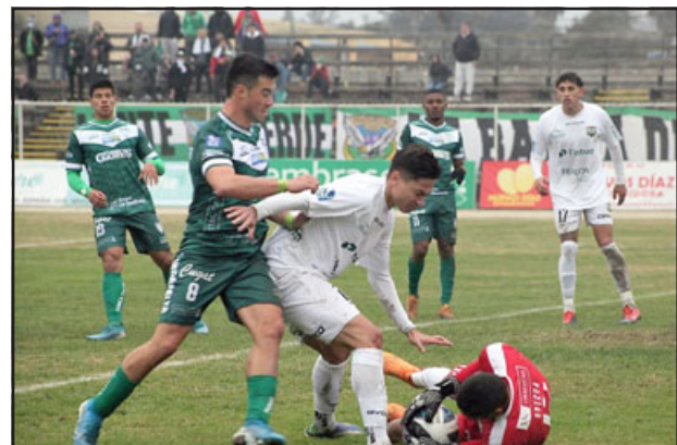
El equipo de Los Andes está obligado a ganar para seguir con opciones de luchar por el ascenso.

Deportes Concepción El resto de la fecha se jugará posteriormen-