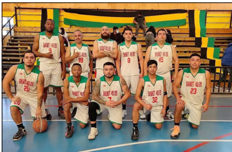
Le Bajan corre con favoritismo para ganar el cuadrangular final de la serie B de la ABAR.