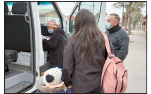
La iniciativa beneficia a más de 270 menores de 11 jardines infantiles de las provincias de San Felipe y Los Andes que viven en sectores alejados o con problemas de conectividad, facilitando su acceso a la educación parvularia.

En sus modalidades de Transporte Escolar y Servicio de Acercamiento a Familias, el programa considera una inversión anual regional cercana a los $200 millones este 2022 para la operatividad de los servicios de transporte contratados en toda la región, cuya selección fue ejecutada en un riguroso proceso, con el fin de garantizar la idoneidad, tanto del personal a cargo, como de los vehículos y de cada una de las