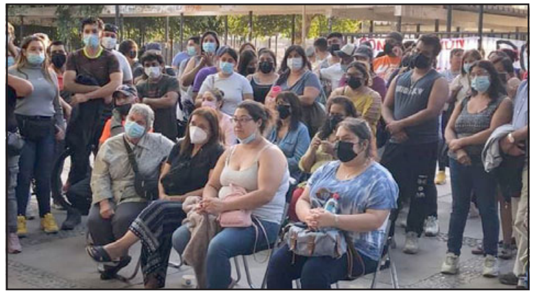
LUCHAN POR UN TECHO DIGNO.- Cientos de familias sanfelipeñas conforman el Comité de Vivienda LGTB Aconcagua. Los interesados en conocer más de este Comité de Vivienda, pueden llamar al +56 953201081.