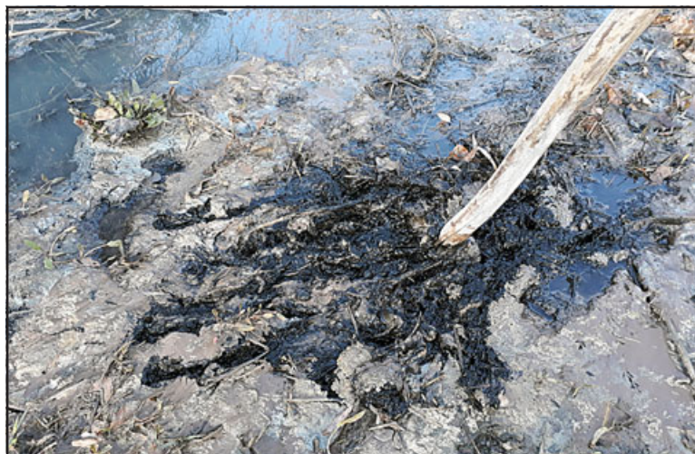
Esta es la espuma y el agua negra que el vecino ignora de qué se trata, aunque a simple vista parecieran ser lodos de aguas servidas que están siendo lanzados o cayendo accidentalmente al estero.

Los lodos están formados por sustancias contaminantes y peligrosas para la salud, por ese motivo los lodos deben ser tratados. Los lodos extraídos de los procesos de tratamiento de las aguas residuales domésticas e industriales tienen un contenido en sólido que varía entre el 0.25 y el 12% de su peso. Los lodos separados de las aguas residuales, deben ser estabilizados, espesados y desinfectados, antes de llevarlos a su disposición final.