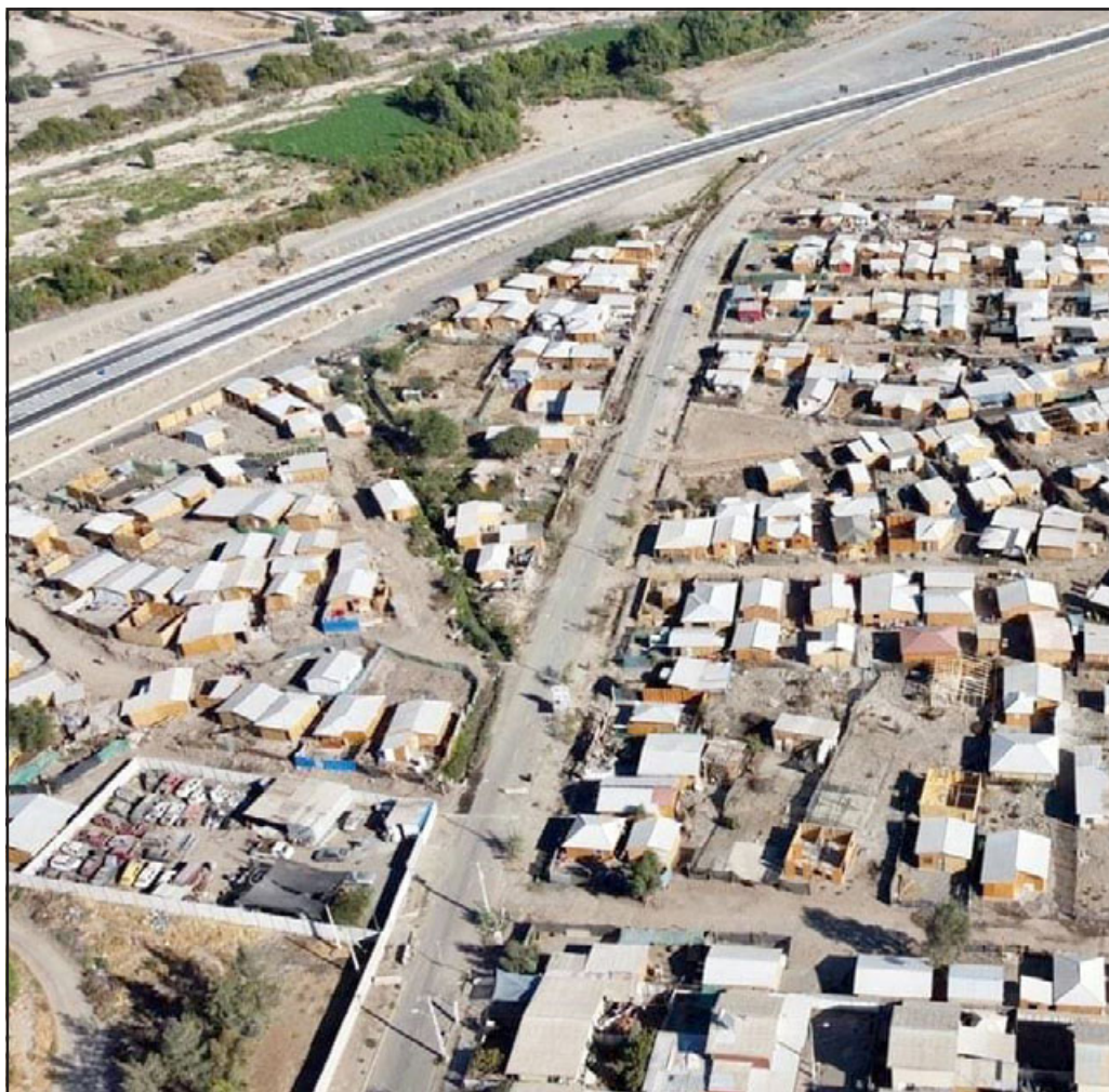
Una vista panorámica de la toma en el sector poniente de San Felipe.

Al finalizar siguió insistiendo que acá hay una falta de servicio por parte del Estado chileno cuando esta toma se estaba iniciando.