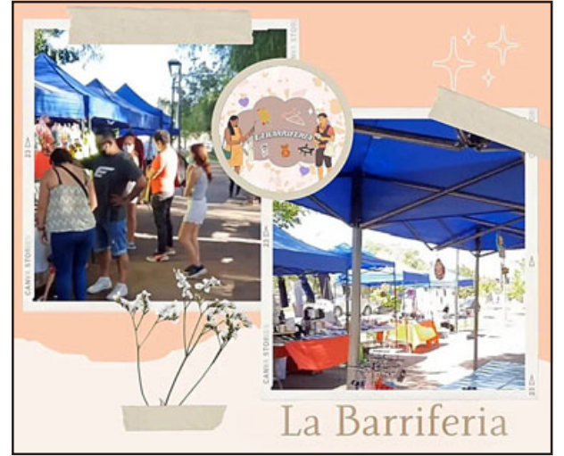
El logo de Barriferia que se instala los días sábado frente al terminal de buses en la Avenida Yungay desde las 10 de la mañana hasta las 6 y media de la tarde.

- ¿Han podido o logrado hablar con la alcaldesa