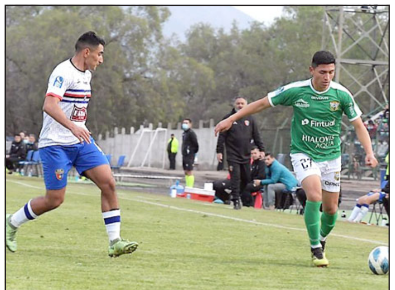
En el Regional de Los Andes Trasandino superó con comodidad al Real San Joaquín.

Este triunfo cobró mucha relevancia para el conjunto aconagüino, ya que alcanzó los 16 puntos, con lo que se mete de lleno (está a 6 del puntero San Marcos) en el grupo estelar de la competencia de bronce del balompié nacional, cosa que hace pocas fechas atrás parecía un objetivo imposible de alcanzar.