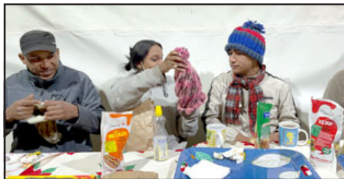
Gorros, guantes, calcetas, todo tejido en lana por adultos mayores.

Para hacer entrega de los cerca de 200 productos confeccionados, integrantes del Programa Más llegaron hasta el albergue municipal ubicado en calle Salvador Allende, para ofrecer una rica once a sus usuarios