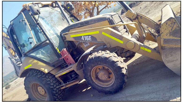
Esta es la retroexcavadora de donde robaron las llaves avaluadas en unos 300 mil pesos.

- No, no se hizo denuncia porque ya hicimos la del auto la otra vez, mi vecina del frente la hizo cuando le robaron la bicicleta y todo