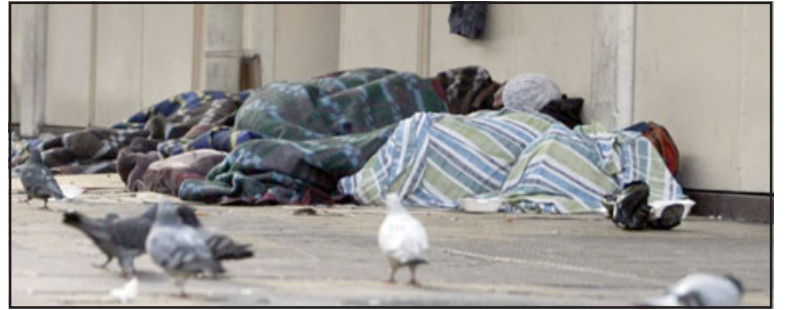
RESISTAN TATITAS.- El próximo viernes se estaría abriendo el albergue municipal para 25 personas, muy por debajo de centenar que vive actualmente en situación de calle. (Foto referencial)

Una vez que el Ministerio de Desarrollo Social entregue los recursos, el albergue municipal extenderá su