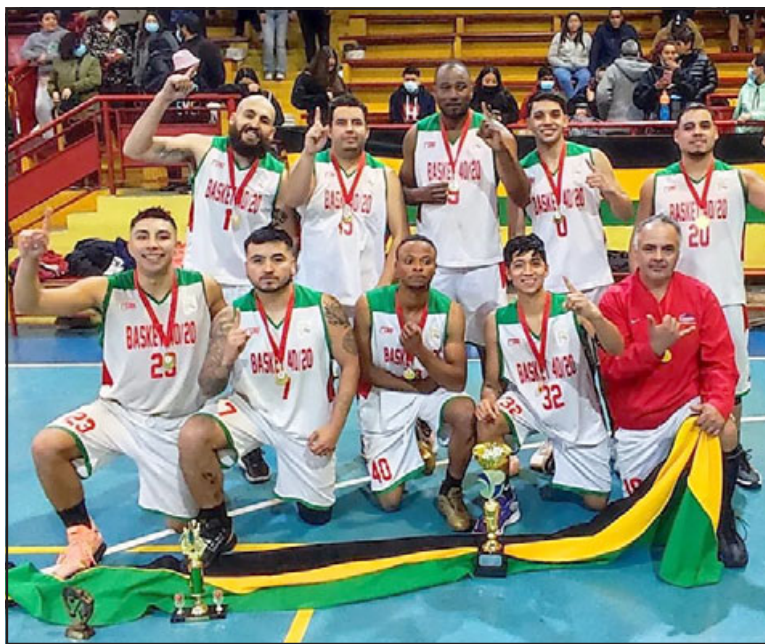
Le Bajan ganó de manera invicta el torneo de Apertura de la serie B de la ABAR.