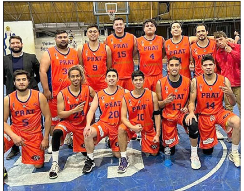
Una campaña perfecta está cumpliendo el club Arturo Prat en la Liga Centro Norte.

tativo en su primera experiencia en la Liga Centro Norte, a la cual llegaron casi de emergencia y con el gran objetivo de mantener a su cuadro de honor en una competencia de exigencia mayor, que les permita mantener en este periodo de transición un ritmo e intensidad alta para cuando les corresponda volver a la serie B de la Liga Nacional de Básquetbol.