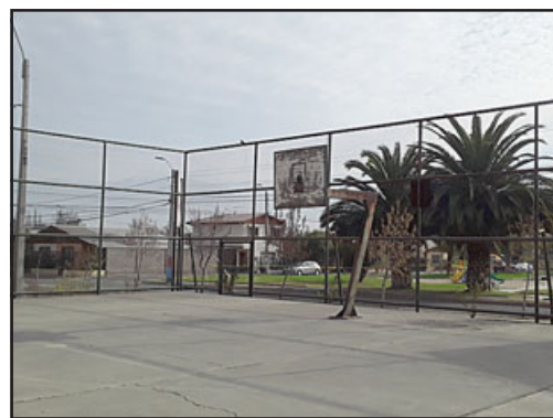
El aro en mal estado de la multi-cancha de Villa El Señorial.

tiempo hemos venido publicando notas respecto al mal estado en que se encuentra la multicancha de Villa El Señorial, un sector residencial muy importante en nuestra ciudad que abarca un número significativo de viviendas.