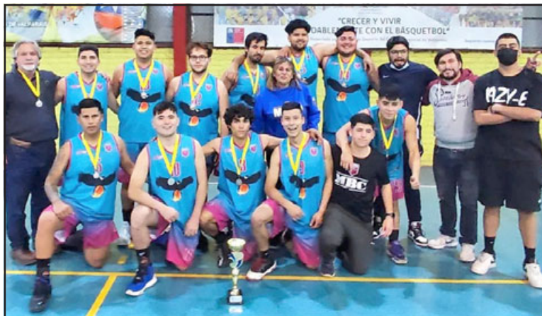
MBC fue un digno finalista del torneo B de la ABAR.