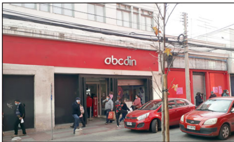
Tienda Abcdin de donde robaron celulares la madrugada de este lunes.