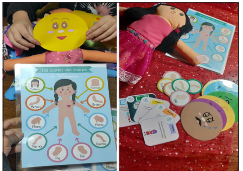
ATENTOS PAPITOS. - Aquí vemos las piezas complementarias de estos juguetes, este sistema lo está instalando Bárbara Caballero Veas, de 28 años de edad, psicopedagoga.