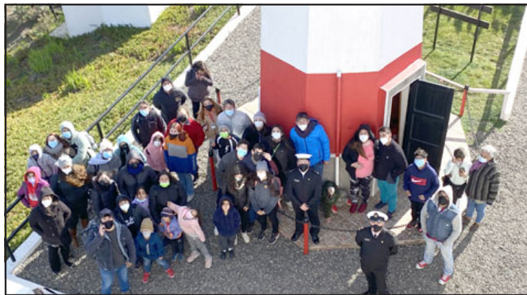
Los 15 estudiantes pudieron conocer distintos atractivos turísticos del puerto, tales como el Faro Punta Panul (en la foto), el Paseo Bellamar y el Museo de Ciencias Naturales e Históricas de San Antonio (MUSA).

«En esta oportunidad, asistimos apodados, personal del equipo planificación-