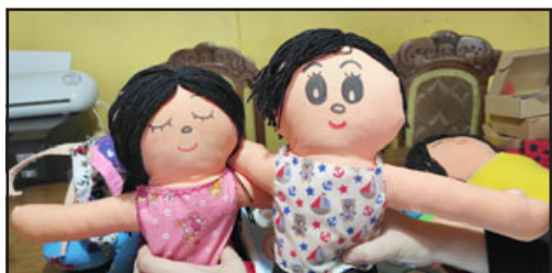
LOS PERSONAJES. - Primavera y Copito son inseparables, ojala este proyecto sea de ayuda a personas con TEA.