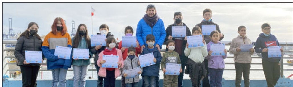
El grupo de estudiantes de San Esteban, ganadores del Concurso Pictórico 'Mes del Mar y las Glorias Navales' desarrollado por el municipio, viajó hasta la ciudad de San Antonio.

Siguiendo esa línea, el profesional del DAEM señaló futuras actividades que se desarrollarán en la comuna, expresando «dentro de lo que se nos viene pronto es el festival de los pueblos originarios, y también el concurso en el marco del día de los bomberos, en donde esperamos contar con la participación de los niños en estas actividades extra programáticas importantes para el desarrollo cultural de los alumnos de nuestra comuna».