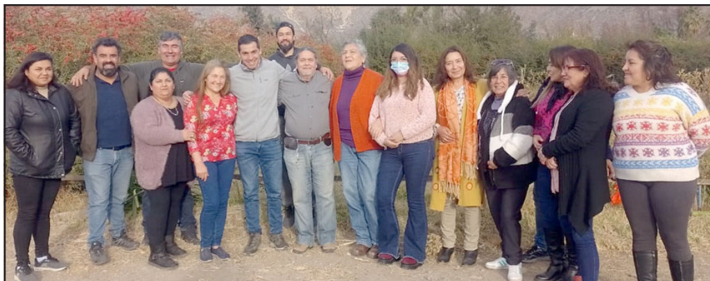
Miembros de Artepan, organización constituida por 21 artesanos productores, junto al alcalde de Panquehue.

Artepan es una organización que agrupa a la fecha a 21 artesanos productores y que desarrollan sus trabajos en cuero, tejido, piedra, madera, bisutería orgánica, entre otros rubros.