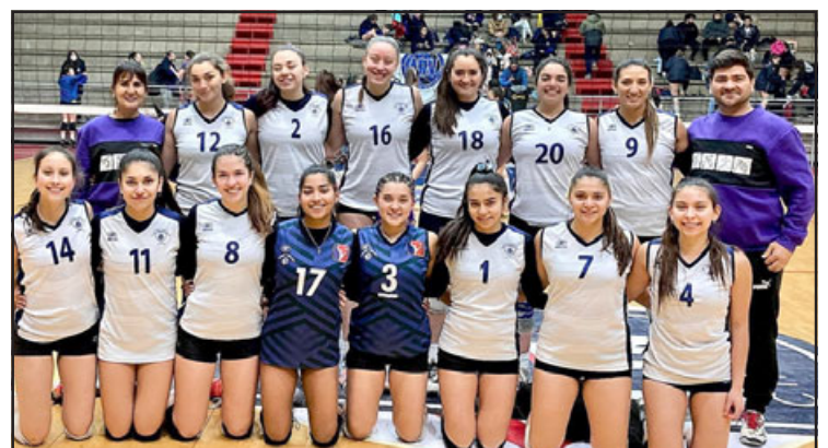
Al ganar el Súper 4 el conjunto femenino del Unión Volley podrá volver a jugar en la serie mayor del voleibol femenino chileno.

conjunto sanfelipeño que es adiestrado técnicamente por Mirko Bonacic – Doric, será el único de la Quinta región y el valle de Aconcagua que tendrá la posibilidad de jugar la Liga A-1, 2022, cerrando con ello un semestre cargado de triunfos y satisfacciones en todas sus series, logrando también la anhelada consolidación de un ambicioso proyecto deportivo de alcances mayores en la 'Tres Veces Heroica Ciudad'.