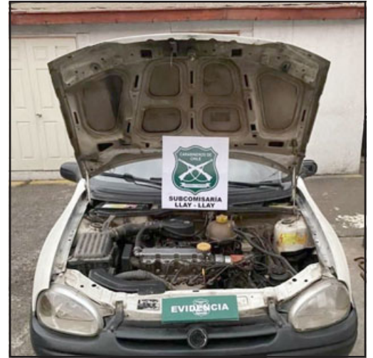
Este es el automóvil que registraba encargo por robo desde la región Metropolitana.

- Sí, nosotros constantemente, Carabineros tanto de la subcomisaría como de Carretera que tenemos en la Ruta 5 Norte, como los territoriales de la subcomisaría de Llay Llay, mantenemos un control permanente tanto en la ruta como en las calles internas de la comuna de Llay Llay. Hemos