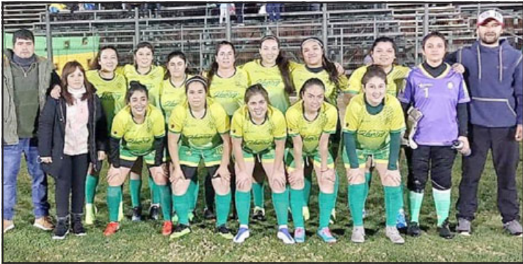
El Central de Putaendo ya se encuentra dentro del Top 4 del balompié femenino de la región.