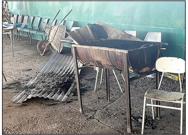
DESCARO TOTAL. - Los malandros hasta hicieron un fuego para hacerle frente al frío.

Eduardo Gallardo contó que este es el quinto robo que sufren en su cancha ubicada en el Complejo ANFA: «Ya se han robado hasta las mallas del perímetro, con decir que se han llevado mallas metálicas completas, por eso algo se debe hacer