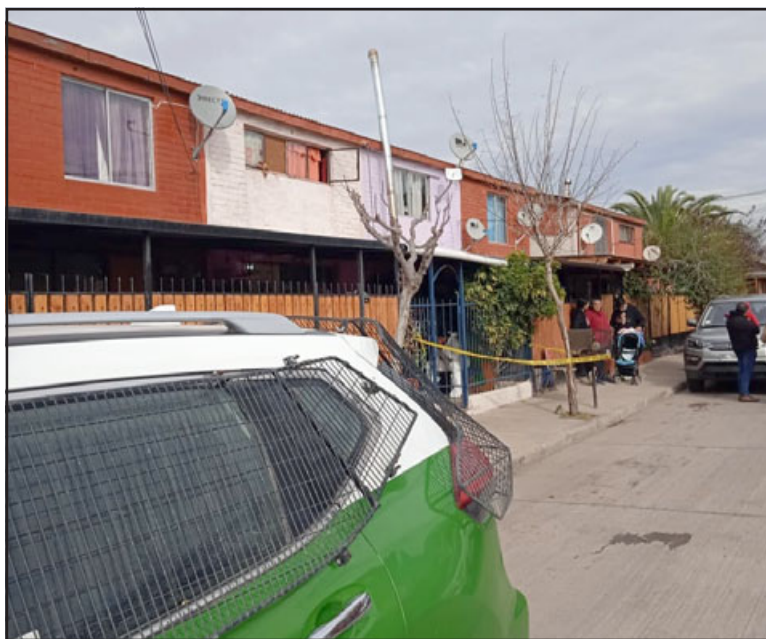
Carabineros en el sitio del suceso, al cual fueron los primeros en llegar después de recibir el llamado a través de la central de comunicaciones.

luego de la investigación se va a lograr acreditar si es que fue femicidio o un homicidio», dice.