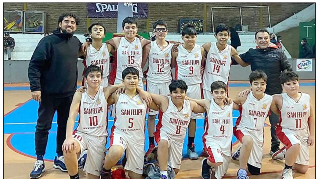
Los U13 es uno de los team de San Felipe Basket que competirá en Concepción.

San Felipe Basket quedó sembrado en el grupo B, junto a Hua-