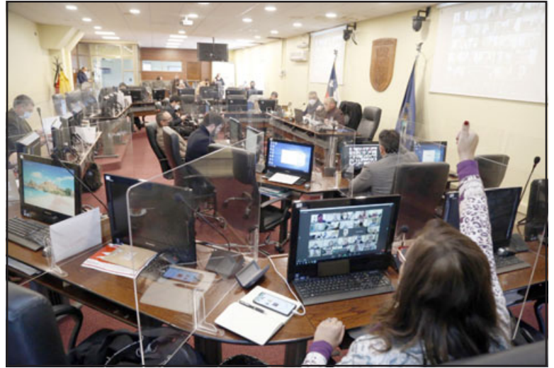
En total fueron 632 millones de pesos aprobados por el pleno del CORE para financiar ocho proyectos presentados por la provincia de San Felipe.

Por otra parte, de acuerdo con lo solici-