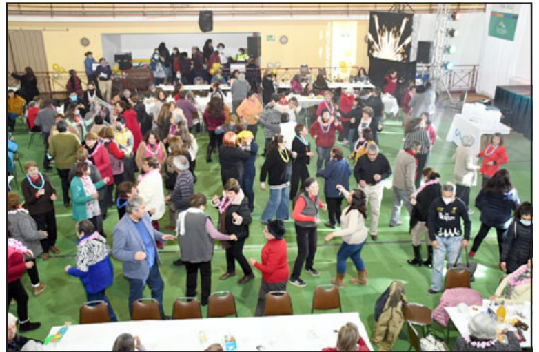
DOS MALONES.- En total fueron más de mil personas las que asistieron a los dos malones de las personas mayores que organizó la Municipalidad de Los Andes.

Esta actividad se dividió en dos días por tema de resguardo sanitario. Participaron 83 clubes de adulto mayor activos en la comuna de Los Andes.