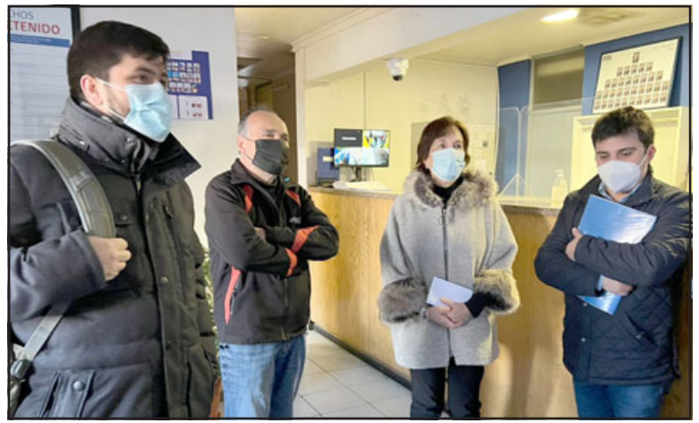
El Concejo Municipal presentó una denuncia en la PDI por los delitos de fraude al fisco y malversación de caudales públicos por doble pago a empresa de guardias de seguridad.

Dobles pagos que en ninguno de los distintos departamentos del municipio fueron detectados, como por ejemplo en Control. Es por esto además