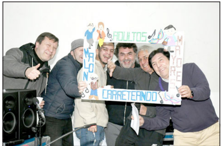
ADULTOS CARRETEANDO.- Sin duda, después de dos años de pandemia sin reunirse, el reencuentro se convirtió en un 'carrete' inolvidable.