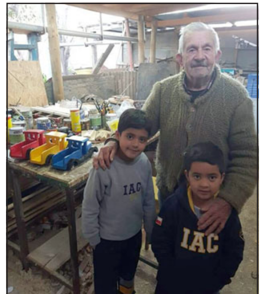
Acá con algunos regalones en su taller donde construía con sus propias manos y dinero de su jubilación, los juguetes que regalaba a los niños.