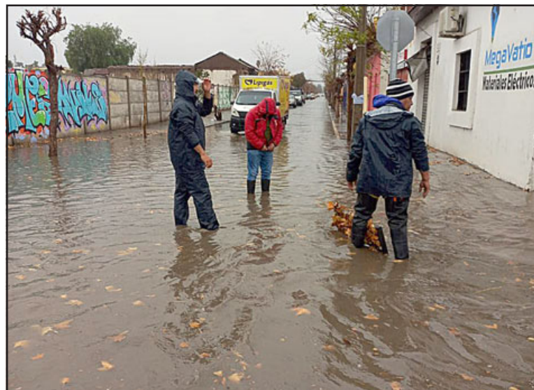
Intensas precipitaciones se anuncian para hoy y mañana, lo que eventualmente generará problemas de inundaciones en diversos sectores.