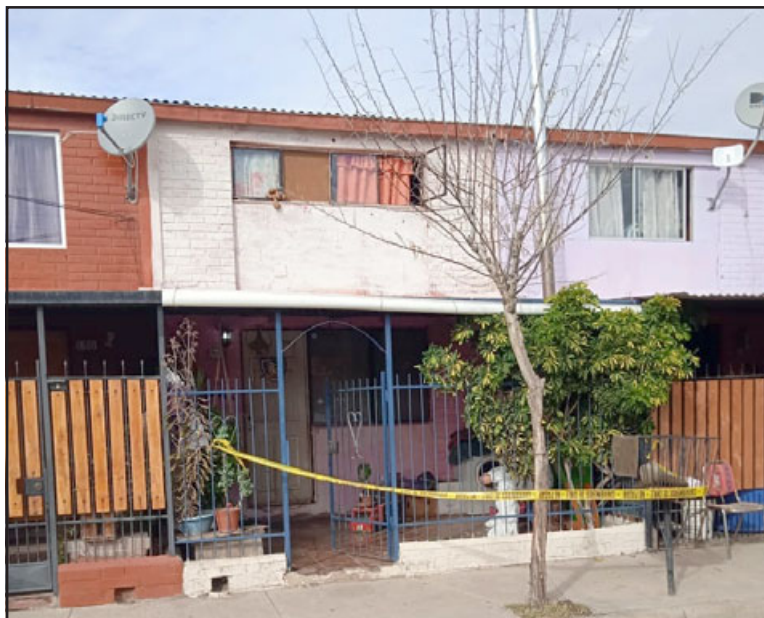
En esta casa habría ocurrido el homicidio o femicidio de una mujer de 56 años en Villa Curimón.

Señala que ellos fueron los primeros en llegar: «Efectivamente y lamentablemente esta persona mantenía ese tipo de lesiones, se comunicó con el señor fiscal de turno, el cual las diligencias de la especialidad en este caso de la BH, los cuales están trabajando en el sitio del suceso y está siendo catalogado como femicidio por el momento, solamente