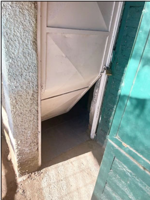
Por esta puerta accedieron hasta la bodega donde se guardaba la indumentaria sustraída.

nada, espero que lleguemos a buen puerto, porque además hay que tener claro que este campo es de administración municipal, por lo que deben tomar cartas en el asunto. Esto (complejo) nos sirve a todos y ellos (Municipalidad) saben que somos objetos de robos, así que no se enterarán por la prensa de estos hechos», culminó.