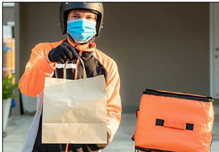
La norma protege a trabajadores de faenas agrícolas, de frigoríficos, parques, plazas, jardines, servicentros, obras de la construcción, reparadores, entre otros, quienes deben contar con las vestimentas adecuadas para ejercer su labor. (Foto referencial)

Además de quienes laboran en faenas agrícolas, en las ciudades también están expuestos a las bajas temperaturas trabajadores y trabajadoras de parques, plazas, jardines, servicentros, obras de la construcción, reparadores, entre otros.