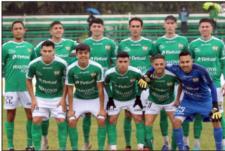
Si quiere seguir soñando con el ascenso, Trasandino no puede perder ante Deportes Concepción.

Este domingo en la capital de la Octava región, Trasandino de Los Andes deberá hacer frente a Deportes Concepción en un partido que puede resultar decisivo en las aspiraciones de los de Arrué para poder pelear el ascenso a la Primera B.