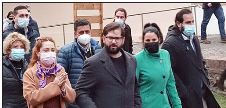
Pasadas las 17:30 horas, el mandatario llegó hasta el Centro Cultural Buen Pastor donde se reunió con emprendedores.