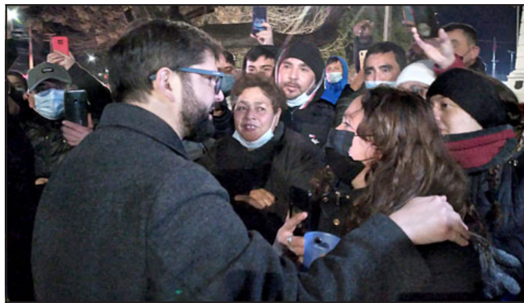
A su salida, saludó alegremente a las personas que lo esperaban.