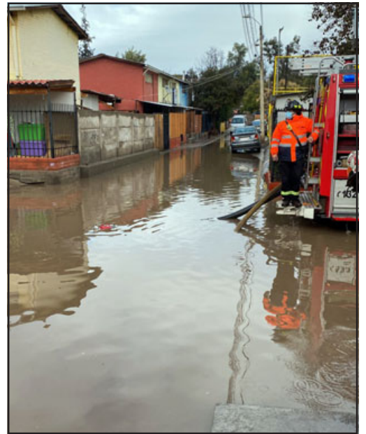
Ocho casas se vieron afectadas por nueva inundación en la Villa Curimón.

Es así como con barreras se cerró dicha arteria para impedir que esta situación vuelva a pasar, como ya ha ocu-