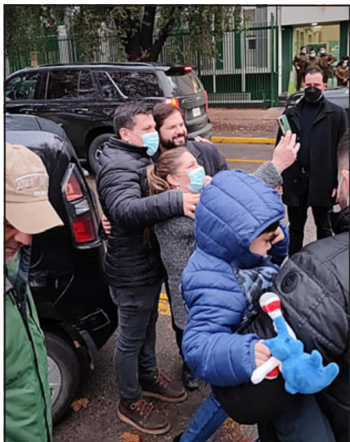
Presidente Gabriel Boric a la salida luego de visitar la prefectura y Segunda Comisaría de Carabineros de San Felipe.

Visita del mandatario a nuestra ciudad que culminó a eso de las 20:30 horas, y por supuesto que las fotos y 'selfies' no faltaron. Y es que lejos de subirse a los vehículos que lo esperaban, el mandatario salió a saludar a las personas que lo esperaban en el exterior durante horas, soportando la lluvia y el frío extremo que se hacía sentir a esa hora.