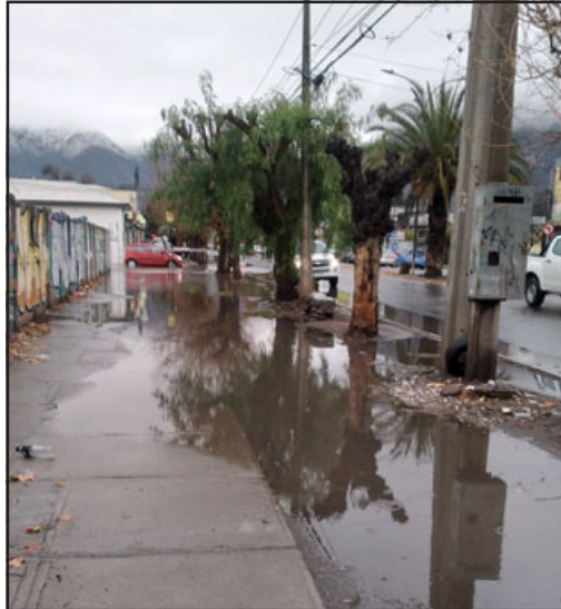
Maipú esquina San Martín nuevamente inundada.

rrido en años anteriores. Además durante la madrugada de ayer jueves, un generador explotó dejando sin suministro eléctrico a una gran parte del sector sur de la comuna, el que fue re-puesto a eso de las 8:00 de la mañana.