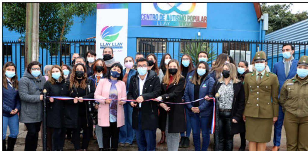
Diversas autoridades provinciales y parlamentarias participaron del tradicional corte de cinta que dio por inaugurado el nuevo Centro de Autismo Popular.

«Esta es una excelente iniciativa, porque en la comuna tenemos registrados más de 100 casos de niños que están con TEA, por lo que esto va a favorecer mucho a las familias y a los niños, principalmente porque en Llay Llay no había un lugar especializado en autismo, solo en algunos centros médicos hay un fonoaudiólogo, un terapeuta ocupacional y más de la mitad de las familias tiene que salir de la comuna para poder recibir atención, lo que implica no solo viajar, sino que los costos monetarios que son muy elevados, el tiempo, la locomoción, por lo