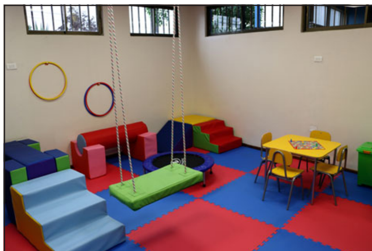
El centro es financiado íntegramente por el municipio, tanto en pago a profesionales a cargo como en la habilitación del espacio que cuenta con salas especialmente acondicionadas.