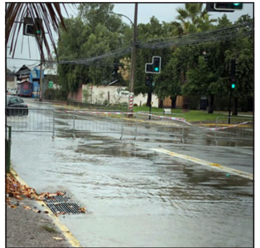
Avenida Encón fue cerrada para el tránsito vehicular y así impedir que el agua entre a las viviendas.

rrido en años anteriores. Además durante la madrugada de ayer jueves, un generador explotó dejando sin suministro eléctrico a una gran parte del sector sur de la comuna, el que fue re-puesto a eso de las 8:00 de la mañana.