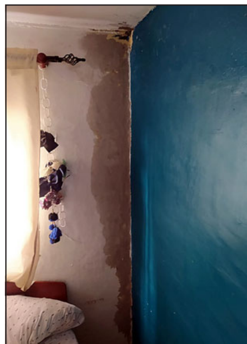
Tal como se aprecia en la imagen, la pared luce totalmente mojada.

- Claro, justo nosotros íbamos a preguntar, ella sale y nosotros le hicimos todas las con-