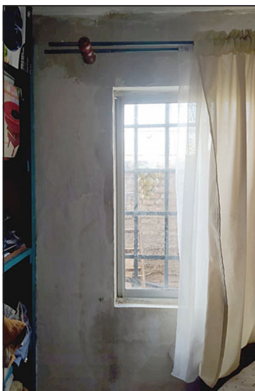
En la orilla del marco de ventana también se puede apreciar la humedad en la pared.

- Claro, pucha que ellos en realidad no manden la pelota para un lado a otro y se hagan responsable de lo que está ocurriendo. No soy la única porque yo subí esto a Facebook, tengo unas vecinas que están y una vecina que vive en una casa, minúsculo, tiene el mismo problema, pero mi vecina trata de arreglarlo, de cerrar las llaves, de que no me caiga, me entiende. No soy la única que está con este problema, y ¿por qué no hacen nada?, porque todos se lavan las manos. Si son viviendas sociales, yo no necesito que me venga a pintar, sino que arreglar las cañerías porque yo no puedo hacer eso si tengo un seguro.