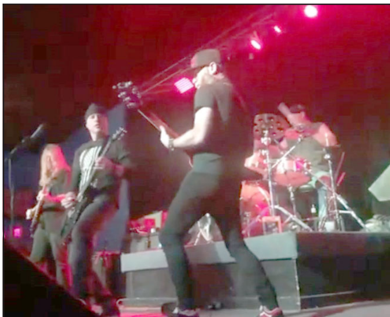
Prometen un show de calidad que recorrerá gran parte del continente.

en la ciudad de Rancagua, tiene una nutrida trayectoria discográfica. Hoy muestran su disco de estudio número 21 que, demostrando la experiencia adquirida en el camino, han denominado simplemente 'All' .