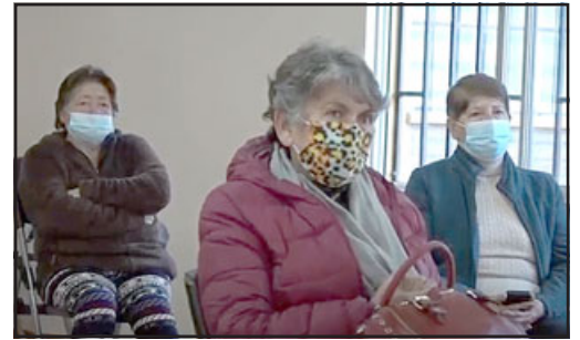
En total fueron diez los integrantes de la Oficina de Personas Mayores de San Felipe que recibieron su Certificación del Curso de Formación Mayor en plataformas digitales y uso de tablets .

«Durante la pandemia muchos de nuestros adultos mayores sufrían al no poder acceder a esta modalidad, por lo tanto en esta capacitación que hoy culmina, estamos muy contentos de que ellos puedan acceder a estas plataformas, ese es el trabajo que tenemos que desarrollar como municipio con la base fundamental de nuestra sociedad como son nuestros