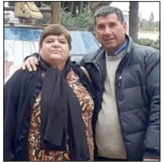
El matrimonio fallecido en La Ligua por intoxicación de monóxido de carbono.

colocarlo a una distancia de la casa, a unos cinco, seis metros, porque sale humo y provoca contaminación.