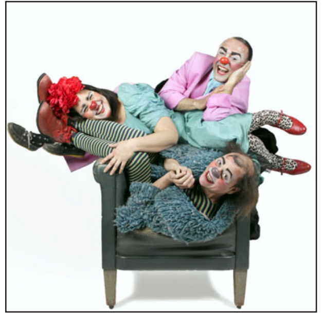
Festín de la Risa, organizadores del Primer Festival de Risas en Putaendo.

En este sentido, tanto el Festín de la Risa, como el Municipio de Putaendo, a través del Departamento de Cultura, Turismo y Pa-