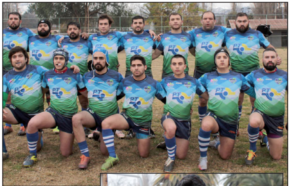
Los Halcones cuentan con una de las indumentarias más atractivas del Rugby nacional.

En la oportunidad el directorio de Los Halcones aprovechó la oportunidad de agradecer el aporte desinteresado de: Lavandería Bubles, Plus + Salud Ocupacional, Faena Express Servicio Logística -Los Andes y Neo Mineral S.A.