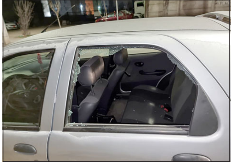
Acá el cristal roto de una de las ventanillas del automóvil que estaban desvalijando los imputados.

Fiscal de turno instruyó que ambos detenidos pasaran a control de detención ayer en la mañana, para ser formalizados por este delito.