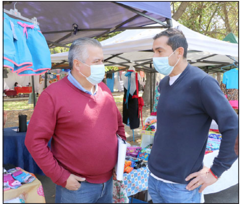
El alcalde Gonzalo Vergara valoró la adjudicación del Fondo de Incentivo al Mejoramiento de la Gestión Municipal (Figem), que entrega la Subdere.

El alcalde Vergara agradeció la labor de los funcionarios municipales por este premio: «Quiero agradecer el trabajo y compromiso de los compañeros de trabajo del municipio, en especial a los funcionarios del Departamento de Finanzas, que son quienes llevan al día esto».