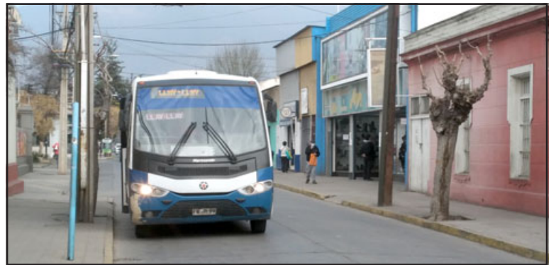
A partir del lunes 1 de agosto, la tarifa de las micros subirá en cien pesos.

nera problemas porque las máquinas tienen plazos para ser trabajadas, pagar permisos de circulación y todo eso», cerró.