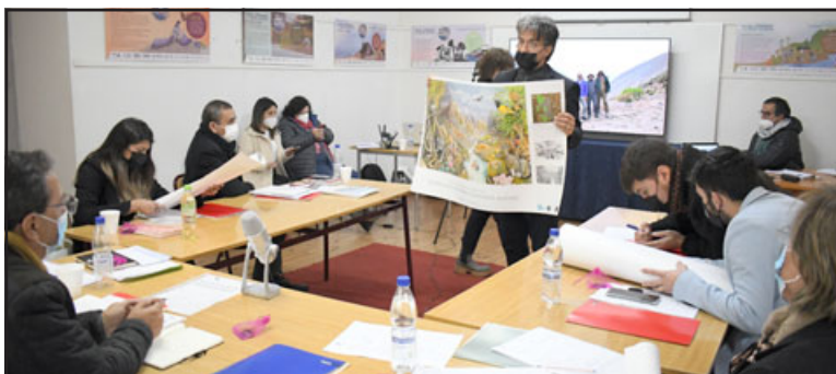
Presentación del Póster en el Concejo Municipal de Putaendo.