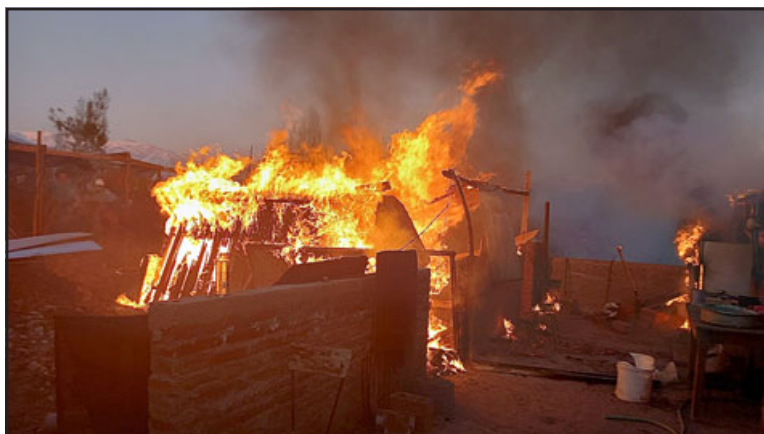
La vivienda ubicada en el cerro San José de la comuna de Santa María ardió por completo.