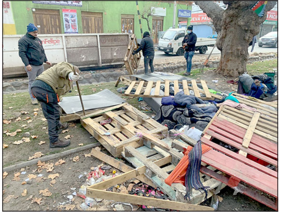
Equipos municipales trabajando en la erradicación del ruco en la alameda Chacabuco.