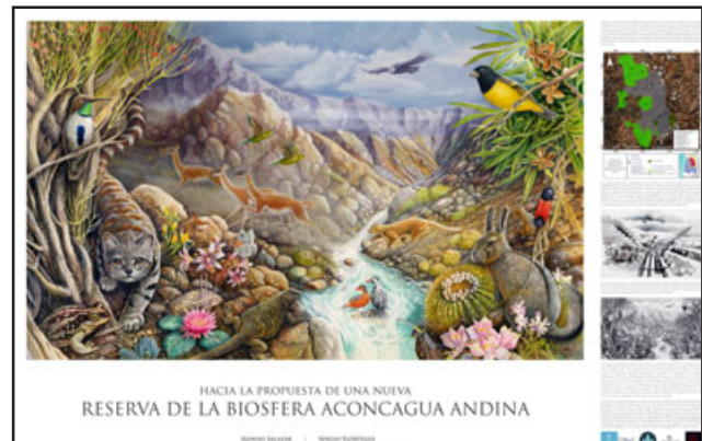
Póster que será distribuido en diferentes establecimientos educacionales, comercios y espacios de Putaendo.