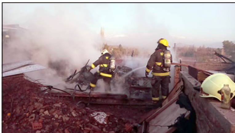
Bomberos trabajó durante horas para poder extinguir incendio.

ron este incendio, Arancibia indicó que «no hay ninguna hipótesis, según los vecinos el adulto venía llegando a su casa y luego de unos minutos se desató el incendio. No sabemos las causas propiamente tal, todo es materia de investigación por el departamento de investigación de incendio».