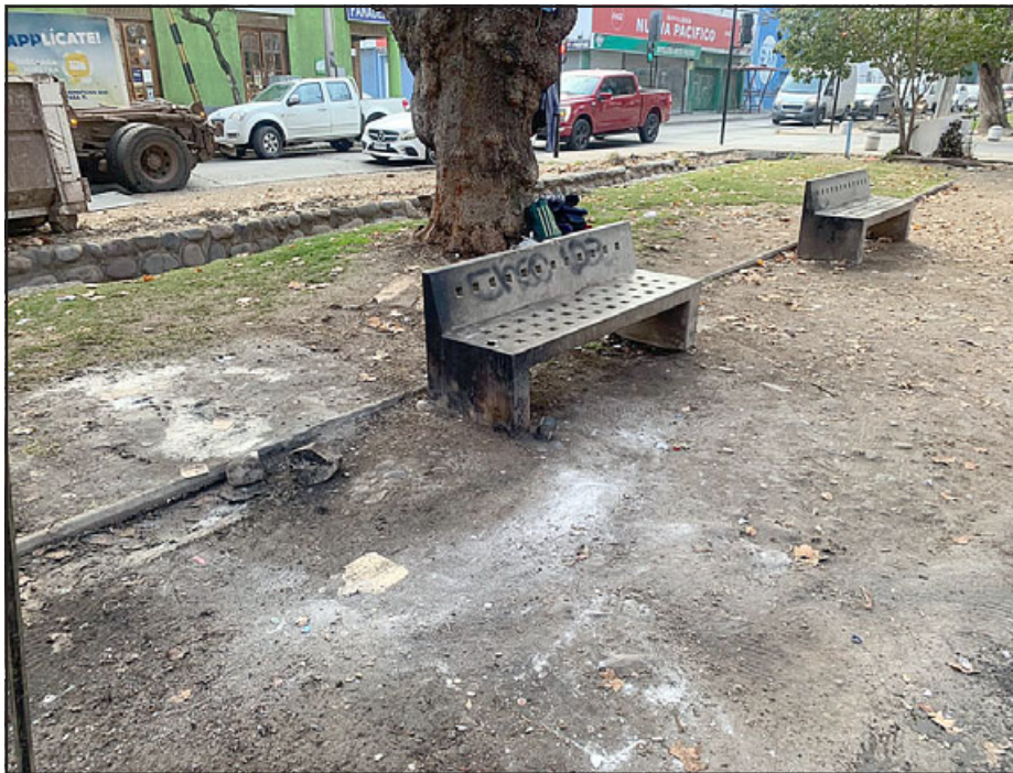
Así quedó la alameda Chacabuco tras la limpieza que se hizo en el sector.

tor de la cancha de tenis, puente El Rey, que respecto de este último ellos se encuentran al interior de un bien fiscal, por lo que será el IND que deben abordarlo. Como municipio trabajemos en el apoyo, porque entendemos que son personas que están por una necesidad».