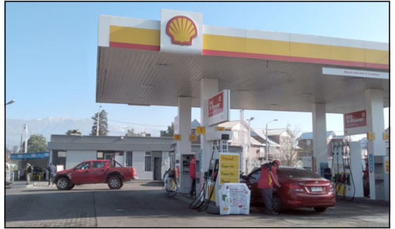
Grupo de tres delincuentes, armados y a rostro cubierto, asaltaron a trabajadora del servicentro Shell de la Avenida Encón.