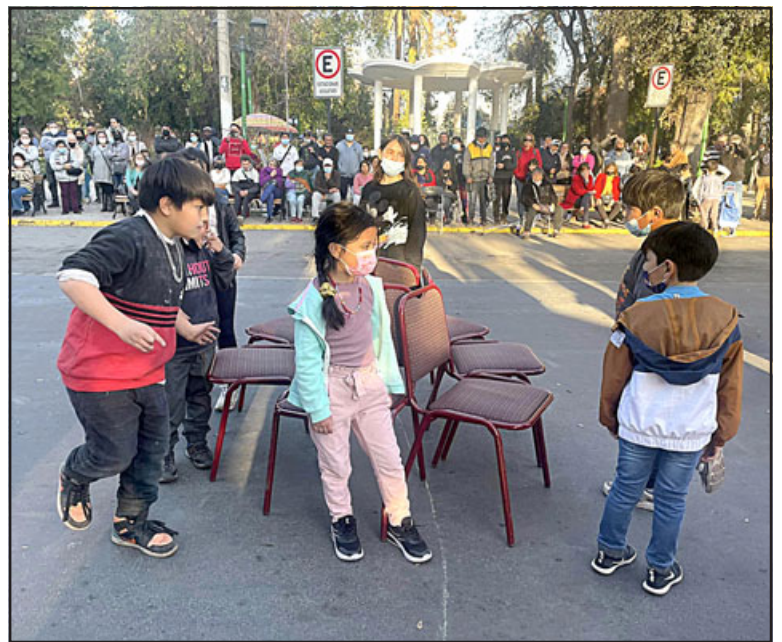
Los pequeños revivieron un antiguo juego como lo es la silla musical.