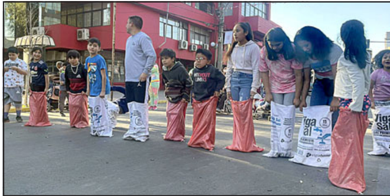
Las carreras en saco, otra de las grandes tradiciones de estas fiestas.