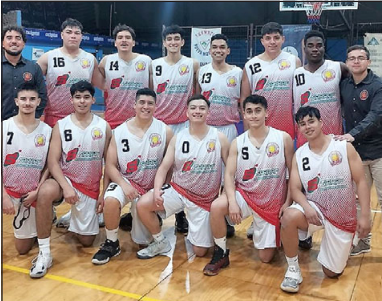
San Felipe Basket partió con el pie derecho la Liga de Desarrollo 2022.