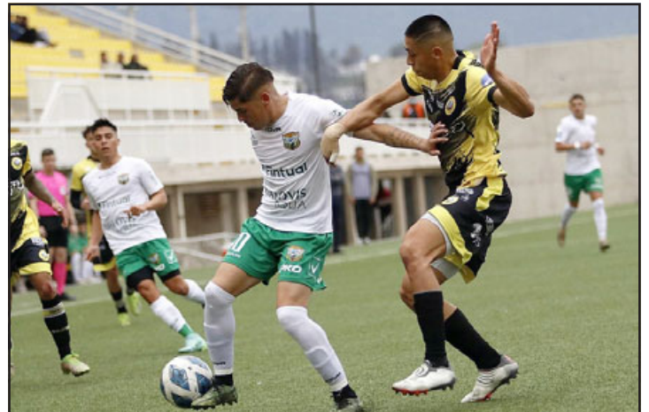
El equipo andino sufrió el sábado una dura caída ante Lautaro de Buin.

Tras el receso por las festividades patrias, Trasandino deberá recibir la visita de General Velásquez, en un pleito que en un principio está agendado para el domingo 26 del presente mes.