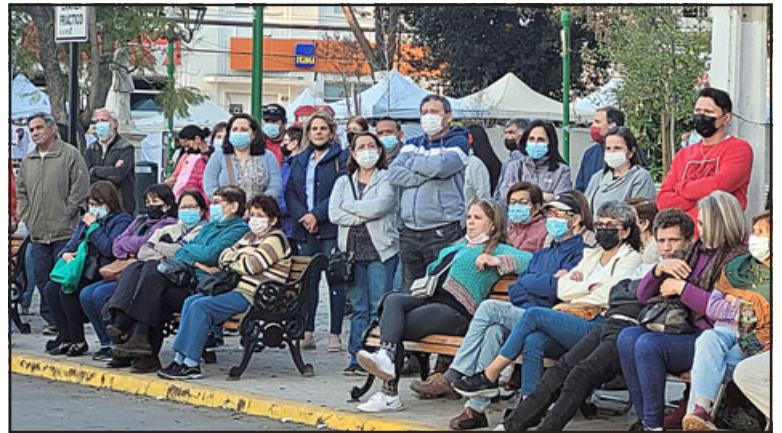
El público también fue parte de la celebración, mirando atentamente las diversas actividades que se desarrollaron.

manifestando que «estamos muy contentos porque esta tarde en primer lugar tuvimos los juegos típicos para ni-