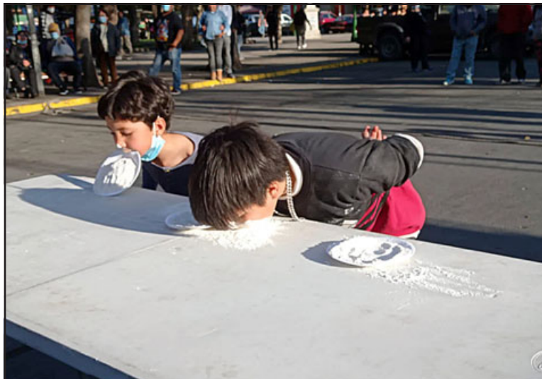
La yincana, otra de las grandes atracciones que tuvo la fiesta criolla.