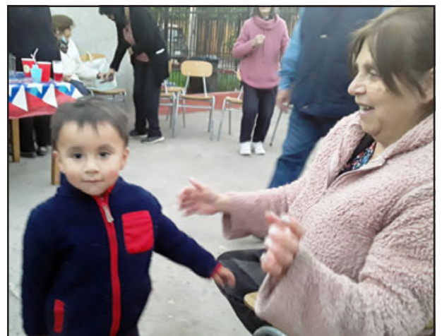
Los niños no podían estar ausente. Acá un pequeño vecino disfrutando y posando para nuestro medio.