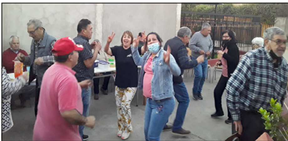
Bailando a todo ritmo vecinas y vecinos de Villa Padre Hurtado, celebrando las fiestas patrias.