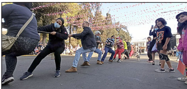
El juego de tirar la cuerda también estuvo presente en esta celebración.

nal, convocando a grandes y chicos a bailar con la música de 'Los de Septiembre' y 'Los Roblerinos de Linares'.