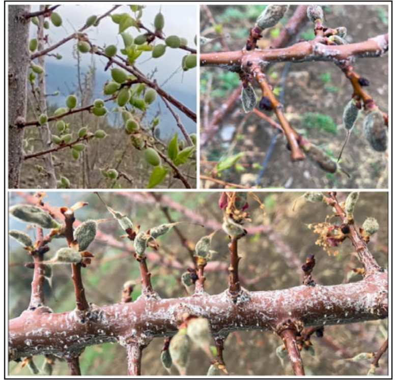
Las últimas heladas que han llegado a 3 grados bajo cero, han causado estragos en la producción frutícola.

De acuerdo a lo conversado con la Seremi de Agricultu-