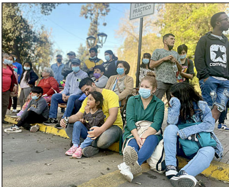
Los sanfelipeños llegaron en familia a la atractiva jornada del sábado.