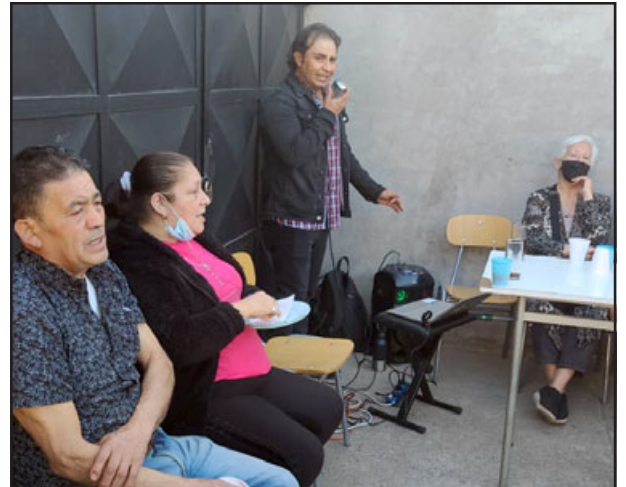
La música, infaltable en toda celebración que se respete.