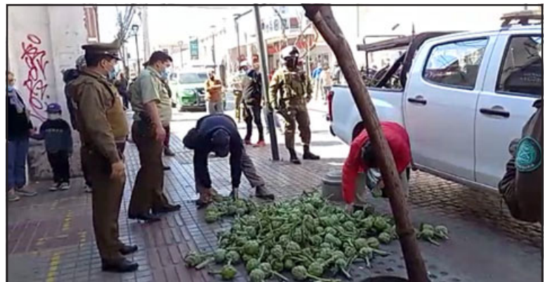
Carabineros vigila alrededor mientras los inspectores municipales recogen las alcachofas tiradas en el suelo.

El oficial agregó que con respecto a este tipo de fiscalización por parte de Carabineros, « quiero señalar que esta acción policial se ha estado desarrollando desde principios de año en conjunto con el municipio, donde se han desarrollado diversas reuniones, mesas de trabajo, con la gran mayoría de los comerciantes