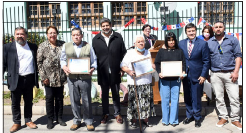
En la ocasión además se realizaron reconocimientos a algunos vecinos y un minuto de silencio por las víctimas del Covid-19.

Te invitamos a seguir estas recomendaciones para prevenir eventuales contagios del COVID-19