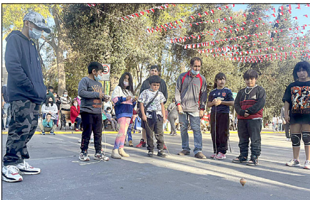
Un juego tradicional casi desaparecido en los últimos años, fue revivido por grandes y chicos.

«Esta es una gran alegría que hoy podamos estarlo desarrollando, con este marco de público, que a pesar del frío se hizo presente; fue fantástico también la participación de los niños. Agradezco al Departamento de Deportes que tuvo una planificación impecable de los concursos (juegos criollos) y el cuecazo que es una tradición que no puede perderse, es parte de nuestras raíces y costumbres», destacó finalmente la presidenta de la agrupación folclórica.