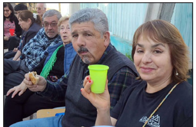
La tradicional empanada de pino no podía estar ausente como vemos en la imagen.