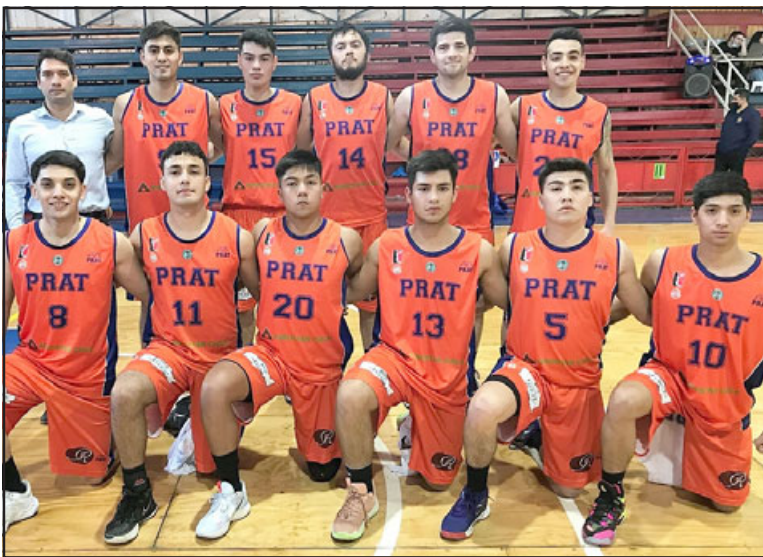
El Prat sucumbió en el alargue ante su clásico rival.