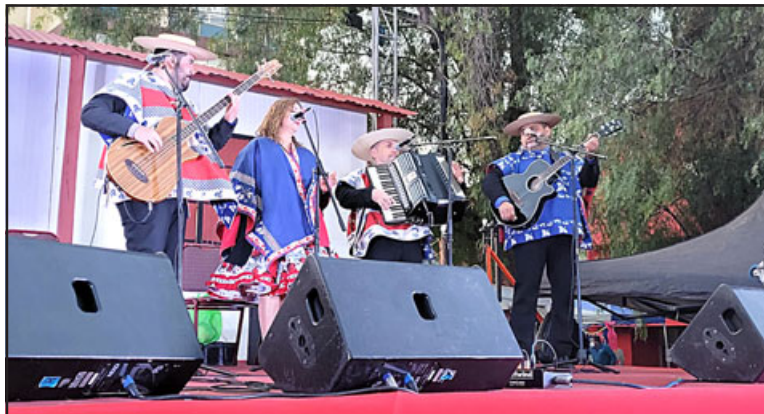
Música chilena en vivo para animar la alegre jornada del sábado.