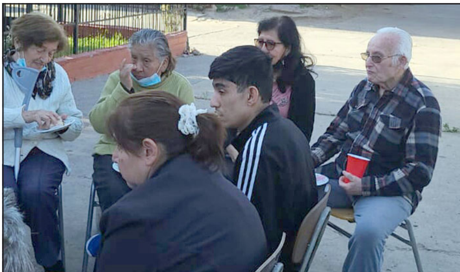
Acá un joven compartiendo con los mayores, disfrutando de la celebración.