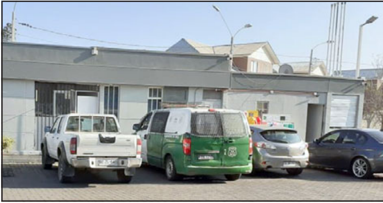
Carabineros llegó al establecimiento para buscar a los autores del hecho.

El servicentro Shell estuvo cerrado por casi una hora mientras Carabineros adoptó el procedimiento de rigor, y posteriormente retomó el trabajo.