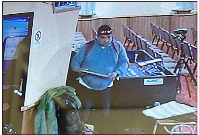
En plena faena y con total calma el delincuente robó los notebook.

a un trabajador del teatro y en su interior contenía también sus documentos; «toda la información, así es que hemos realizado la denuncia, liberado las cámaras que están al interior del teatro a Carabineros de Chile. Entendemos que han hecho un seguimiento de este delincuente, esperamos por el bien de nuestros funcionarios puedan encontrarlo para no tan sólo recuperar sus especies, sino que también se haga algo de justicia. Esta es una situación lamentable que no sólo afecta a un edificio público municipal, sino que también afecta diariamente a nuestra ciudadanía y manifiesta claramente la necesidad de tra-