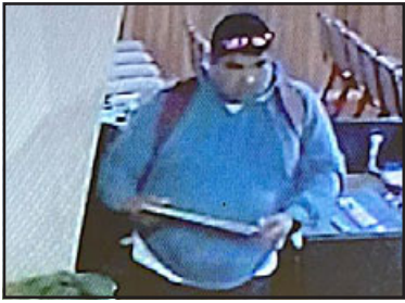
Las cámaras registraron el robo