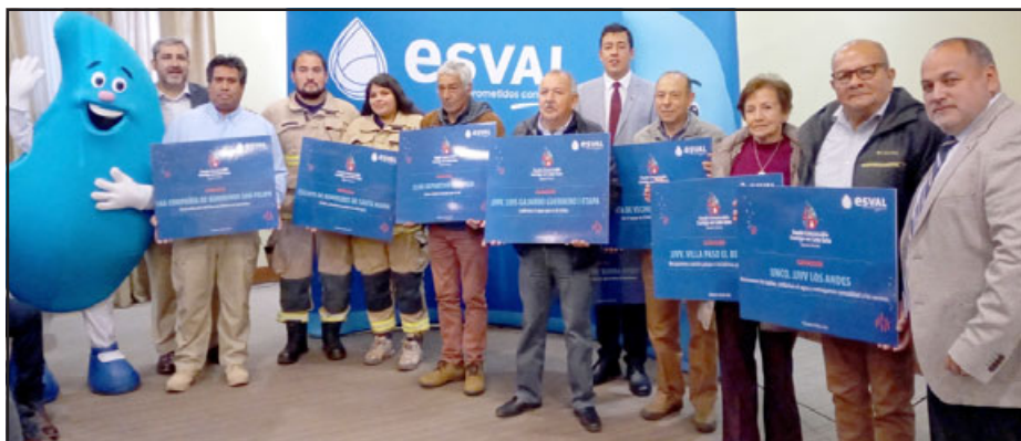
Las provincias de Los Andes y San Felipe en conjunto alcanzaron diez proyectos seleccionados.

Los proyectos podrán ejecutarse hasta fines de este año y el listado de las organizaciones beneficiadas y sus iniciativas, está publicado en www.esva.cl