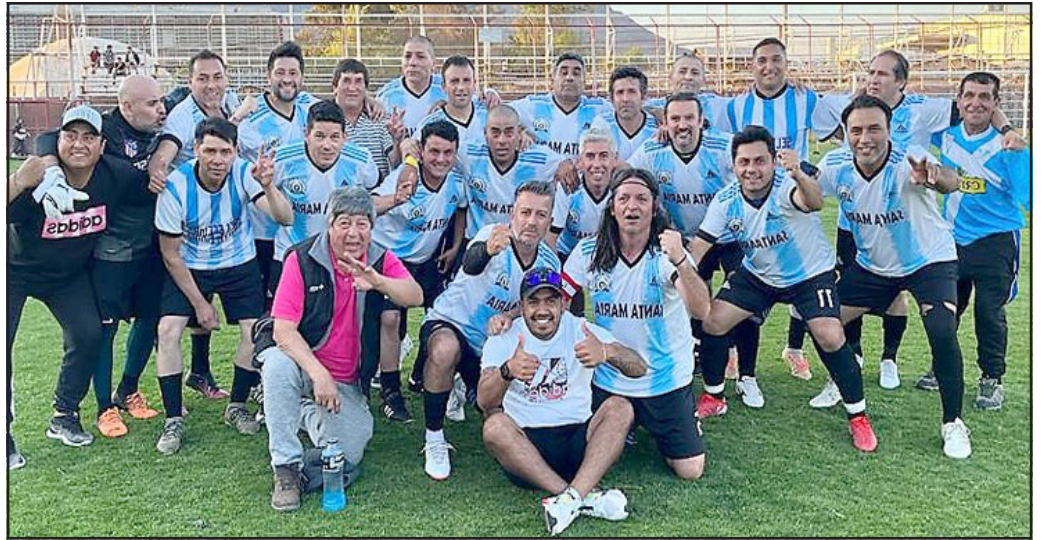
La selección de Santa María buscará acceder a la final del Regional Sénior.

bado 8 de octubre 18:00 Puerta del Pacífico – Nogales 19:30 Santa María – San Esteban