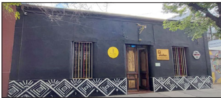
En la 'Casa Negra' se desarrollará la presentación artística de Lumínica.

«Tenemos un compañero en el colectivo que es diseñador, y a él se le ocurrió la idea de hacer como una instalación lumínica, queremos que sea el tema central de la expo, luces, láser, vamos a recolectar todas las luces que tenemos a nuestra disposición, desde navideñas, una lámpara, diferentes tonos y así crear un ambiente», cerró la artista sanfelipeña.