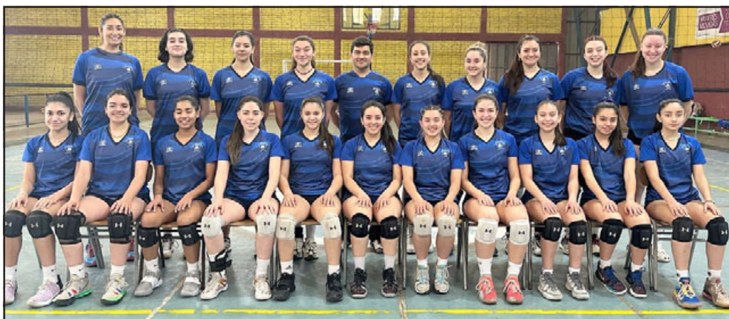
Unión Volley es parte de la liga femenina más importante del país.