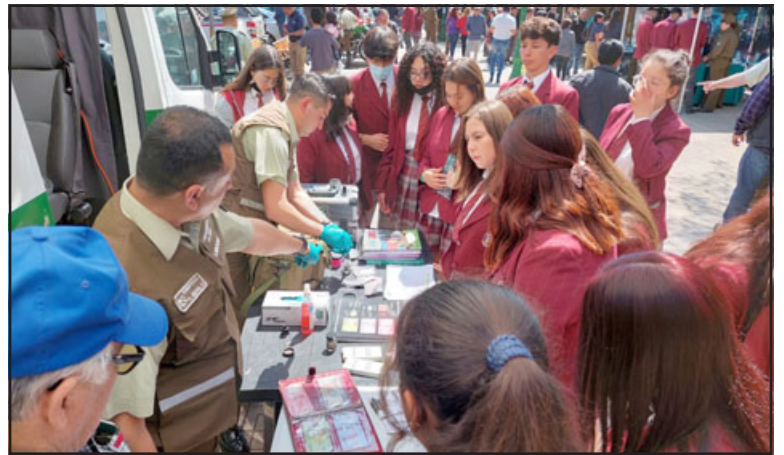
Alumnos del colegio Alonso de Ercilla en una muestra interactiva con el Laboratorio de Criminalística (LABOCAR).

des frente a una gran cantidad de público, en el que además se encontraban cursos