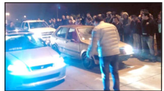
Nueva ley sanciona a quienes participen y organicen carreras clandestinas.

Carreras en las que muchas veces se han producido accidentes