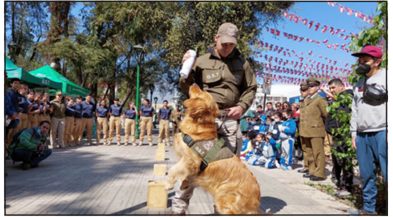
Perro antidrogas del departamento OS7, realizando demostración de habilidades frente alumnos del colegio Pumanque y Premilitar del Liceo Mixto.

Otras actividades que tuvo el evento fueron las muestras de los vehículos de patrulla marca Dodge, motos de tránsito (tipo escolta), motos todo terreno, vehículos de uso comunitario, vehículos Dodge Ram para uso en montaña, muestra antidrogas del OS7 y trabajo táctico de perro ‘antidrogas’. Con respecto a esto último, el perro del OS7 realizó una demostración de sus habilida-