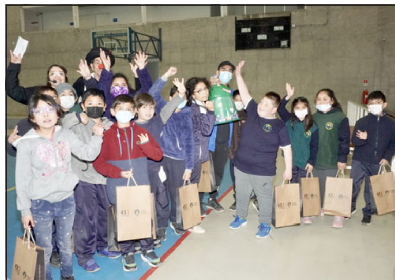
El concurso de educación en reciclaje dirigido a las escuelas de la comuna reconoció los mejores videos desarrollados por los estudiantes.

Los audiovisuales recibidos destacaron el entusiasmo y conocimiento de los niños por una correcta disposición final de dichos materiales y el sentido de urgencia de actuar hoy y reciclar para que el planeta mucho tiempo nos pueda durar. Entre los premios para el curso ganador destacó la visualización de su video en las redes sociales de Elige Vidrio.