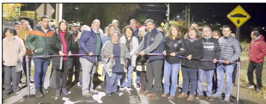
El proyecto debió esperar por más de 30 años para ser realidad.

La obra consistió en la instalación de postes de alumbrado público con sus respectivas luminarias por todo lo largo del sector, gracias al financiamiento de la Subsecretaría de Desarrollo Regional, por un monto de inversión que superó los 120 millones de pesos.