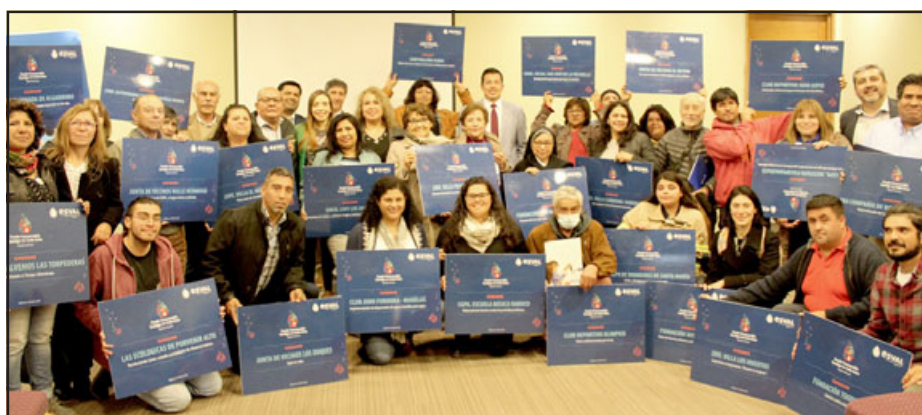
Dentro de las organizaciones seleccionadas hay juntas de vecinos, clubes deportivos, fundaciones, comunidades educativas y compañías de Bomberos.

Dentro de las organizaciones seleccionadas hay juntas de vecinos, clubes deportivos, fundaciones, comunidades educativas y compañías de Bomberos, que podrán concretar iniciativas de mejoramiento de infraestructura comunitaria, educación, desarrollo sostenible y uso eficiente del agua, ante la grave sequía que se mantiene en la zona.