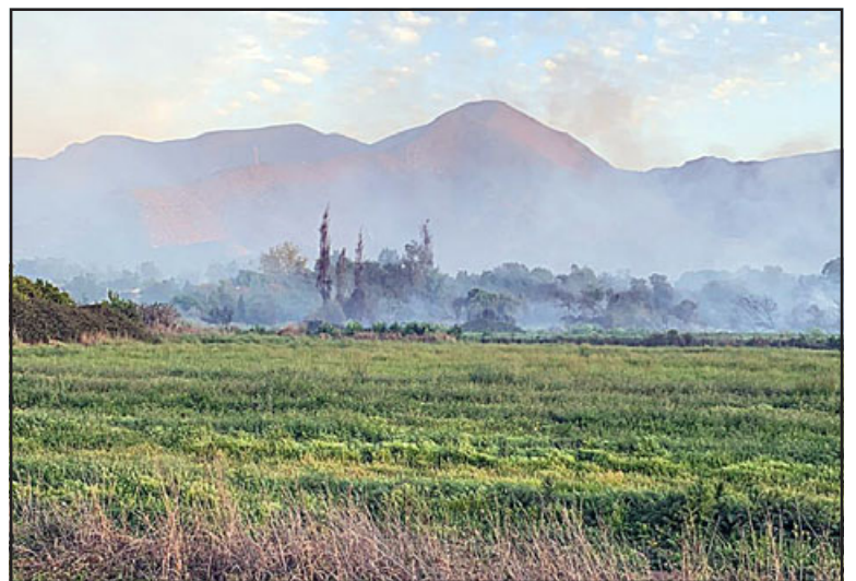
Tras varias horas de trabajo, Bomberos logró controlar la emergencia.