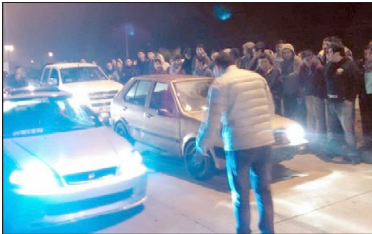
Alrededor de 15 infracciones cursó Carabineros en el marco de las fiscalizaciones por la ley que prohíbe las carreras clandestinas. (Imagen referencial).