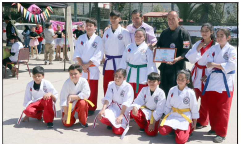
Las actividades deportivas como las artes marciales también fueron parte de esta llamativa feria realizada en Panquehue.