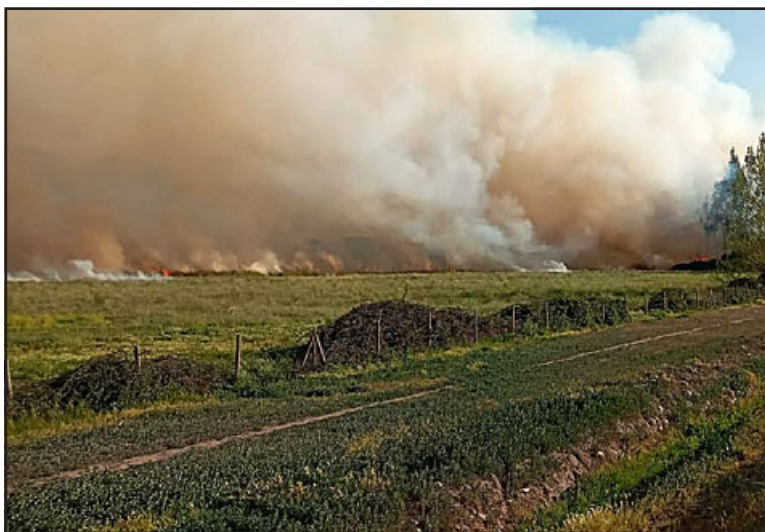
Una inmensa columna de humo emanó de este incendio.