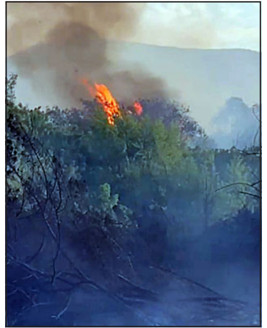
Grandes lenguas de fuego generó incendio en sector San Roque en la comuna de Panquehue.

Emergencia que por un momento provocó la incertidumbre y el miedo entre los habitantes cercanos al lugar, ya que el fuego estuvo muy cerca de alcanzar las viviendas del sector. En este sentido, el comandante Herrera detalló que fue «muy complejo este incendio para el tiempo en donde no tenemos grandes calores, el pasto todavía no está seco como corresponde y por ende fue muy complejo, pero a la vez muy bien trabajado, afortunadamente las viviendas no tuvieron problemas, pero llegó a menos de 5 metros del fuego y se vivieron momentos muy com-