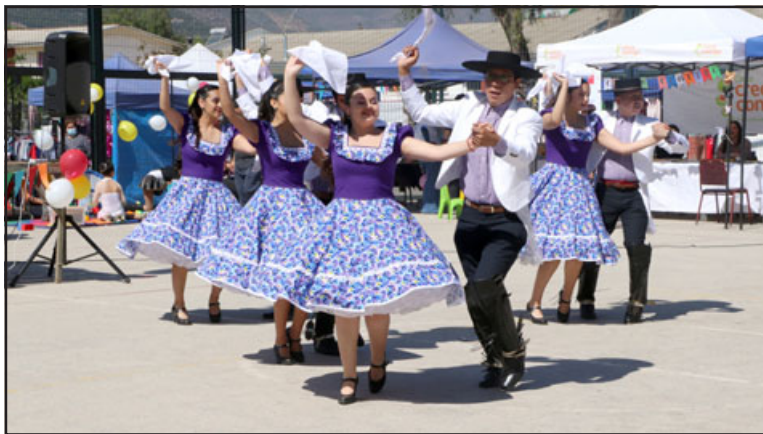
Los grupos folclóricos Pangué y Tradición Chilena pusieron la nota de chilenidad con sus bailes de cueca.

sobre todo son de vida sana. También es bueno que los niños puedan integrarse con los otros deportistas de la comuna. Es bueno que exista variedad de las disciplinas en Panquehue. Los niños estuvieron contentos de participar», señaló Castro.