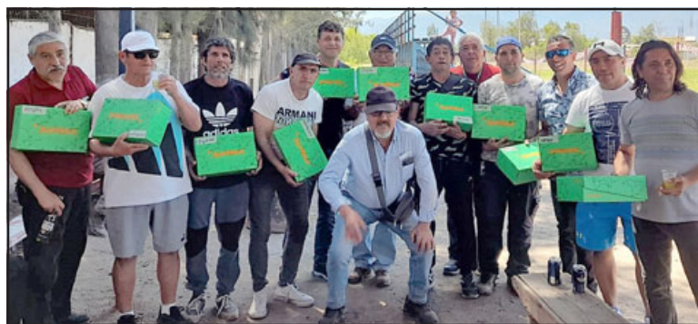
Los jugadores y socios de Carramiñana ya tuvieron un espacio de celebración adelantado de este aniversario.

El directivo reiteró el saludo y envió un abrazo a todos los socios en este día, agradeciendo su aporte y compromiso para sacar adelante al club, cultivando la sociabilidad, respeto deportivo y los valores que los enaltecen desde su fundación hace 38 años.