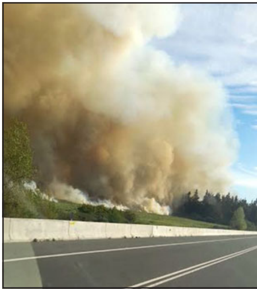
El fuego estuvo muy cerca de llegar incluso a la autopista Los Andes.