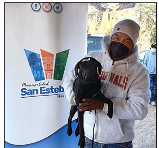
Los equipos veterinarios se trasladarán hoy miércoles 19 a la sede comunitaria de Villa Los Crisoles, y mañana jueves arribarán hasta la sede comunitaria de la Villa Esmeralda.

«El compromiso del Alcalde era llegar a las 2.000 esterilizaciones durante el año y con ambos operativos ya alcanzaremos las 1.700, lo que nos pone muy contentos porque hemos habilitado una opción que viene a aliviar el bolsillo de nuestros vecinos», finalizó.