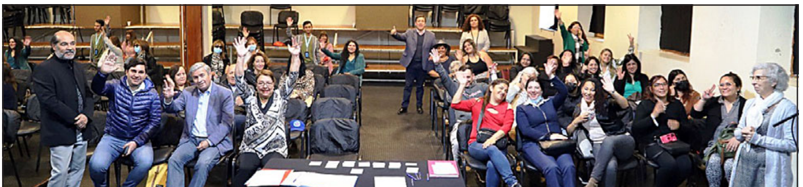
La nueva entidad fue creada a través de la Oficina Municipal de la Discapacidad perteneciente a la Dideco de la Municipalidad de Los Andes.

La directiva provisoria de la unión comunal tiene una duración de 60 días, y luego de ello se debe hacer un proceso electoral para un periodo de dos años.