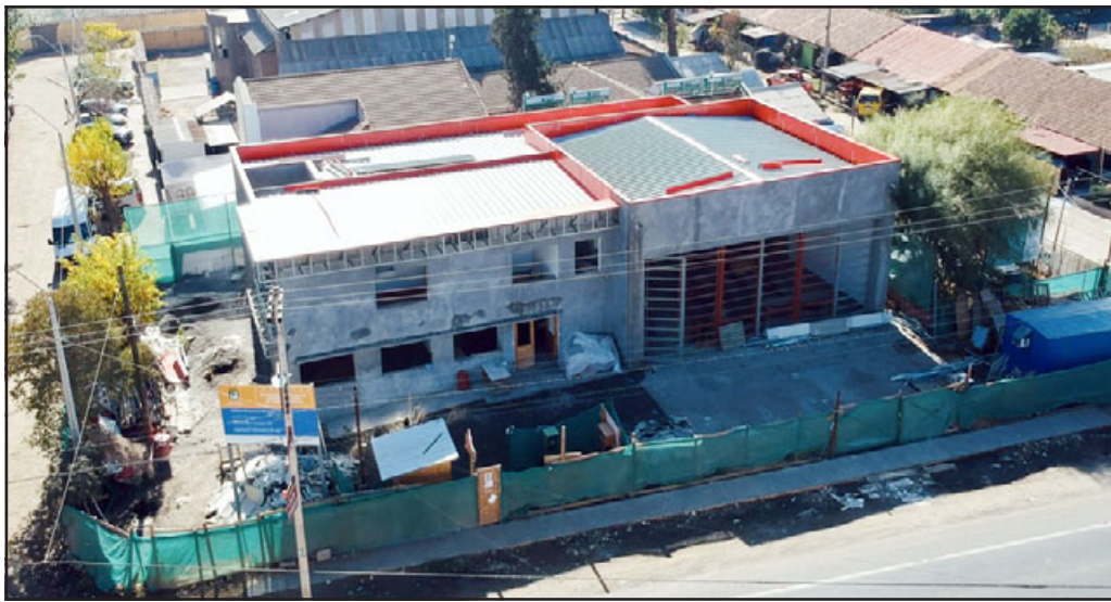
Las abandonadas obras del cuartel de Bomberos de Curimón se retomarán antes de fin de año.