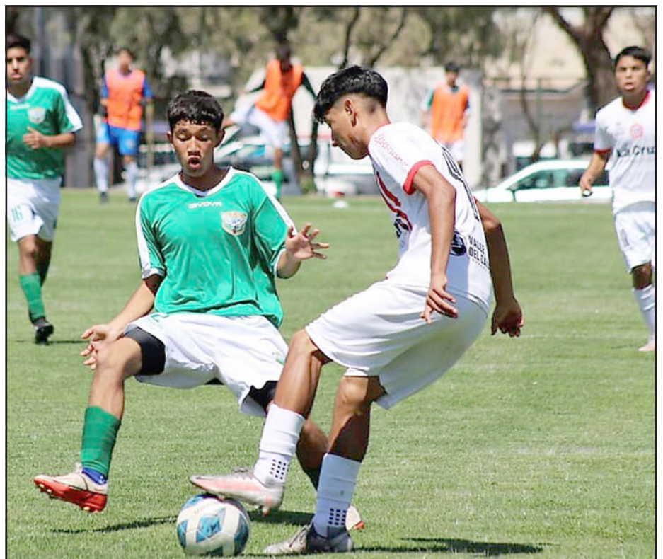
DE CARA AL MAÑANA.- Las canteras del Uní Uní y Trasandino se enfrentaron en la novena jornada del torneo Regional Centro.