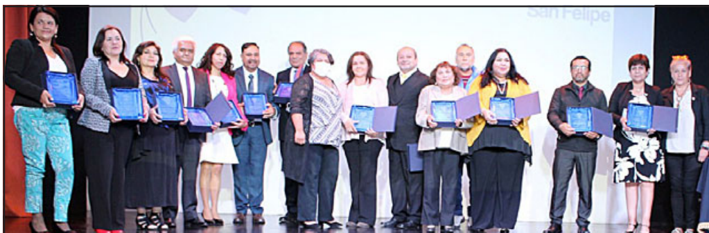
Docentes distinguidos por 25 años de servicios.