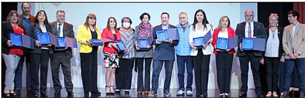
Docentes distinguidos por 30 años de servicios.