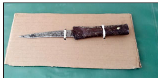
Esta es el arma blanca que el detenido mantenía oculta entre su ropa.

Junto con esto, y al realizar la investigación respectiva, Carabineros descubrió que este sujeto además mantenía una orden de detención pendiente por el delito de estafa, emitida por el juzgado de garantía