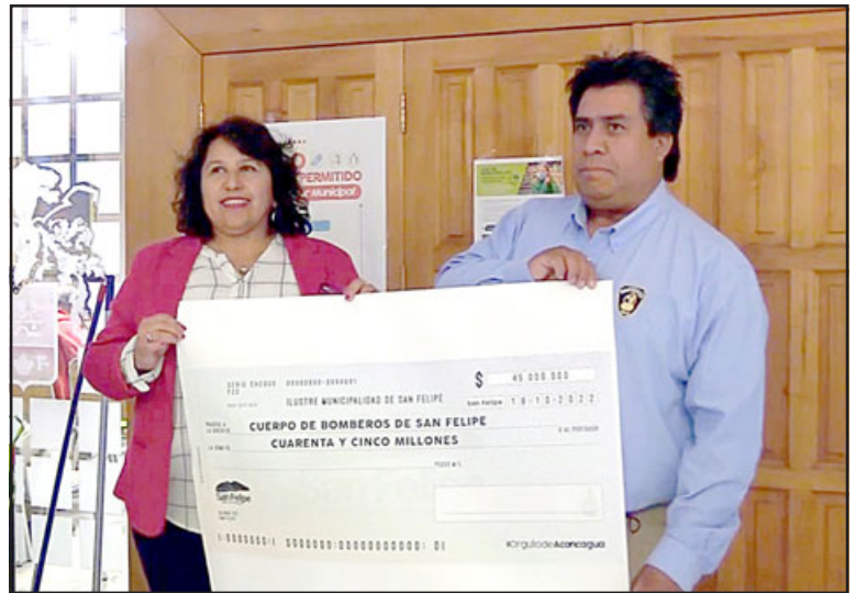
Municipalidad de San Felipe entregó la primera cuota de la subvención al Cuerpo de Bomberos de nuestra ciudad.

Junto con esto, el Superintendente además valoró el