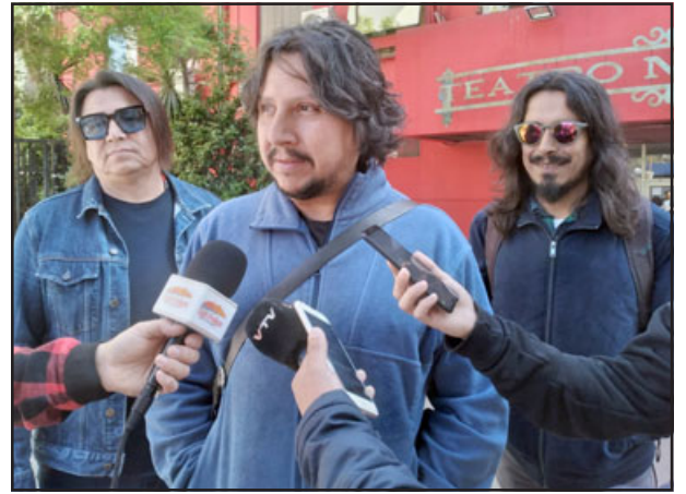
'Chiejaus', banda de 'rock a secas', tocará este viernes 21 de octubre en el teatro municipal a las 18.45 horas.