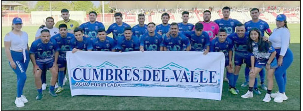
Sin mayores sobresaltos Juventud La Troya de San Felipe se instaló en la segunda fase del Regional de clubes.

Fueron los troyanos los que sortearon con más calma y holgura su clasificatoria al imponerse por 3 goles a 2 a Católica de Rinconada, mientras que Unión Delicias debió recurrir a una tanda de lanzamientos penales para dejar en el camino -para muchos de manera sorpresiva- al Miraflores de Santa María, cuadro que se había armado para pelear el certamen.