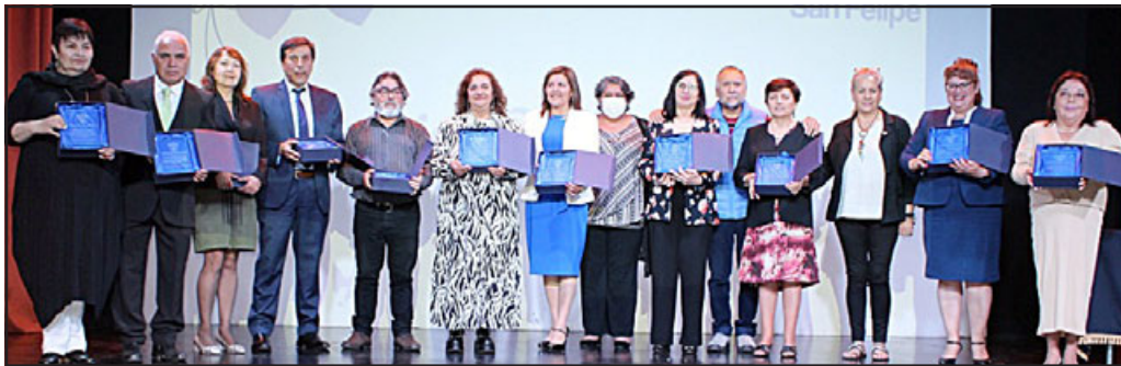
Docentes distinguidos por 35 años de servicios.