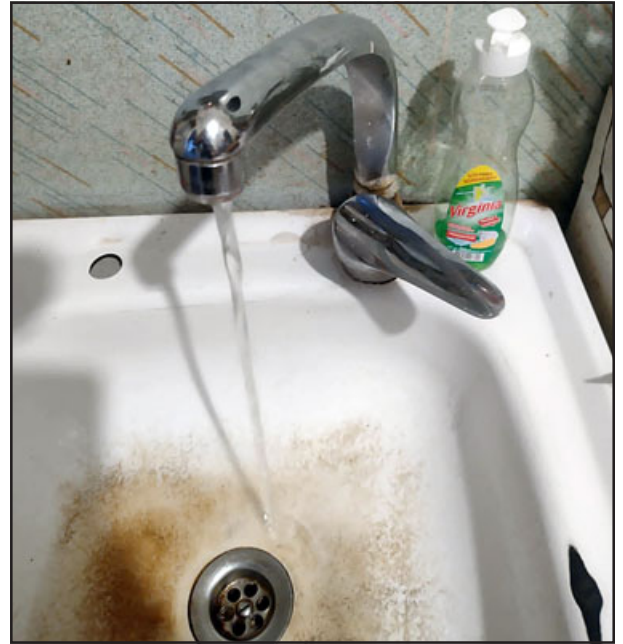
Baja presión de agua, como en la imagen, viven vecinos de Villa El Carmen de San Felipe.

- Vamos a tener que llegar a eso, sino no tenemos