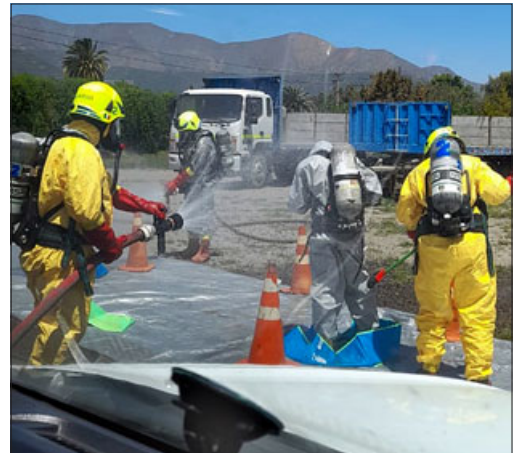
A las personas expuestas se les recomendó lavar sus manos, su ropa y si es necesario una ducha, ya que el agua es el elemento que permite que la sustancia se diluya.

aplicarse una ducha, ya que el agua es el elemento que permite que la sustancia se diluya».