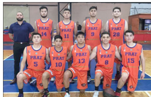
El Prat aún no sabe de triunfos en la Liga de Desarrollo 2022.

Sin lugar a dudas el partido que acapará mayor atención será el que protagonizará el quinteto juvenil pratino por la Liga de Desarrollo, donde deberá enfrentar a Quilpué Básquet. En dicho encuentro los