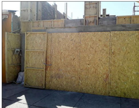
A esta construcción entró a robar el solitario delincuente durante la madrugada de ayer en Avenida Maipú.

• Sustrajo herramientas que pertenecían a los trabajadores.-