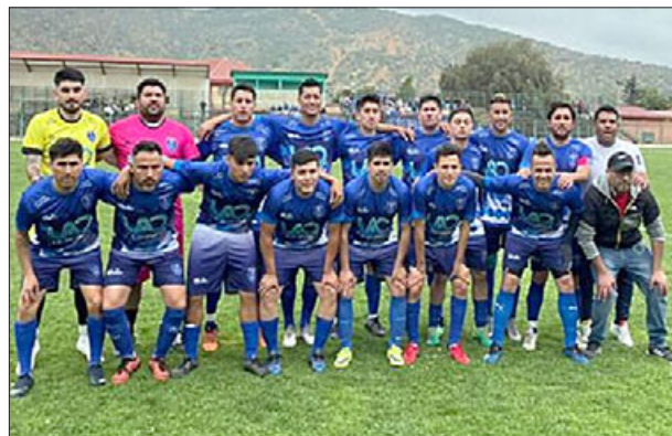
El equipo de Juventud La Troya que mañana se enfrenta a Unión Delicias.

nosotros no hemos tenido ningún conflicto con ningún club. Yo creo que eso depende netamente de los dirigentes, el compromiso, el fiato que haya entre los dirigentes cuando se enfrentan los clubes; o sea, es importante eso que se hace, el compromiso de la gente, pero lamentablemente no se ven las cosas buenas del fútbol, siempre se está mostrando lo malo porque eso genera más noticia que lo otro. Yo he visto grandes cosas que se han hecho en el fútbol amateur, padres, dirigentes, que trabajan con los niños, se hacen actividades, hay muchas cosas que no se reconocen, clubes que salen adelante, que tienen sus cosas, implementación, infraestructura, que se la luchan, hacen actividades, entonces esas cosas no salen a la luz, entonces lamentablemente en nuestra sociedad en qué nos fijamos. Porque puede ser posible que todo el campeonato en San Felipe vaya muy bien durante este año, pero ocurre una situación y va a echar a perder todo, entonces es lamentable. Yo creo que es un tema de cultura también y de nuestra sociedad.