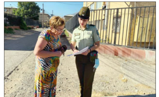
Carabineros realizó campaña informativa en la Villa El Totoral.

«También entregamos información para que los vecinos se atrevan a denunciar para levantar la cifra negra del sector, porque hay veci-