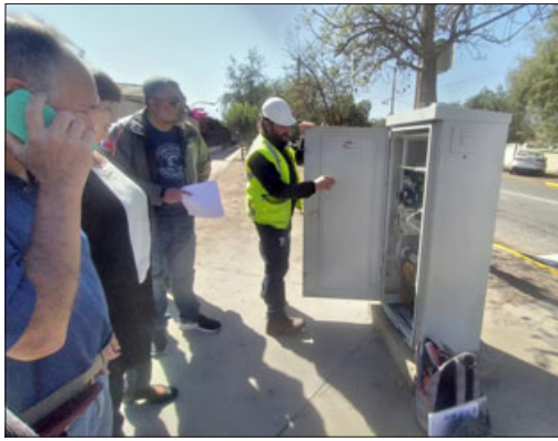
Momento exacto en el que comenzó el funcionamiento de estos semáforos.

necesidad de la instalación de este semáforo. En estos momentos nos monitorean a nivel central dado al sistema inteligente de semaforización y este es uno de los semáforos inte-