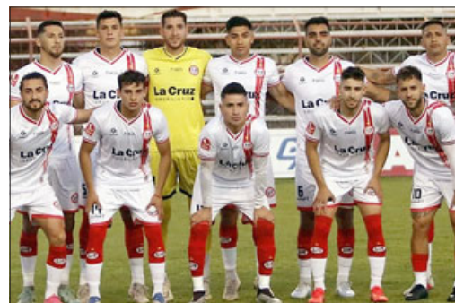
Unión San Felipe podría convertirse en el verdugo de su afligido rival de este martes.