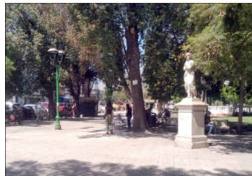
Plaza de Armas será cerrada este sábado desde las 20:00 horas para labores de limpieza.

Posterior a esta labor, el municipio continuará con las labores de limpieza en las baldosas de la Plaza de Armas de nuestra ciudad.