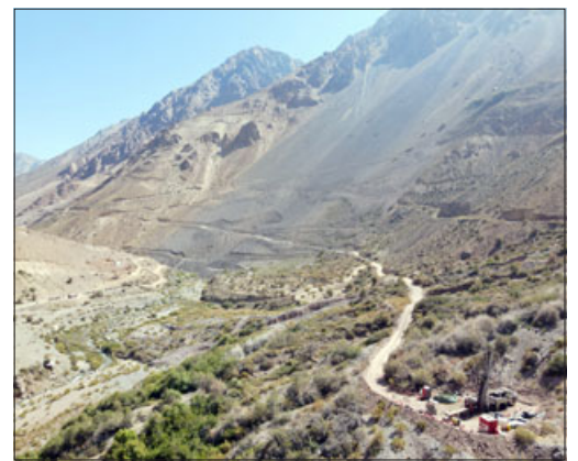
Un nuevo revés sufre la empresa Vizcachitas Holding. Este año la Corte Suprema ratificó que extraía agua ilegalmente y que alteró el curso del Río Rocín, en tanto el Tribunal Ambiental ya le ha ordenado dos veces en este 2022 que paralice su campaña de sondajes mineros.

«Aquí se da un escenario bien favorable o expectante, de momento que entendemos que la exposición y los fundamentos del reclamo de la municipalidad de Putaendo, tienen peso específico que contribuirían o permitirían al SEA revocar la resolución de calificación ambiental que tiene en este momento la minera Vizcachitas Holding (...) Cuando iniciamos este reclamo no existía jurisprudencia emanada del Segundo Tribunal Ambiental que aceptara la legitimación activa de las municipalidades. Por eso, este fallo representa un cambio de criterio al respecto, que valoramos en lo profesional y desde la municipalidad, porque permite hacer una defensa ambiental más eficiente y efectiva del territorio, al tener acceso a la justicia por parte de la municipalidad, tal como se explica en este fallo», manifestó Avendaño.