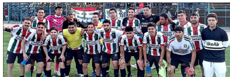
En el Municipal de San Felipe, El Roble de Llay Llay buscará el pasaporte a cuartos de la Copa de Campeones.

17:00 Español (Puerta del Pacífico) – Estrella de Prat (Llay Llay)