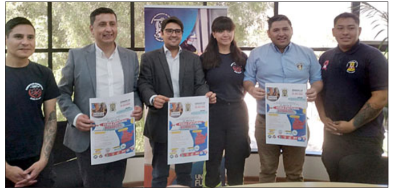
Bomberos de la Segunda Compañía lanzaron las actividades de su aniversario junto al municipio.

La invitación es para este sábado 29 de octubre, en donde tendrán los espacios bien definidos para el desarrollo de esta actividad. «Nosotros cuando nació la idea de poder hacer una feria cultural bomberil, nos tocó golpear la puerta del municipio y nos brindaron el apoyo. La feria va a ser en la alameda O'Higgins y Avenida Maipú, utilizando