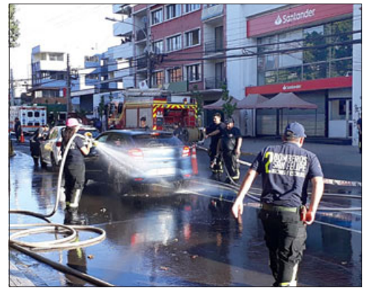
Voluntarios de Bomberos lavando autos frente al cuartel de la Primera Compañía.

- ¿Cómo les ha ido siendo casi las ocho de