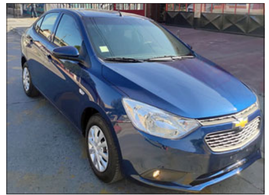
Este es el auto que Bomberos de la Cuarta Compañía de San Felipe está rifando y usted puede llevarse por tan sólo mil pesos.

- Claro, el auto efectivamente está cero kilómetros y hay que hacer el traspaso no más del vehículo, pero en sí el vehículo está llegar y andar, con las patentes al día con el permiso de circulación y todo eso.