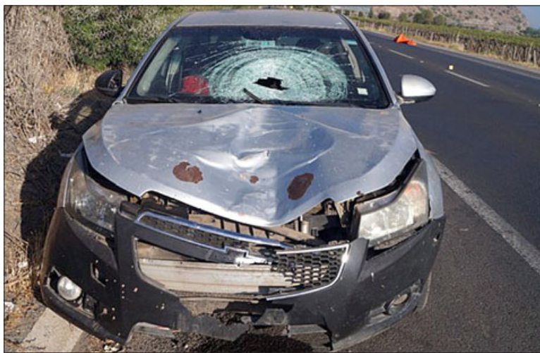
Con severos daños resultó el vehículo tras impactar al peatón.

Señalar que hasta el cierre de esta edición, desde Carabineros informaron que aún no han logrado identificar al fallecido. Es más, se hizo el encargo a todas las unidades de la provincia a fin de comunicar si eventualmente alguien se acercaba a hacer una denuncia por presunta desgracia, pero aún no se tiene información.