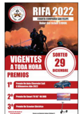
Este es el afiche promocional de la rifa donde aparecen los premios.

De todos modos hay que seguir comprando.