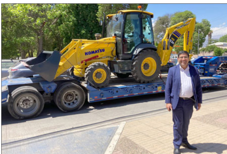
La retroexcavadora tuvo un costo de 90 millones de pesos y permitirá apoyar las labores diarias de los equipos municipales en terreno.