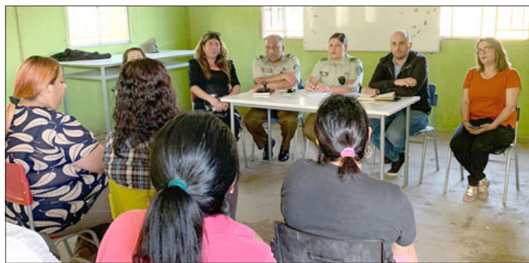
El parlamentario se reunió con vecinos y Carabineros de Llay Llay para responder inquietudes ante el incremento de la delincuencia.