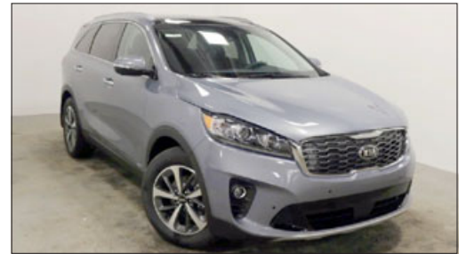
Un modelo similar al de la fotografía robaron seis delincuentes en un terreno en Tierras Blancas.