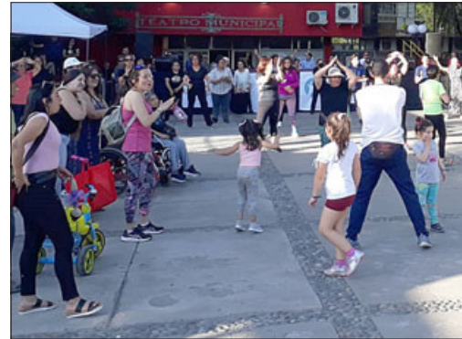
Baile entretenido en Plaza Cívica.