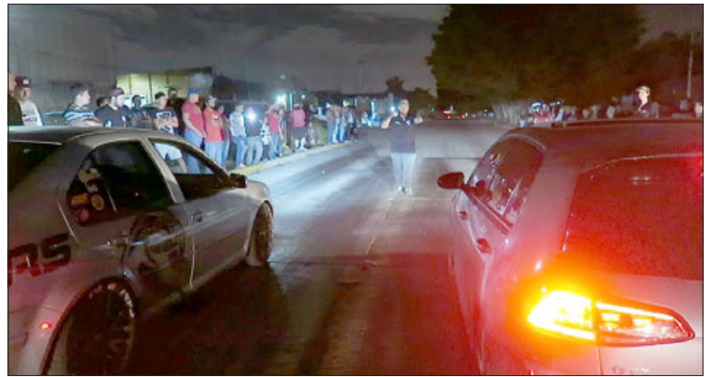
Vecinos han denunciado serie de carreras clandestinas en calle Tocornal. (Imagen referencial).

Finalmente, la alcaldesa Castillo manifestó que « nuestra comuna tiene que ser tranquila, amable y no arriesgando la vida, esto para nosotros es grave. No se puede correr a alta velocidad en ningún sector de la comuna. ».