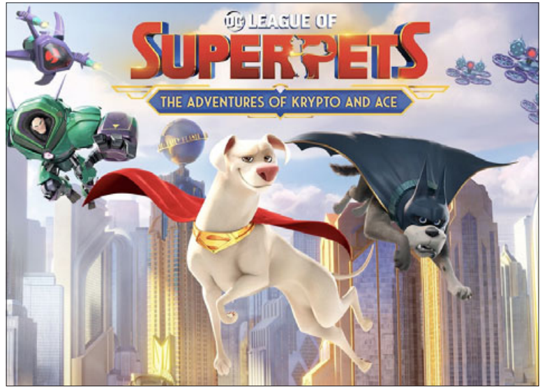
La cartelera del Teatro Municipal para noviembre trae el cine familiar con películas como Jurassic World , Los Minions y Supermascotas .