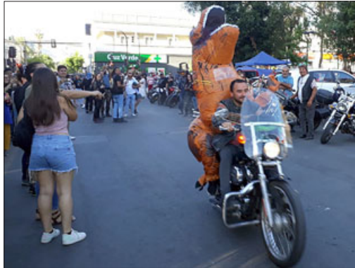
Hasta un dinosaurio fue paseado en moto.

Vimos también a integrantes de grupos de Scouts, mientras que en la plaza cívica pudimos apreciar la realización de baile entretenido.