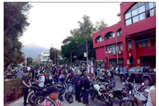
Así estaba este día sábado calle Salinas, repleta de gente.