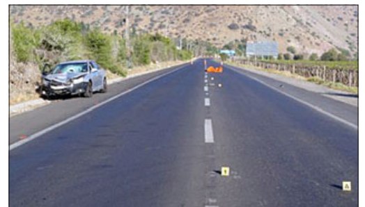
La tragedia se desató la madrugada del sábado en la ruta Troncal 601, sector puente Pocuro.

dimiento de rigor, el conductor fue detenido por su responsabilidad en el atropello que termina con la vida del peatón.