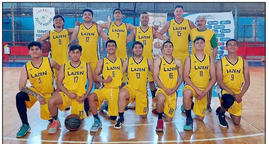
El Lazen es el líder de la serie de oro de la ABAR.