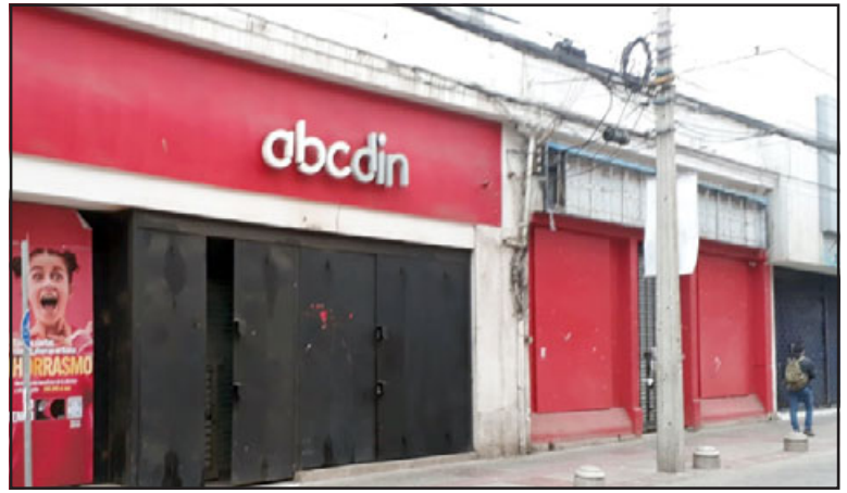
Frontis de la tienda ABCDIN en San Felipe.