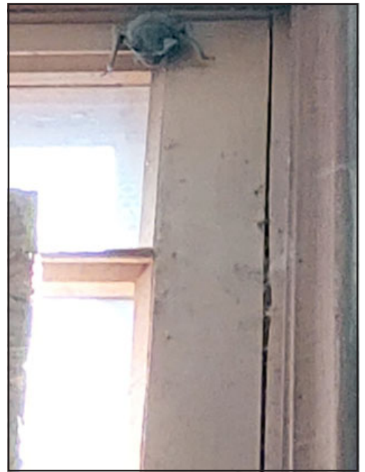
Vecinos del sector nos hicieron llegar esta imagen que da cuenta de la presencia de murciélagos, los cuales no constituirían una 'plaga' sino simplemente una 'colonia', según la Autoridad Sanitaria, y donde hasta ahora no se ha encontrado el virus de la rabia.