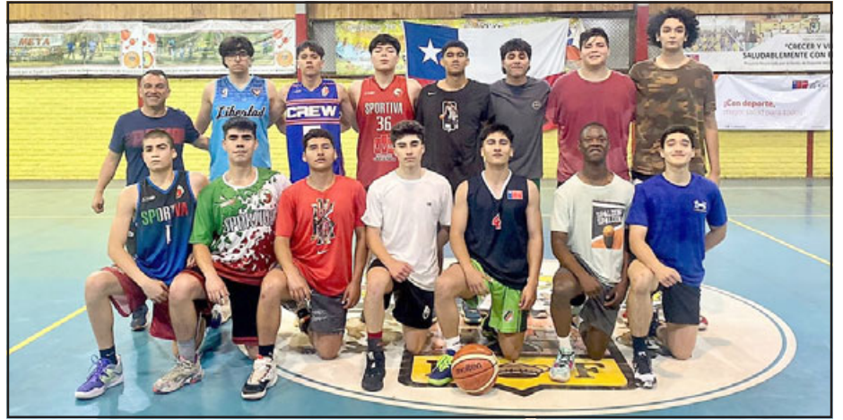
Selección que sacará la cara por la Quinta Región en los Binacionales de San Luis.