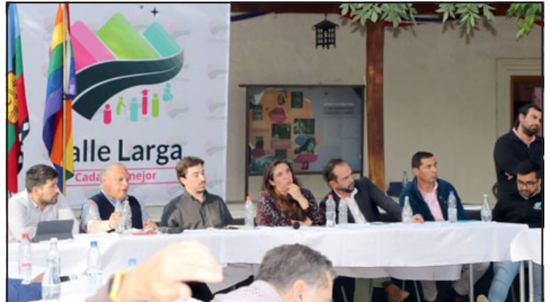
Sin acuerdos concretos finalizó reunión de alcaldes de Aconcagua junto al Gobernador Regional, Rodrigo Mundaca.

«Hay una voluntad de poner a disposición todas nuestras capacidades, conocimiento y experiencia para resolver un problema tan importante para la vida de todos y todas como es el agua, y no sólo para el consumo humano, sino que para la producción de alimen-