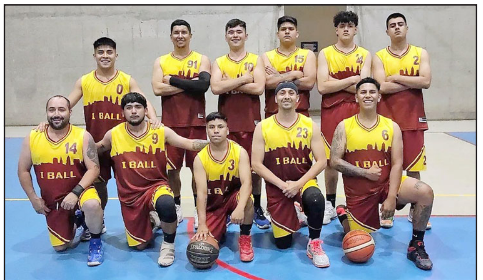
Iball es un serio candidato al título en el torneo de ascenso de la ABAR.