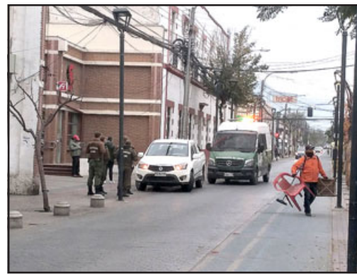
El municipio, en coordinación con Carabineros, ha llevado a cabo un nuevo 'copamiento' para impedir la instalación del comercio ambulante en el centro.

Sobre todo teniendo en cuenta la proximidad de fechas importantes como lo es navidad y