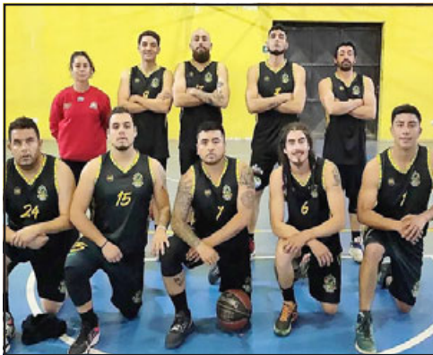
Le Bajon juega en la serie A de la ABAR.

15:00 Putaendo Basket – Iball 17:00 Mixto – Sonic 19:00 Prat B – Calle Larga Basket