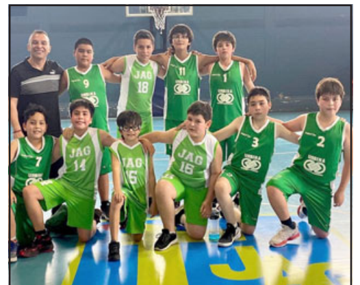
Representativo del colegio José Agustín Gómez.

Esta tarde en las dependencias del Instituto Abdón Cifuentes, el baloncesto infantil vivirá una verdadera fiesta deportiva que se enmarcará en el Encuentro U12 'Orgullo de Aconcagua', evento en el que intervendrán quintetos femeninos y masculinos de la zona.