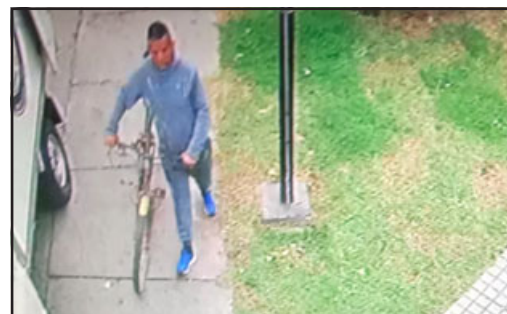
El sujeto a quien acusa el dueño de 'Huertos de Aconcagua', de haberle robado 300 mil pesos este miércoles en la mañana.

- Yo no entablé denuncia la verdad porque no es necesario, porque Carabineros hoy en día, como te lo mencioné antes, hay que llevarse lo prácticamente a domicilio, pero está identifica-