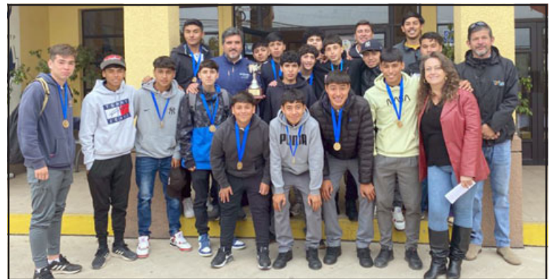
Estudiantes derrotaron a sus similares del Instituto Chacabuco de Los Andes y la Escuela Pedro Aguirre Cerda de Calle Larga.