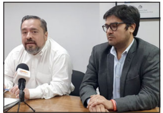
Autoridad Sanitaria de Aconcagua y Municipio de San Felipe anunciaron fiscalización en la feria de Diego de Almagro para este domingo.

«Queremos dar una respuesta a una necesidad muy sentida de los vecinos de la fe-