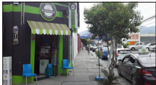
Este es el local 'Huertos de Aconcagua', cuyo dueño fue víctima de la delincuencia el miércoles en la mañana.

- De la persona que te robó, ¿puedes dar algún indicio de la identidad? - Él tiene un corte muy particular de pelo, vestía ese día de color azul con unas zapatillas azules muy fuertes, se desplaza en bicicleta porque esa es la manera que tiene de arrancar, una bicicleta color amarillo, tengo el nombre también, sé dónde vive, es un delincuente más, el cual ya muchos comerciantes también lo ubican porque hace un tiempo atrás, en la calle Prat hizo también de las suyas abriendo autos, es cliente habitual.