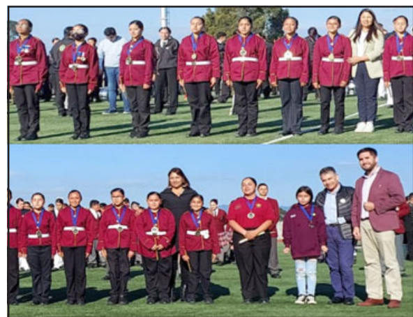
Tanto en San Carlos como en Arauco la Banda de Panquehue obtuvo el primer lugar en categoría Enseñanza Básica, logro importante considerando el nivel que hubo de otras bandas.

Agregó Chacón que en la localidad de Arauco lo conseguido tiene doble mérito, ya que se compitió en nivel de media con chicos de básica y así se obtuvo un merecido cuarto lugar; «para nosotros lograr un premio en enseñanza media es súper importante, ya que el 85 por ciento de nuestros alumnos son de enseñanza básica, y competir en una categoría más alta y lograr un premio, para nosotros es súper gratificante porque significa que estamos haciendo bien las cosas».