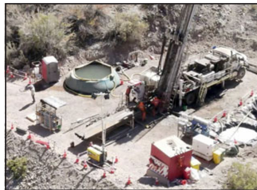
El Tribunal Ambiental ordenó a Vizcachitas realizar un Plan de Recuperación, Conservación y Gestión (Plan RECOGE) que proteja al gato andino, especie que actualmente se encuentra en peligro de extinción.