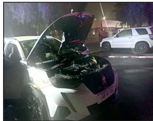
Así quedó el automóvil de la enfermera luego de ser incendiado por un sujeto que hoy está en prisión preventiva, pero que la víctima asegura fue enviado por su ex pareja.

En ese momento el abogado de la víctima B.D.G.V. , manifestó al magistrado que su representante quería señalar algo respecto al hecho investigado. Ese día la afectada señaló que había recibido amenazas de su ex pareja; «amenazas de muerte y amenazas destructivas de destruir mis cosas, enviar gente a mi trabajo, amenazas que ya se han ido cumpliendo, está la constancia que ya han venido personas a mi