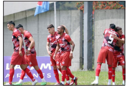
Los sanfelipeños deberán ganar por al menos dos goles para avanzar de fase en la Liguilla.