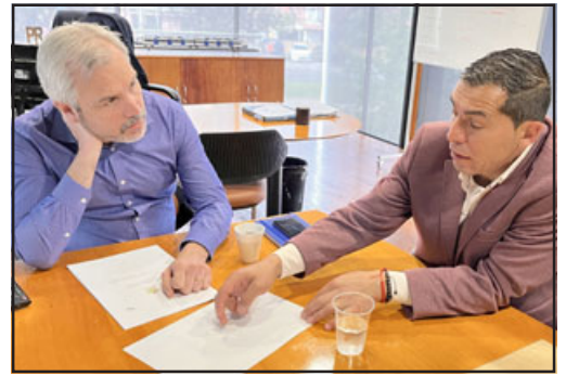
Alcalde de Panquehue se reunió con gerente de la empresa y planteó además la necesidad de hacer mejoras en el atraveso férreo de calle Antofagasta hacia Viña Errázuriz y en Escorial para reorientar el trazado de la ciclovia.

Vergara, al término del encuentro, afirmó que es muy gratificante cuando autoridades regionales manifiestan su voluntad de apoyar las iniciativas que les son planteadas. Destacó que si bien las comunas más pequeñas deben hacer un doble esfuerzo, aclaró que en el caso de Panquehue, se está insistiendo en la necesidad de avanzar en mejoras y concretar iniciativas que han estado poster-