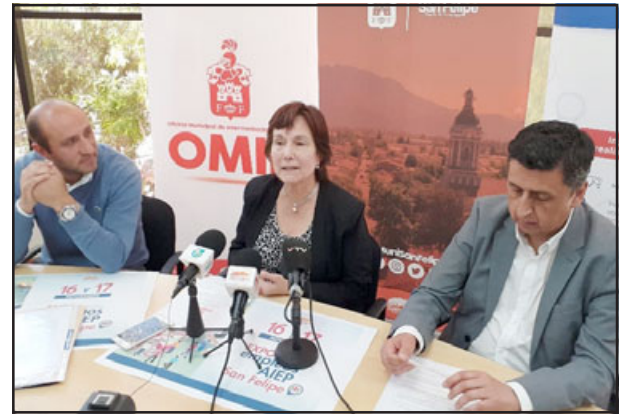
AIEP y Municipio de San Felipe lanzaron la 'Expo Empleos' 2022.