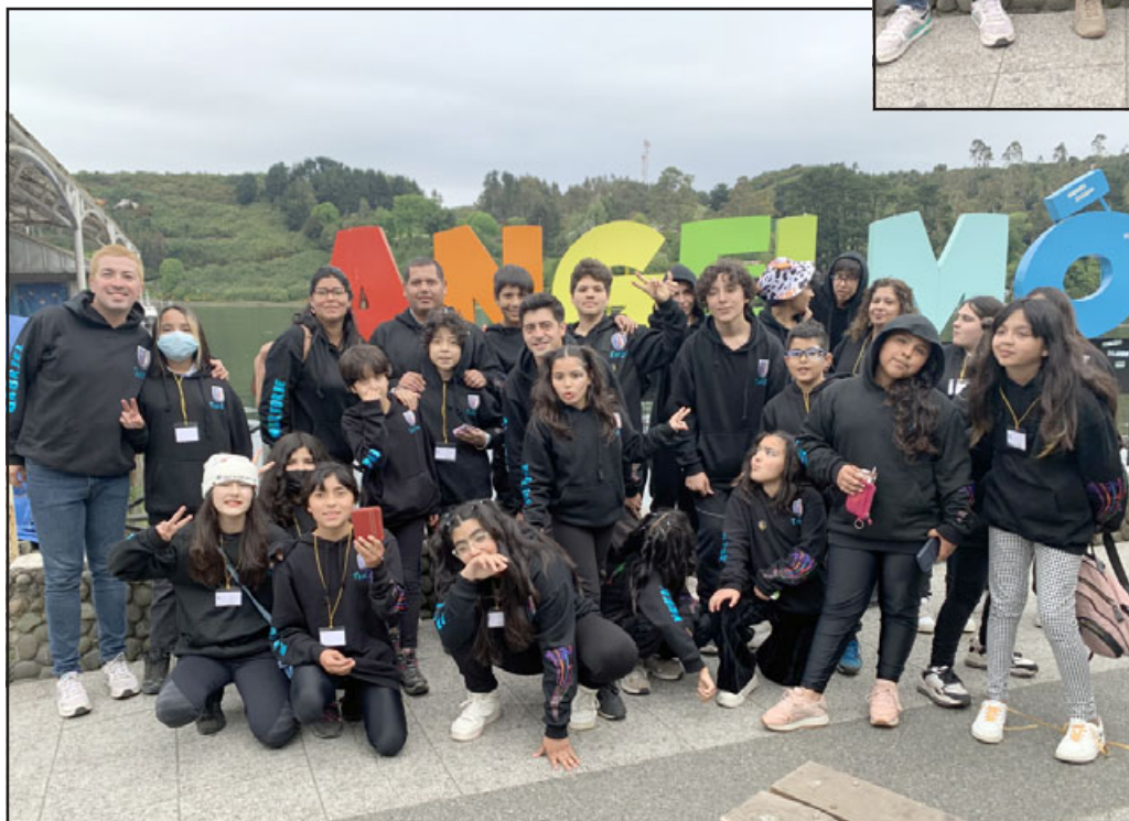
La delegación sanfelipeña estuvo compuesta por 23 estudiantes y 6 profesores.