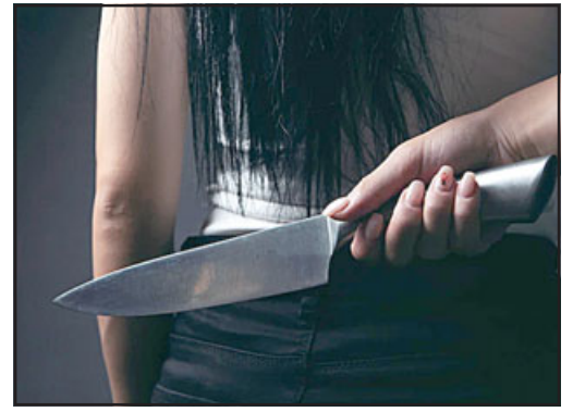
Con un arma blanca menor de 13 años agredió a otra menor de 14 años en Curimón. (Imagen referencial).