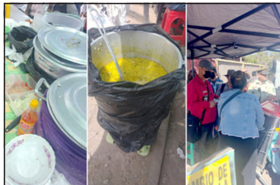
La tradicional feria se ha visto invadida por un importante grupo de cocinerías clandestinas y comercios ilegales que afectan a residentes de los sectores aledaños a la feria.