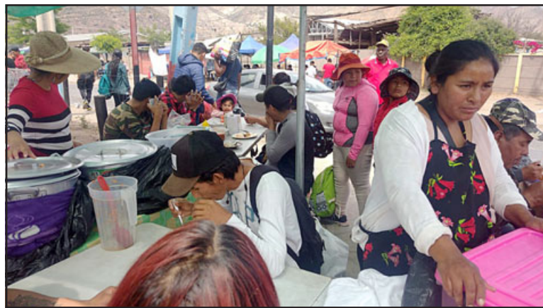
Este domingo se realizó la primera fiscalización al comercio irregular de la Feria Diego de Almagro, ocasión en la que se cursaron 12 infracciones.

12 infracciones a personas que no contaban con permiso municipal y a las cocinerías también, debido a que ellos no cuentan con resolución sanitaria que los habilite para vender alimentos en la vía pública, actividad que se encuentra prohibi-