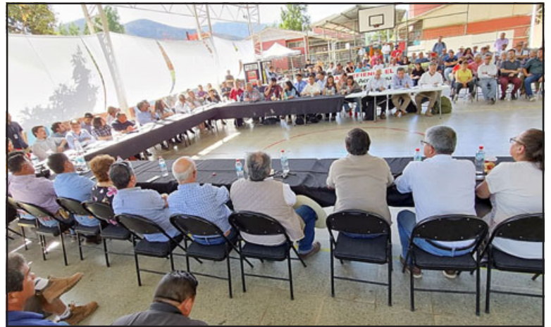
Continúa sesionando la Mesa del Agua en el Valle de Aconcagua.

5. Las aguas subterráneas, que al menos en el caso de la Segunda sección, es-