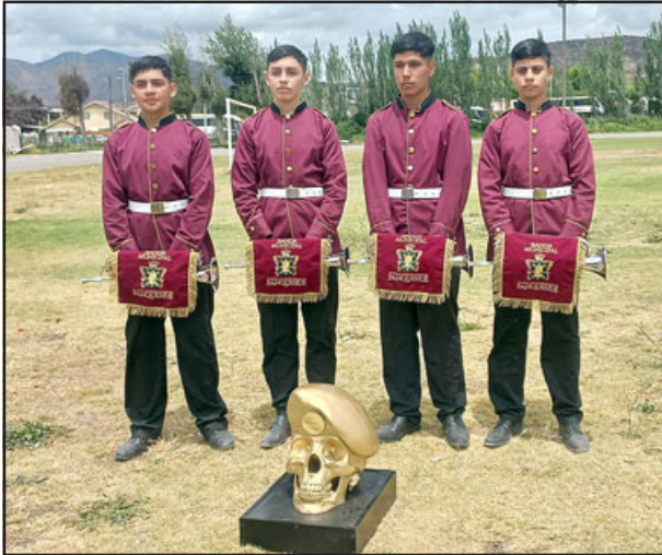
La Banda de Panquehue demostró un nivel de preparación, logrando el primer lugar en la modalidad de básica, además de los premios individuales en toque de atención y en tambor mayor.