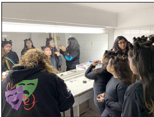
Los nóveles actores y actrices durante el maquillaje previo a salir a escena.