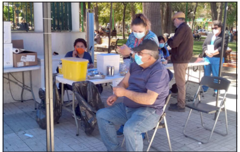
Alrededor de 150 personas se han vacunado contra el Covid 19 en el punto ubicado en la Plaza de Armas de nuestra ciudad.

«Hoy comenzamos con este punto de vacunación Covid para dar cumplimiento con el proceso de vacunación con la quinta dosis que partimos hace algunas semanas, comenzamos con los mayores de 60 años y mayores de 12 años con enfermedades crónicas, por eso invitamos a toda la comunidad a este punto de vacunación que se