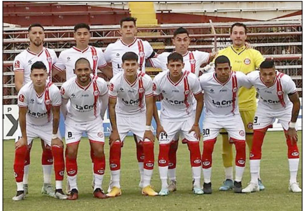
Para muchos el partido del viernes pasado fue el último con la divisa del Uní Uní.

De los demás, es poco lo que se puede decir, y es que éstos al