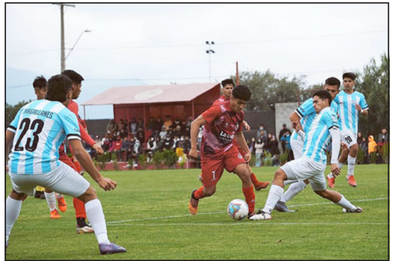
Unión San Felipe en uno de los partidos de la fase regular en la serie de Proyección.

En el final de la conversación el entrenador mostró su confianza respecto a que varios de sus jugadores podrán dar el salto al equipo profesional: «Hay materia prima, varios pueden dar ese salto, sólo se trata que los jóvenes tengan la capacidad de adaptarse a una exigencia mayor