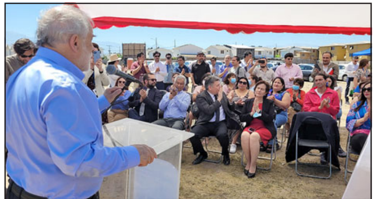
La actividad tuvo lugar en el mismo sector poniente de nuestra ciudad, al final de la Villa Santa Teresa.