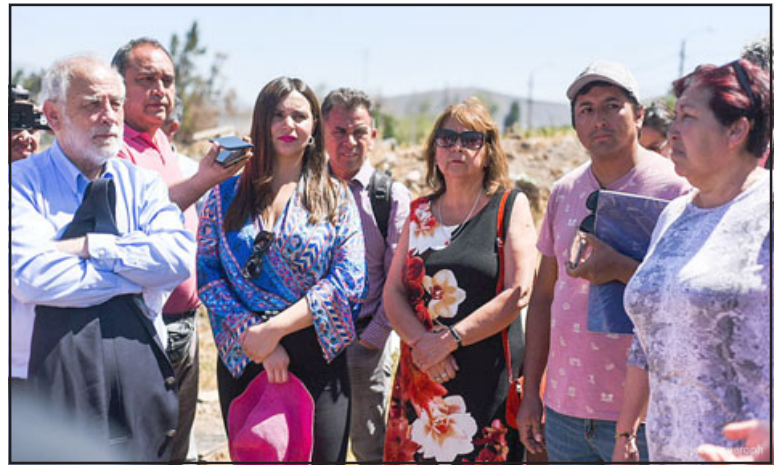
Vecinos cercanos a la toma de terreno en San Felipe plantearon la necesidad de soluciones al Ministro de Vivienda y Urbanismo, Carlos Montes. (Imagen gentileza Jorge Ampuero).

La misma mujer agregó que a raíz de la toma, «estamos llenos de plagas de moscos, hay balaceras, no nos dejan dormir, garrapatas, cucarachas, chinches, ratones y caca. Nosotros antes que cerráramos la pasada a los vecinos nos dejaban para poder ser escuchados, vamos a verlo que pedimos, colindamos con la toma,