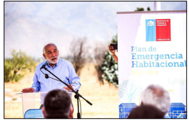
Ministro de Vivienda y Urbanismo, Carlos Montes, dio a conocer el inicio del proceso de compra del terreno. (Imagen gentileza Jorge Ampuero).

Finalmente, la alcaldesa Carmen Castillo manifestó que este inicio del proceso de compra significa una gran solución habitacional para la comuna. «Una alegría enorme de tener esta solución habita-