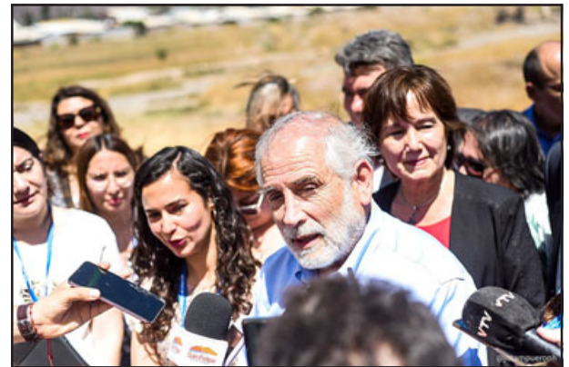
Autoridades y la comunidad estuvieron presentes en este hito. (Imagen gentileza Jorge Ampuero).

para definir a las familias, la edil aseguró que «se va a regular y será transparente, tenemos una mesa de vivienda la que está trabajando para establecer las reglas del juego con la Seremi para transparentar el proceso, porque hay mucha inquietud y ansiedad. Paciencia porque todos podrán acceder a la vivienda digna, se está proyectando inicialmente a lo menos con 1.600 viviendas, pero puede ser que accedan más comités de vivienda».