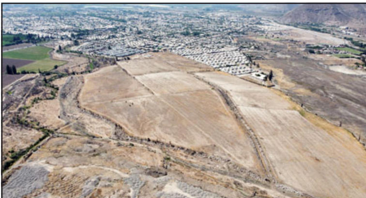
La vista aérea muestra el terreno de grandes dimensiones que se busca comprar para destinarlo a soluciones de vivienda.