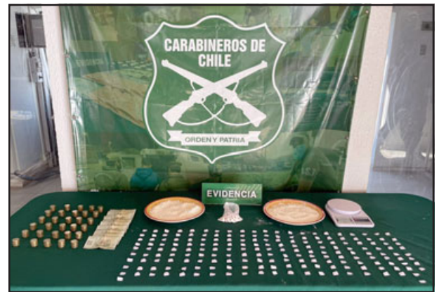
Más de tres mil dosis de pasta base de cocaína decomisó el OS7 de Carabineros a boliviana que traficaba en los departamentos Encón.

que «la investigación, conjunta con el Ministerio Público que se mantenía, es que esta ciudadana se estaba dedicando a la venta de drogas en su departamento, motivo por el cual se pudo acreditar el delito, gestionando una orden de entrada y registro en el departamento ubicado en el block A, donde se detuvo a esta persona y se incautaron más de 280 gramos de pasta base de cocaína, dinero en efectivo y especies asociadas