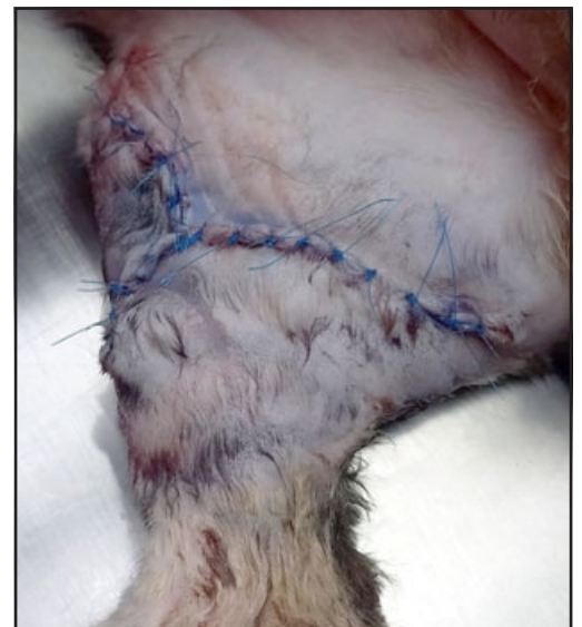
Una vez curada la grave lesión, se puede apreciar la gran cantidad de puntos que recibió.

- Yo llamé a los carabinieri y no me dieron solución porque me pedían evidencias.