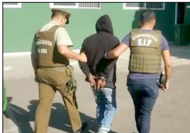
El imputado por recepción siendo trasladado al cuartel de Carabineros de San Felipe.

momento dijeron, respecto a las características del vehículo, que sería color mostaza o dorado.