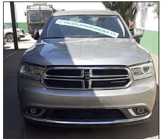
Este es el vehículo incautado por Carabineros de San Felipe y que estaría vinculado al asalto en contra de los dueños del Club Aconcagua, donde se robaron dos millones de pesos.

Cabe recordar que el asalto a los dueños del Club Aconcagua se produjo este viernes a eso de las 05:10 horas, en calle 5 de Abril llegando a Cajales, a metros de su casa, cuando las víctimas regresaban después de trabajar toda la noche. En la ocasión le robaron dos millones de pesos aproximadamente en