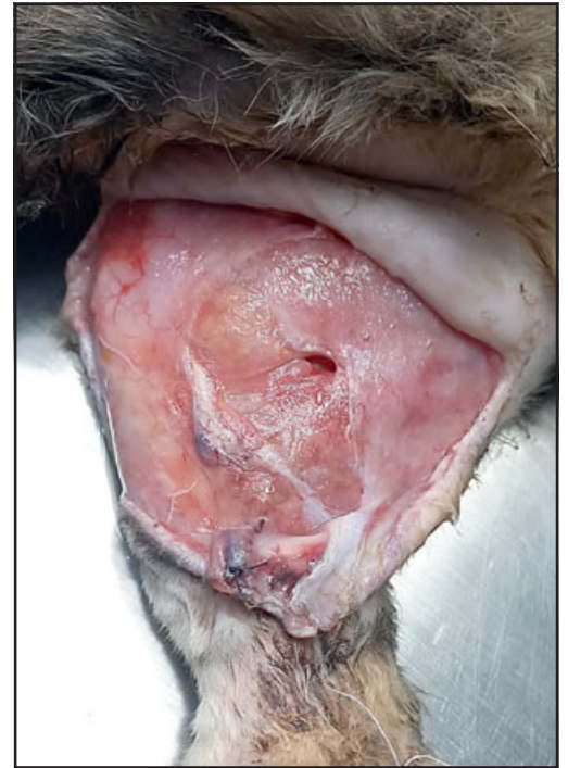
IMAGEN SENSIBLE.- La intervención por parte del médico para poder luego colocarle puntos.

- De las personas que hacen esto, ¿saben algo, hicieron la denuncia?