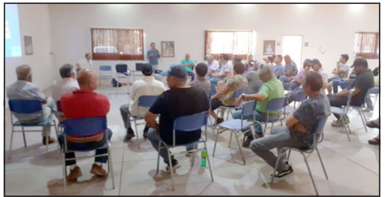
Dirigentes del canal Montenegro en reunión para abordar esta problemática.

mera sección a las otras secciones». Problemática que plantearon en la reunión con autoridades que se llevó a cabo en la comuna de Los Andes: «Hemos hecho una reunión informativa a los regantes del canal mostrando la historia, cómo se generaron los derechos, e instándolos a