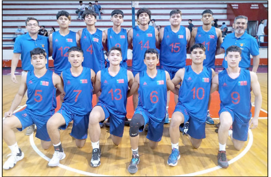
Una partida prometedora ha tenido la selección U-17 de la ABAR en el Nacional de Antofagasta.

Al cierre de la presente edición de El Trabajo Deportivo , la selección