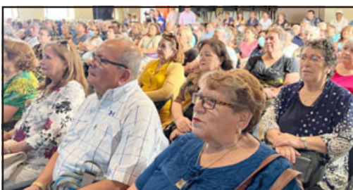
En total son 84 clubes vigentes los que recibieron este aporte de la Municipalidad de Los Andes.