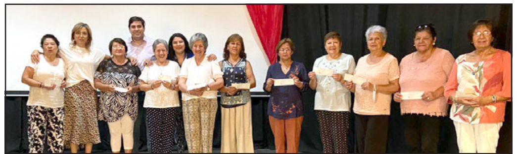
Parte de los beneficiados con la subvención para clubes de personas mayores.

lizó en el Centro Cultural, se hizo entrega de los $300.000 para cada organización.