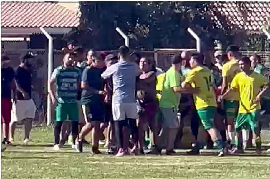
Estos incidentes obligaron a suspender el torneo 2022 de la Asociación de Fútbol de San Felipe.