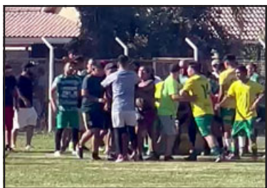
Incidentes obligaron a suspender el torneo 2022 de la Asociación local

Tras violentos incidentes del domingo recién pasado