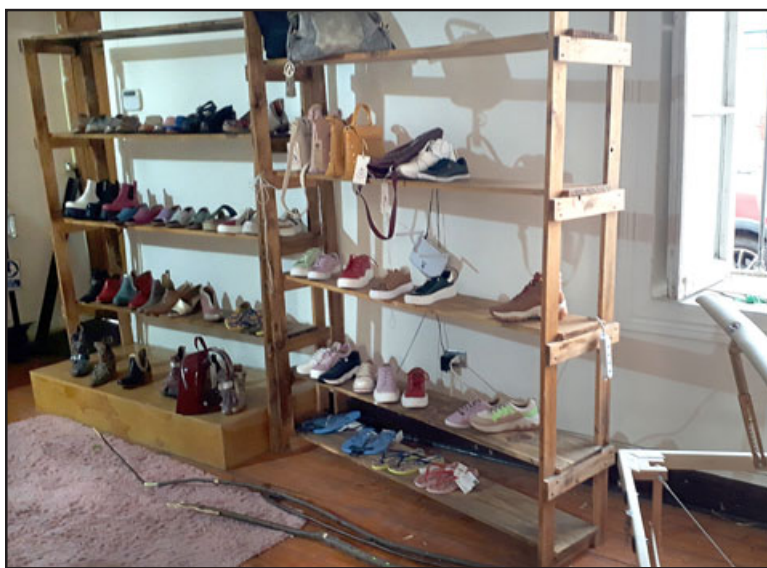
En esta repisa se encontraban las carteras que fueron robadas.

como seis carteras, ya no es nada ahora, pero nuevamente el daño de volver a reforzar, igual son lucas, aunque sean pocos, y ahora es como un daño psicológico donde yo digo, me voy a ir hoy día a mi casa y mañana voy a volver, ¿y voy a encontrar algo en mi tienda?