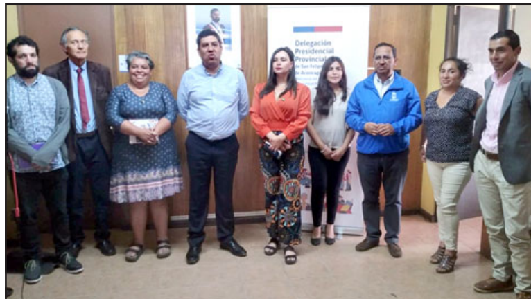
Seremi de Transportes se reúne con alcaldes de la provincia para coordinar locomoción para estudiantes.

Por su parte, la delegada Scarlett Valdés sostuvo que «todos tenemos conocimiento del déficit y los problemas de