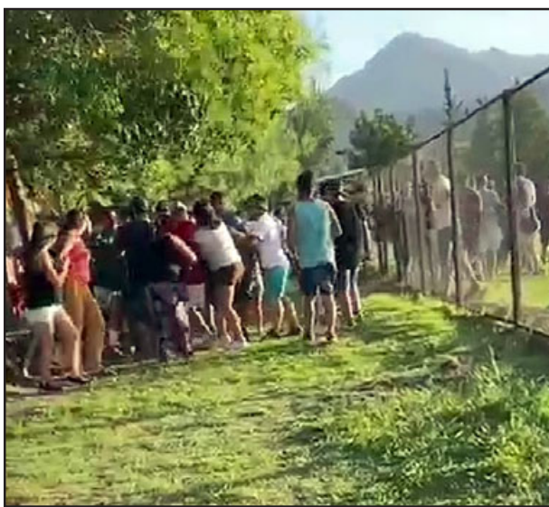
Barristas y fanáticos se unieron a la riña.