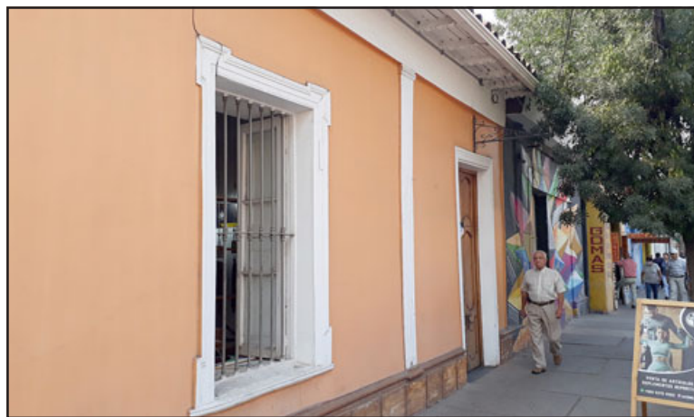
El frontis de la tienda ubicada en calle Coimas casi esquina Condell en San Felipe.

los videos, pero en realidad nunca me llaman de fiscalía... Tengo videos, tengo todo en realidad, ya no sé qué más hacer. ¿Cierro la tienda?, hay gente que me dice que coloque un cerco eléctrico y me meto en problemas yo. De verdad hoy día, si me pregun-