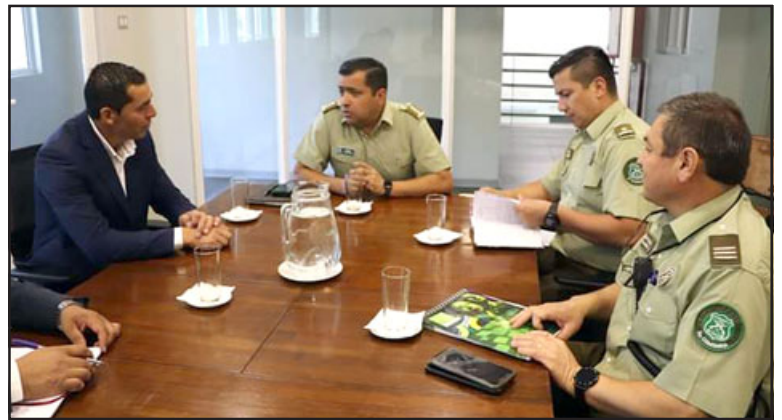
Carabineros y municipio de Panquehue coordinan proyecto de construcción de nuevo recinto policial.