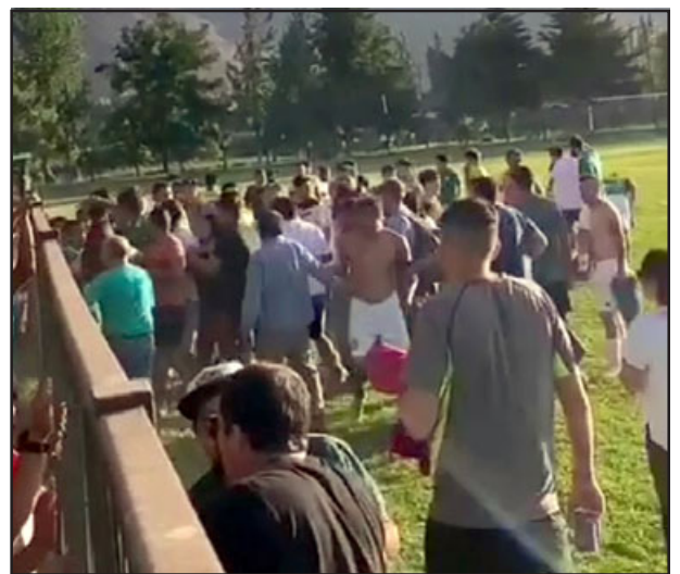
Jugadores y barristas enfrentados al interior del recinto deportivo.

Se pararon los dos partidos, pero después en la semana se jugó el resto que faltaba, entonces de qué estamos hablando también.