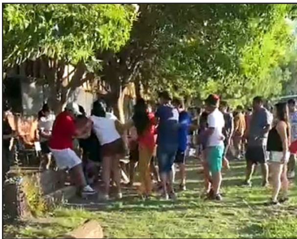
El violento episodio se trasladó a las gradas.