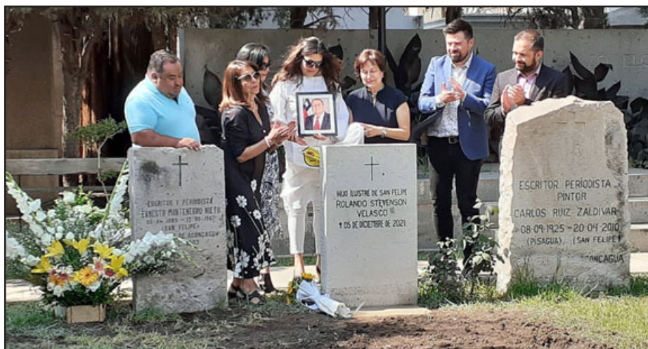
Familiares y autoridades presentes en la ceremonia en el cementerio municipal.