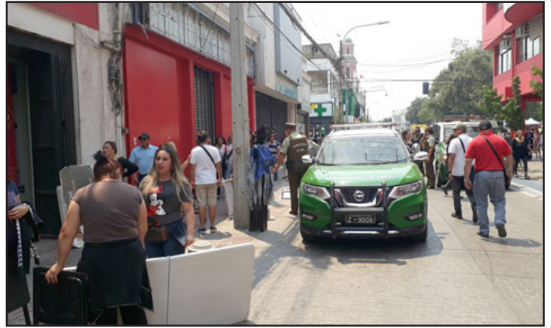
Carabineros presente en calle Prat para apaciguar los ánimos.

lo cual es una situación ilegal que ya está regulada, entró en vigencia a contar del 12 de febrero de este año con la ley 21.426 sobre el comercio ilícito. Ayer (jueves) ya se hizo el retiro de especies de un comerciante ambulante, lo que dio a consecuencia los hechos que se están suscitando el día de hoy con las manifestaciones, y ahora de igual forma al parecer de protesta quisieron instalarse en lo que viene siendo la línea de Prat entre calle Salinas y Traslaviña, lo cual nosotros tenemos de igual forma fiscalizar esta situación, no podemos permitir que estén