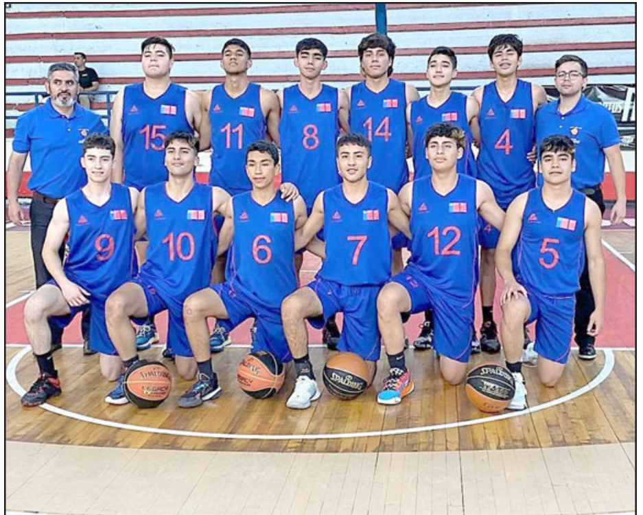
Un meritorio sexto lugar alcanzó la selección U17 de la ABAR en el Nacional Federado.

En tanto se confirmó que en el segundo semestre del próximo año habrá campeonatos de selecciones en las series adulta femenina, masculina y en la serie sub-17.