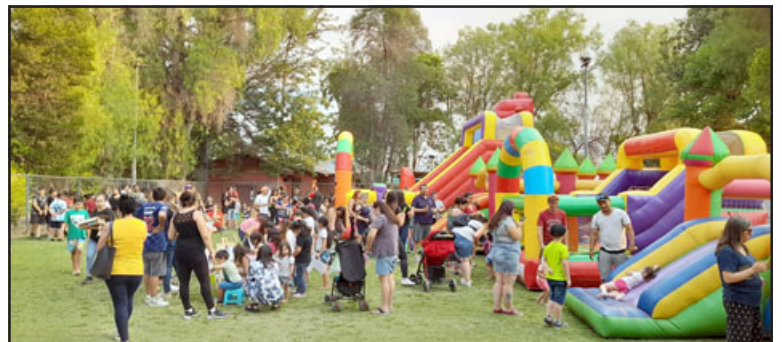
Sin lugar a dudas fue una gran tarde recreativa donde se contó con la comunidad que siempre apoya esta gran iniciativa.

Cabe destacar que la actividad es gratuita y la agrupación sólo pedía apoyo en agua embotellada para el ingreso al evento, con el objetivo de ir en apoyo de Bomberos de la comuna, lo cual fue todo un éxito.