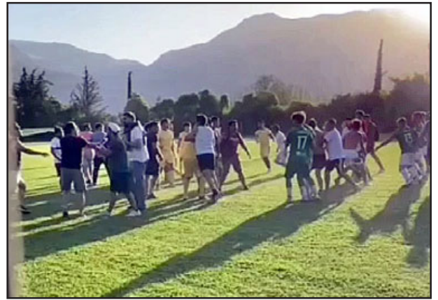
Imágenes de lo que fue el violento episodio en la cancha del Club Deportivo Bangu.

«Ahora, eso es lo que yo digo. Que pasen estas cosas, que peleen, lo sientan como normal, solamente porque si pagan la multa se siga jugando. Imagínes que en ese puro fin de semana se pagaron más de $700.000 (setecientos mil pesos) en multas. Hubo otro caso en otra cancha, que agredieron al árbitro dos veces, en dos series.