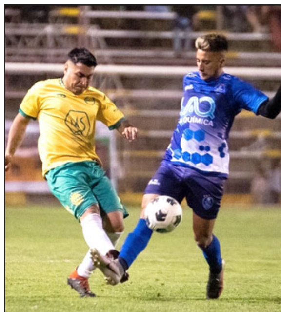
Con el aumento de cupos, muchos equipos aconcaüinos podrán incursionar en las Copas de Campeones Masculina y Femenina.