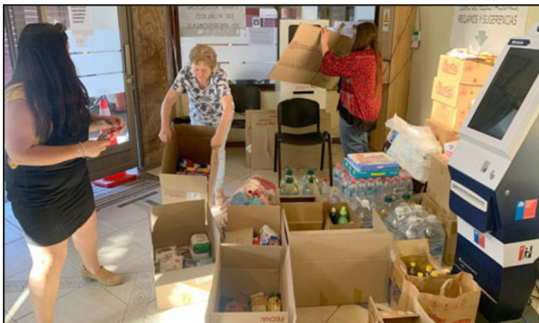
Esta semana debería realizarse la primera entrega de los elementos de primera necesidad para las familias viñamarinas que ha donado la comunidad.

mingo, así que también agradecerle a ellos que han destinado tiempo para unirse a esta campaña, sabemos lo trágico que ha sido todo esto, así que estamos a disposición», concluyó.