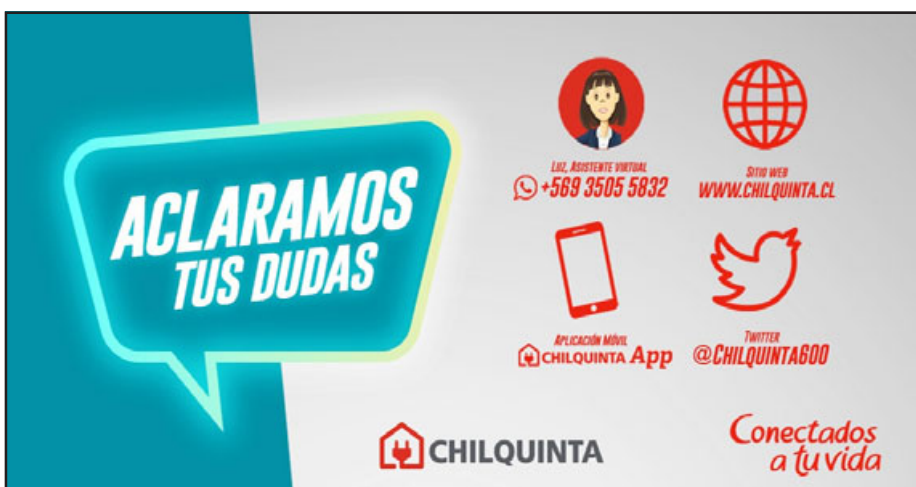
Canales de contacto de Chilquinta.