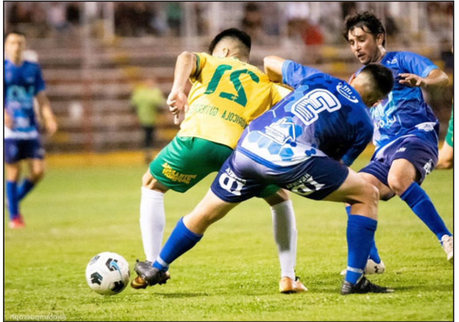
Juventud La Troya será el anfitrión de un gran evento deportivo.

Por su parte en la categoría de Honor o Primera, ya garantizaron su presencia: Dos Amigos, Húsares, Villa Minera Andina, Alfredo Riesco, Chagres, Unión Panquehue, Placilla (La Ligua), Estrella de Ocoa (Hijuelas), Alianza Curimón, Libertad de Algarrobal, Colunquén, Unión Parrales y Juventud La Troya.