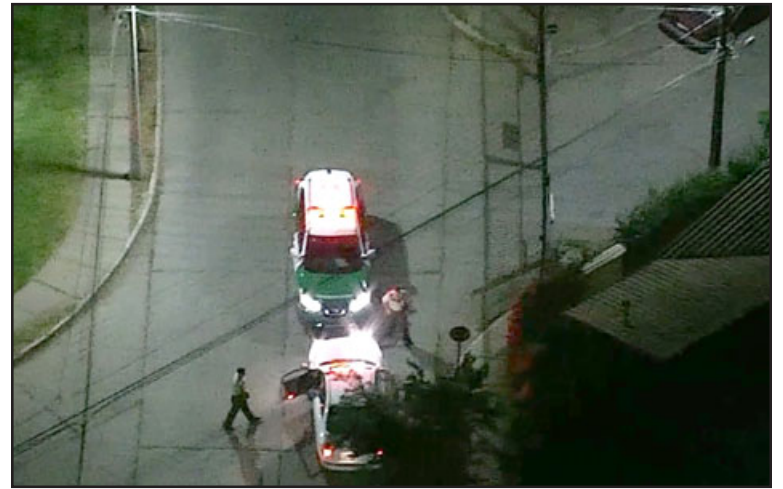
En la imagen el instante en que Carabineros procede a detener a los ocupantes del automóvil, quienes minutos antes fueron grabados por el mismo dron realizando una transacción.

«Entendemos que se ha dado cumplimiento y hemos dado una respuesta importante al comercio ambulante, se ha logrado erradicar en gran parte, hay ciertos focos que se mantuvieron, pero fueron oportu-