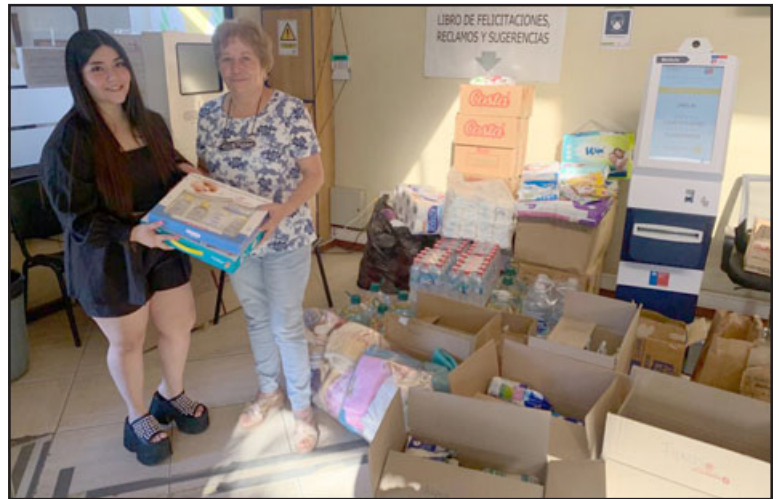
Hasta el primer piso del edificio de la Municipalidad de San Felipe podrán acudir también quienes deseen cooperar con esta campaña.

Según destacó la Dideco, el balance del acopio realizado el fin