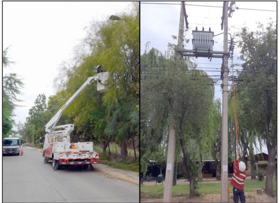
Personal de Chilquinta debió desplegarse por todo el valle de Aconcagua para responder a los estragos causados por las ráfagas de viento del domingo.

Los mecanismos de comunicación de que dispone la empresa Chilquinta, así como los tiempos de respuesta, fueron dos de los aspectos que criticó el administrador municipal, quien comentó que «sostendremos una reunión con la Delegación Presidencial Provincial a objeto de manifestar la preocupación de nuestros vecinos y vecinas en cuanto a la tardanza y la forma de respuesta que tiene la empresa distribuidora de