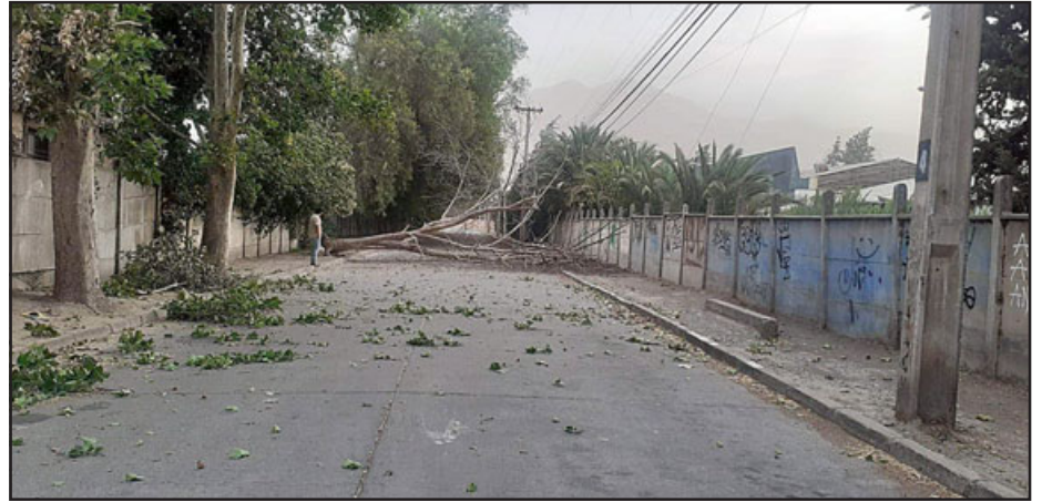
Caidas de árboles se registraron en varios puntos de la ciudad.