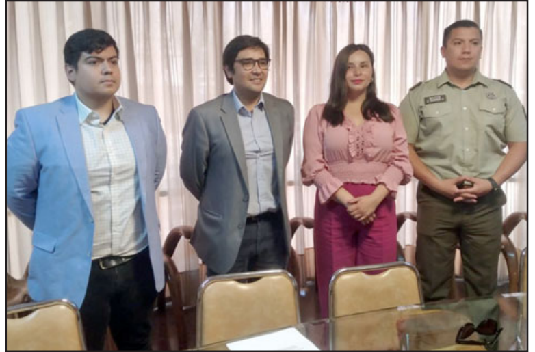
DPP, Carabineros y municipio entregando el balance del plan 'Navidad Segura' en San Felipe.