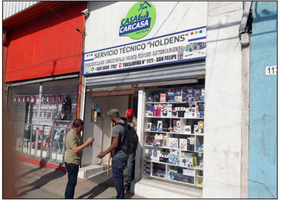
En este local robaron delincuentes durante la noche de ayer; hay un detenido.

- ¿Cómo ingresan los sujetos rompieron, la ventana, algo?