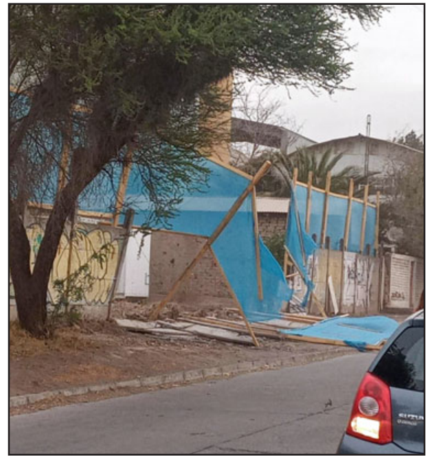
Hasta una pandereta cayó a raíz del fuerte viento.

Asimismo, el edil (s) precisó en el llamado a los vecinos a tomar contacto por los números de emergencia dispuestos en la página web del municipio para alertar de alguna situación, «es importante que la gente realice los llamados a nuestros números de emergencia para destinar los recursos a esos sectores, ha existido una gran demanda y se van abordando los puntos a partir de la envergadura del momento, estamos en labores de despeje en la actualidad», señaló.