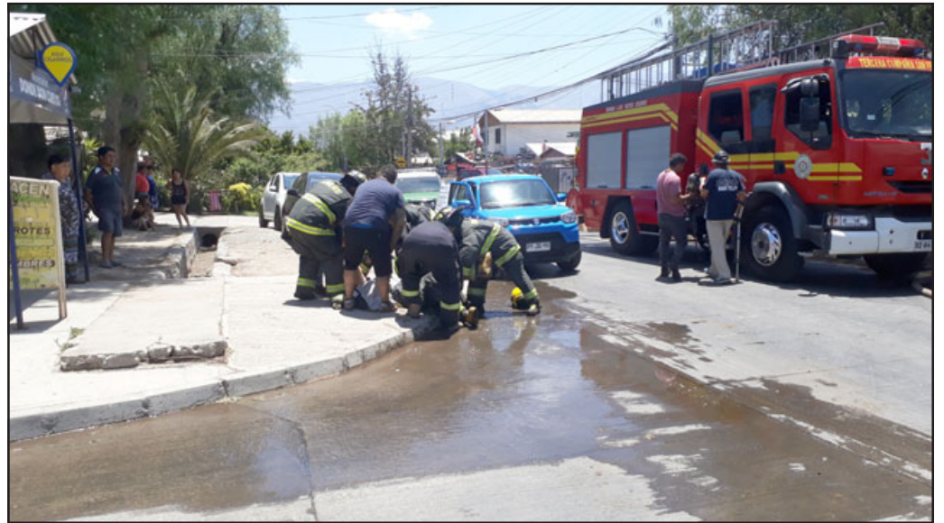
Personal de Bomberos asistiendo a un compañero que sufrió fatiga por el arduo trabajo con equipos pesados que tuvo que realizar en el techo de la vivienda.

- Efectivamente hubo fuego. Atrás hay un agregado que se quemó en su totalidad. La casa principal tiene daños, vuelvo a insistir, en un 80%, son daños bastantes considerados, se va a investigar por qué se produjo este incendio. En este momento está trabajando personal de Bomberos para ver la causa