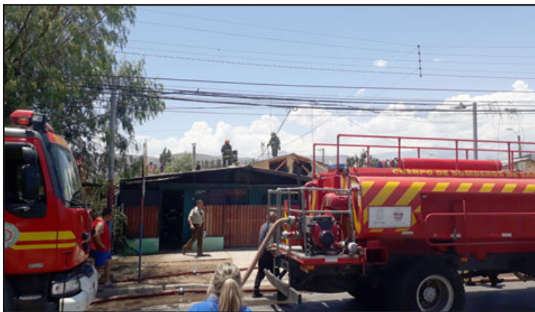
Una vez finalizada la emergencia, personal de Bomberos recorre el techo de las viviendas afectadas revisando antes de retirarse.