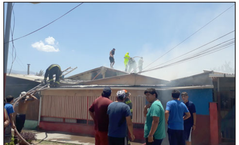
Bomberos y vecinos sobre el techo ayudando a combatir el fuego.