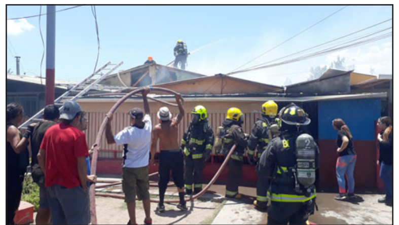
Vecinos ayudan a sostener una de las mangueras como una forma de colaborar con Bomberos.

Las causas del siniestro deberán ser investigadas por el Departamento Técnico de Bomberos.