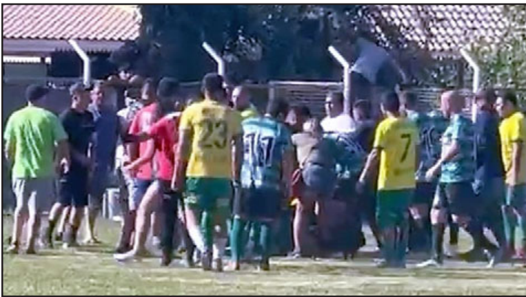
Estos hechos provocaron que el Consejo de Presidentes votara mayoritariamente el fin anticipado del torneo 2022.

También se acordó que este 2022 no tendrá campeones y que solo se otorgarán los respectivos cupos a la Copa de Campeones y los torneos de verano como el Afava y el 'Amor a la Camiseta'.