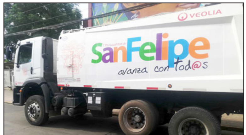
Mañana sábado la recolección de basura partirá a las 16:00 horas.