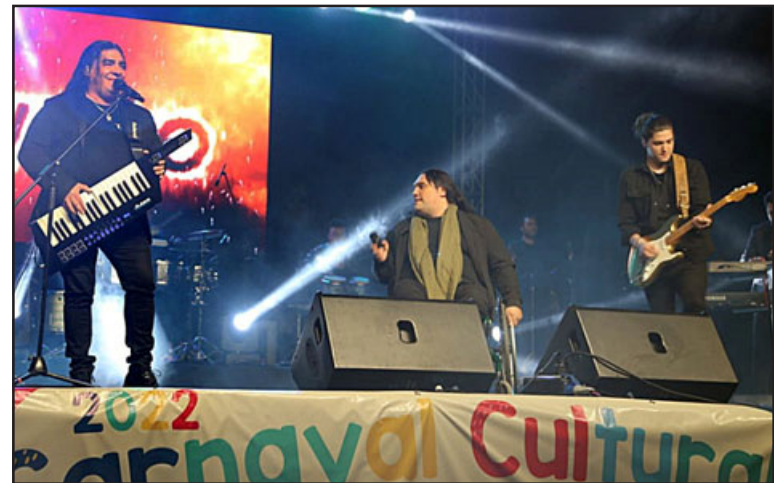
La agrupación musical 'Garras de Amor' hizo bailar a los 10 mil espectadores hasta altas horas de la noche.

Este carnaval fue posible realizarlo gracias a los fondos del 7% del Gobierno Regional de Valparaíso, año 2022.