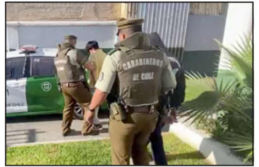
Los imputados siendo subidos a carro policial para ser trasladados a control de detención.

Al margen del procedimiento anterior, el teniente Boris González se refirió al caso de un sujeto conocido como ‘El Chi-