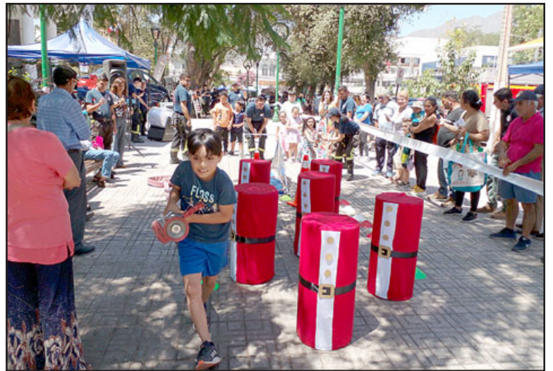
Actividades para niños y adultos en la antesala del sorteo de premios.