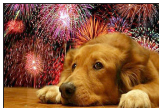
Las mascotas suelen asustarse con los fuegos artificiales, sobre todo cuando están muy cerca del lugar de detonación y el sonido es mayor.