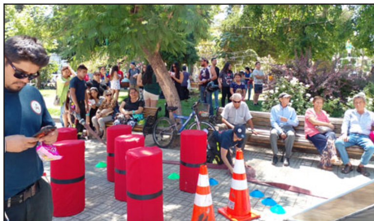
Un centenar de personas estuvo presente en el sorteo de la 4ª Compañía de Bomberos.