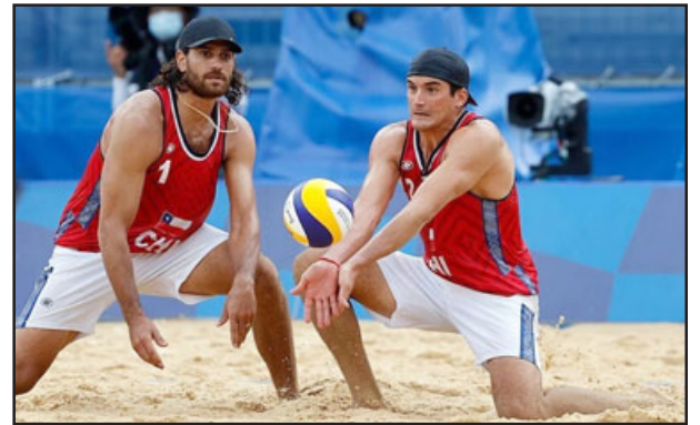
Marco y Esteban Grimalt fueron elegidos los mejores deportistas chilenos de este 2022.