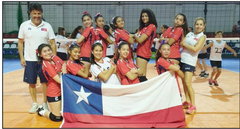
La selección femenina del colegio Cordillera fue tercera en el Sudamericano de Paraguay.