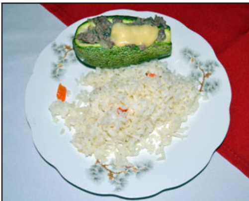
La cena navideña consistió en arroz con zapallos rellenos, acompañado de ensalada de choco y lechuga.