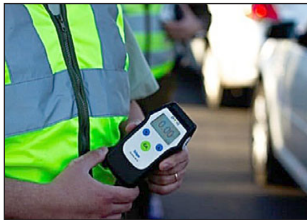
Mujer fue detenida por conducir en estado de ebriedad. (Imagen referencial).