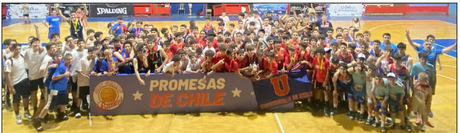
El 'Promesas' fue una fiesta deportiva que reunió a las futuras figuras del baloncesto chileno.