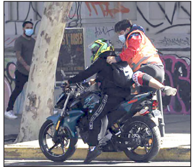
Dos sujetos en una moto color rojo asaltaron a la joven a las 7,30 de la mañana. (Imagen referencial)

Con respecto a si se realizó la denuncia correspondiente en Carabineros, el padre de la joven sostuvo que comparte la apreciación de que hay que hacer las denuncias para