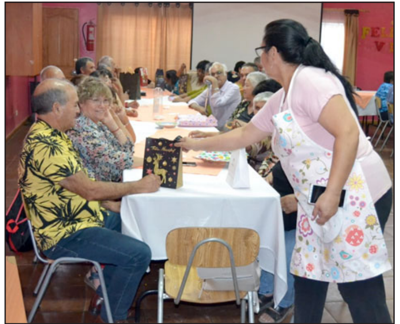
Fueron 47 cenas navideñas las que se sirvieron a los presentes y otras 63 entregadas a domicilio.