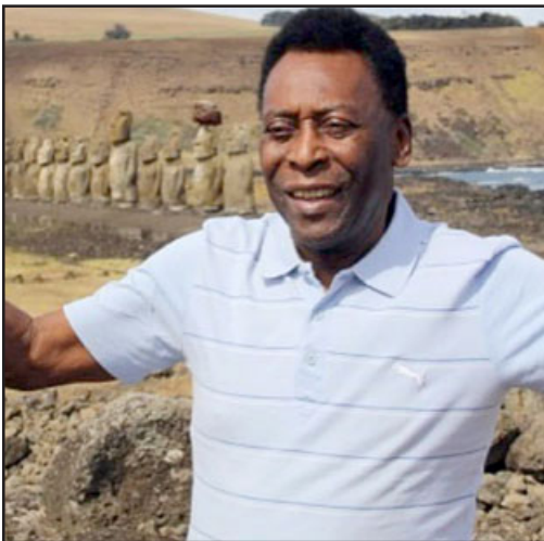
En su paso por la Isla, Pelé visitó Rano Raraku, lugar donde está la cantera donde se esculpían los moais.