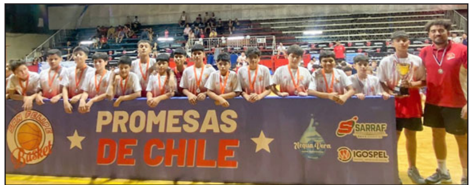
San Felipe Basket fue un digno anfitrión al estar dentro de los mejores de cada serie. En la imagen su equipo U 13.