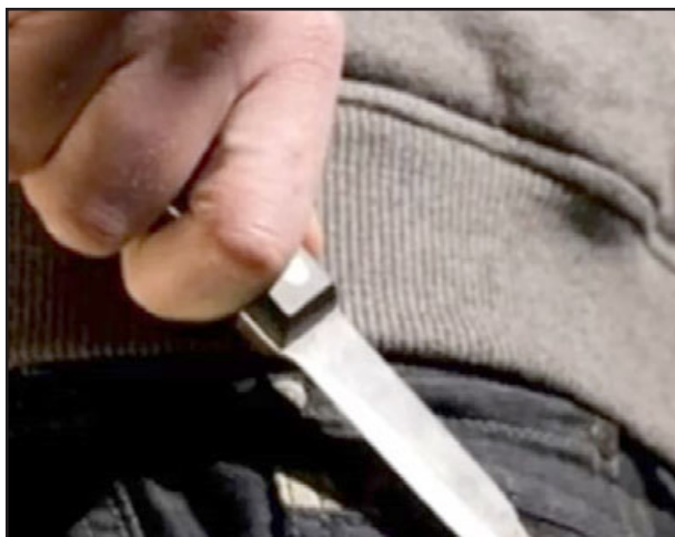
Una mujer fue detenida tras agredir a otra con un arma blanca. (Imagen referencial).

quien fue detenida por conducir en estado de ebriedad. Su acompañante también estaba en las mismas condiciones etilínicas.