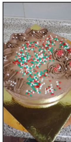
La torta navideña con la que se cerró esta entrega de cenas a las personas mayores.