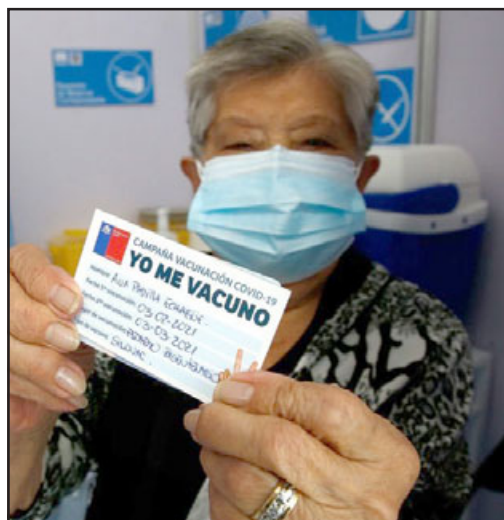
El llamado es a completar los esquemas de vacunación, tanto el primario como también con la dosis bivalente que se está administrando en la actualidad.

Asimismo, el jefe de la Autoridad Sanitaria de Aconcagua indicó que «Chile tiene turismo, hay circulación viral y estas decisiones tienen que ser tomadas con to-