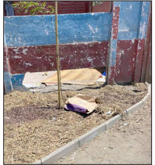
Acá uno de los árboles que el temido sujeto habría arrancado en cuanto volvió al lugar.

Ahora que la alcaldesa volvió de sus vacaciones, le piden que se preocupe de esta situación que tiene aterrizados a vecinos del sector poniendo: «Como te digo, lo único que queremos es que lo saquen a él; no le encontraron nada, pero sí está mal. Hay que ir un día a