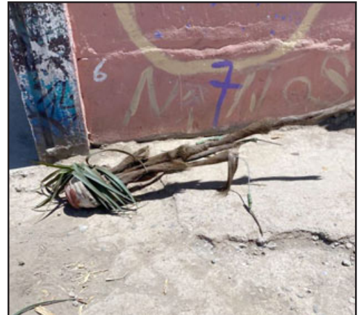
Poco a poco el 'Joto' ha vuelto a alterar la vida de los vecinos llevando basura al lugar.

poner, a quedarse en la población El Esfuerzo para que viva lo que está viviendo la gente hoy en día, y hoy día con más temor porque este tipo vino con ira contra la gente. Que por qué lo habían encerrado, gritándole garabatos, insultando a las mujeres, que ustedes 'viejas tal por cual que me encerraron y esto es mío y me voy a volver a poner acá'. Entonces imagínense toda la noche escuchando eso».