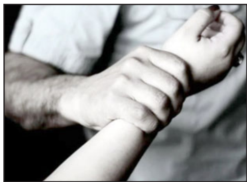
Un sujeto fue detenido acusado del delito de violación. (Imagen referencial).

Respecto de las agresiones que habría sufrido el detenido por parte de vecinos, quienes al enterarse de los hechos intentaron hacer justicia por sus propias manos, el capitán Guzmán sostuvo que «un grupo de vecinos, al momento de