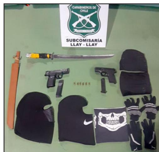
Estos son los elementos para cometer delitos que portaban los cuatro delincuentes.

Cabe destacar que todos los aprehendidos son mayores de edad, todos con domicilio en la comuna de Puente Alto en la