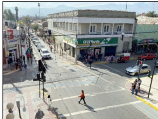
En pleno centro de San Felipe, Carabineros logró recuperar motocicleta con encargo por robo.

Asimismo, el Comisario de Carabineros destacó que durante la jornada también «mantenemos diferentes detenidos por órdenes de de-