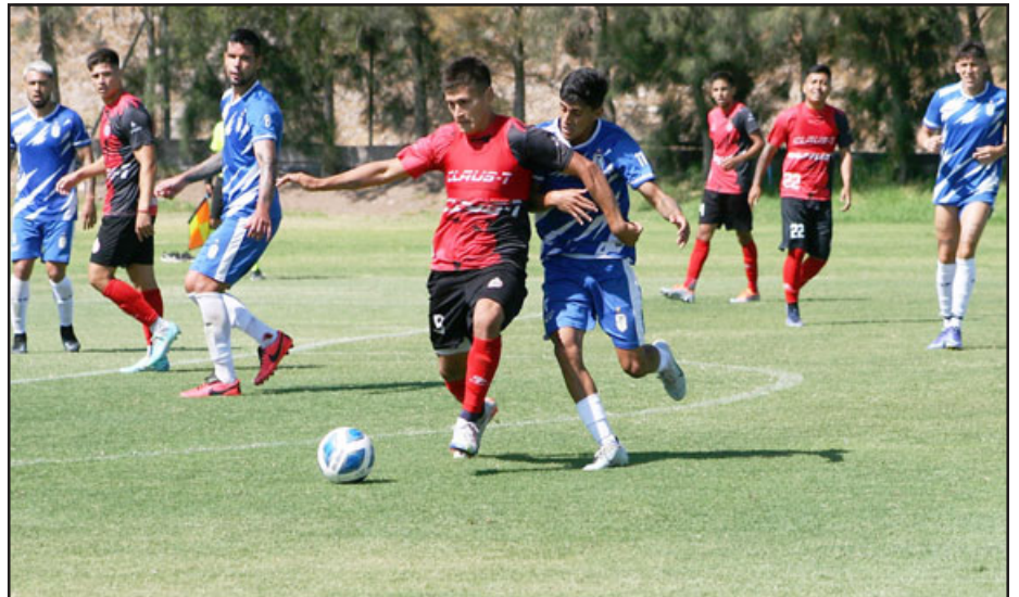
El cuadro sanfelipeño está sometido a un intenso trabajo de pretemporada.

Fecha 1 a - Lunes 13 de Febrero 20:30 horas: Unión San Felipe – San Luis de Quillota (Estadio Municipal) Fecha 2 a Martes 21 de Febrero 18:00 horas: AC Barnechea – Unión San Felipe (Estadio por confirmar) Fecha 3 a Sábado 25 de Febrero 18:00 horas: Unión San Felipe – Deportes An-