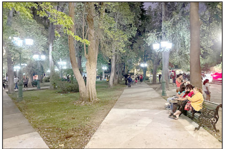
La Plaza de Armas de Curimón será remodelada y hermoseada durante el transcurso de este año 2023.

Además, la directora explicó las condiciones del espacio y lo que abarcaría la segunda etapa, en cuanto a la ejecución de obras. Por tanto, sostuvo que la plaza «tiene muy malas condiciones además de accesibilidad universal, por lo tanto, también se recuperan la accesibilidad universal que debiera tener la plaza. De lleno nosotros queremos avanzar en una segunda etapa también, porque este proyecto se puede postular en una o más etapas, mejorando también ya el