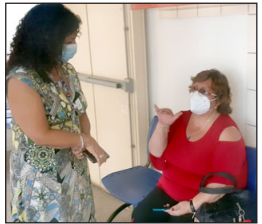
La directora del Hosla tuvo la oportunidad de conversar con los pacientes que asistieron a los controles con dermatólogos este domingo.

hrs. Por este motivo, la directora del Hosla hizo un llamado a la comunidad a prestar atención a los contactos telefónicos del personal del hospital, quien se identifica adecuadamente en la comunicación, para informar que serán citados los fines de semana. Al mismo tiempo, solicitó mantener actualizados los teléfonos de contacto, a fin de no perder la atención que les será proporcionada por el establecimiento.