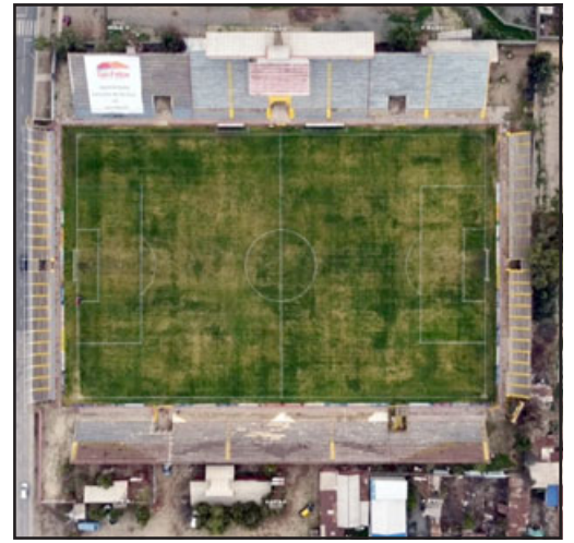
Galería Andes del Estadio Municipal se encuentra clausurada hasta su reparación.

«Cuando se adjudique comienzan los 120 días, el resto es trámite que muchas