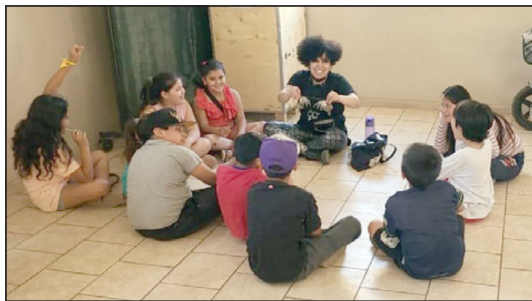
La actriz Nina Legrand se presentará este domingo 29 de enero en la Plaza de Armas de Santa María.

Además, explicó cuáles son las causas por las que es necesario este tipo de actividades, así como también la función que cumple el arteterapia y la títeroterapia. «Hay muchas emociones que hoy en día nosotros reprimimos, como la rabia, el miedo y no tenemos las herramientas en las cuales podamos trabajar. Así como ejercitamos el cuerpo, también debemos ejercitar nuestra retroalimentación en nuestra mente y también las emociones. En el ‘títeroterapia’ existe la magia de poder retratar esa persona que necesitamos conocer de nosotros mismos y retratar la persona que deseamos ser. En el ‘arteterapia’ son actividades lúdicas, donde nos permiten liberar nuestras emociones, despertar esa conciencia que nosotros aún no recono-