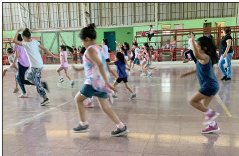
Los estudiantes más pequeños tienen cuatro años de edad.

Recordamos que los interesados deben inscribirse de manera presencial, acercándose al Gimnasio Municipal de la comuna de Putaendo, en los días y horarios mencionados.