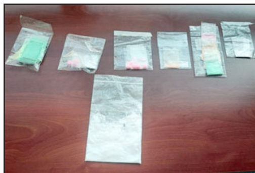
Esta es la droga encontrada a delincuentes en San Felipe.

Es así como personal policial logra divisar el vehículo en calle Antonio Varas, cuyos ocupantes al percatarse de la presencia del personal policial, lanzan al exterior un banano. Posteriormente Carabineros logra darles alcance, descubriendo que, al interior del auto, éstos