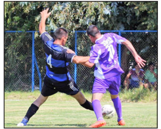
Ya se conoce la conformación de los grupos del torneo Afava 2023.

El sistema de torneo dispone que una vez finalizada la fase de grupos (6 partidos), los primeros dos de cada agrupación (16 en total) pelearán por el premio mayor del Afava 2023, mientras que los otros 16 lucharán por el cetro de la serie B.