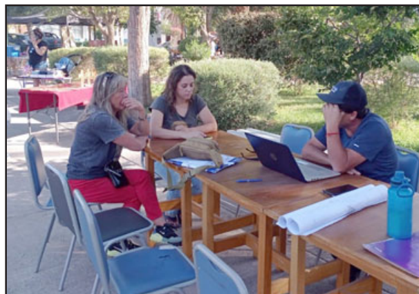
Numerosos vecinos se han preocupado por la propuesta que considera varias expropiaciones para unir Rinconada de Silva con Putaendo.

hay muchos errores porque están pasando a llevar a la población.