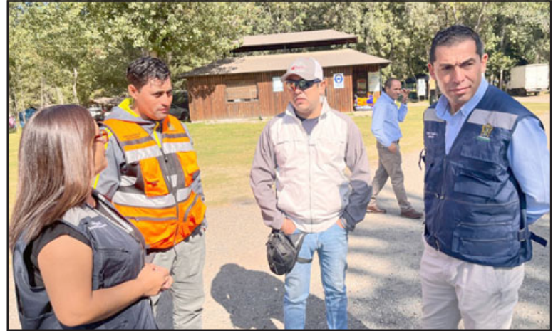
Municipio y Conaf realizan campaña para evitar incendios forestales.