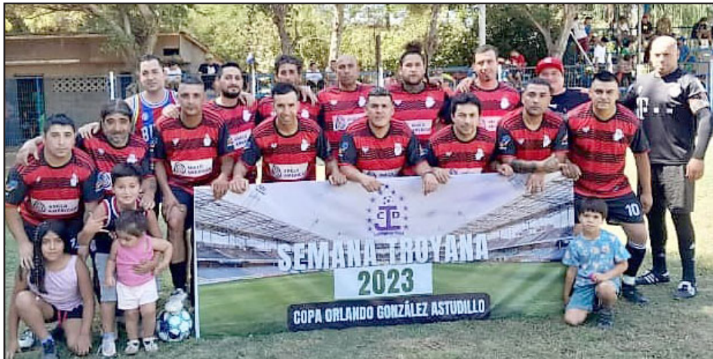
San Nicolás ganó la serie Sénior de la 'Semana Troyana'