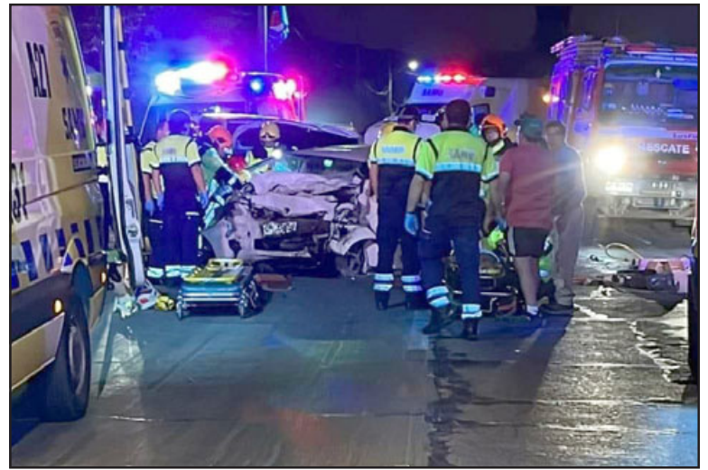
El último accidente de tránsito con resultado fatal se registró la noche del viernes. ¿Cuántos más deben morir para que se arregle la ruta?

Añadió que si bien la municipalidad no puede hacer intervenciones, se solicitarán las autorizaciones correspondientes para ins-