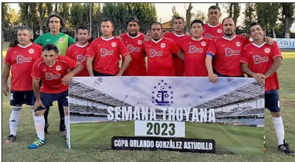
El representativo de Almendral Alto se coronó campeón en los Súper Sénior.

San Nicolás de San Esteban en la serie U-35 y Almendral Alto en los U-45, se convirtieron en los flamantes campeones de la 'Semana Troyana'. El festival futbolístico se dio el lujo de tener entre sus competidores, a gran parte de los mejores equipos de toda la zona del Aconcagua.