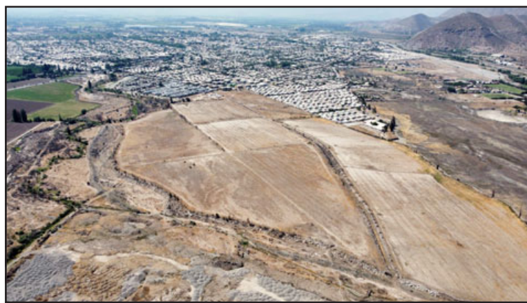
Este es el terreno de 33 hectáreas donde se construirán 1.600 viviendas.