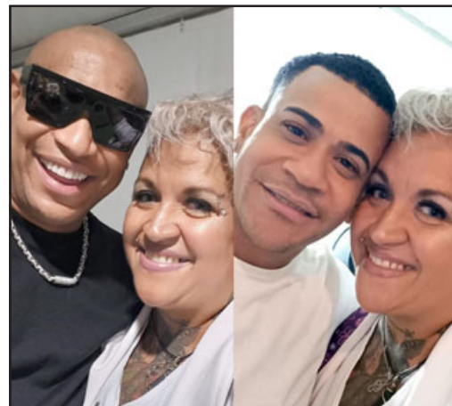
Junto a los integrantes de Gente de Zona durante una de sus presentaciones.