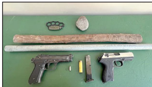
Armas de fuego encontradas en Llay Llay.

tenían dos armas de fuego, originalmente a fogeo, pero adaptadas para disparo, dos proyectiles, una manopla de metal, un fierro de aluminio y un madero.