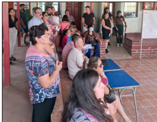
Personal municipal explicando algunos alcances de la propuesta de nuevo Plan Regulador.

- Nosotros esperamos, rogamos, exigimos que se rechace absolutamente la propuesta del plan regulador, porque no corresponde de la forma de que se trabajó, y hay muchos errores. Técnicamente puede que sea bueno, pero