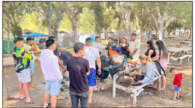
Autoridades entregaron información en campaña educativa para prevenir incendios.