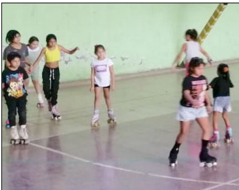
Más de 60 niños y niñas están inscritos en el taller de verano.