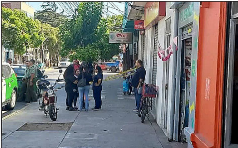
El asalto conmocionó a la comuna de Llay Llay, no acostumbrada a este tipo de delitos.

depósito de un giro para su país, la cual era de nacionalidad peruana. Este individuo ingresa intimidando a las señoritas que atienden el local, a las cuales logra reducir, y se va de forma inmediata a la caja fuerte de este local, donde se mantenía una suma de aproximadamente 20 millones de pesos, lo cual está siendo revisado por la encargada del local, por personal de la Policía de Investigaciones que está trabajando el sitio del suceso en este momento».