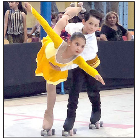
Los pequeños se lucieron durante la gala de finalización de la Academia de Patinaje Artístico 'Renacer'.

Finalmente, Zarzar realizó un repaso de lo que fue la temporada pasada para la academia, indicando que «fue muy fructífero, porque competimos en dos ligas durante el año; en la