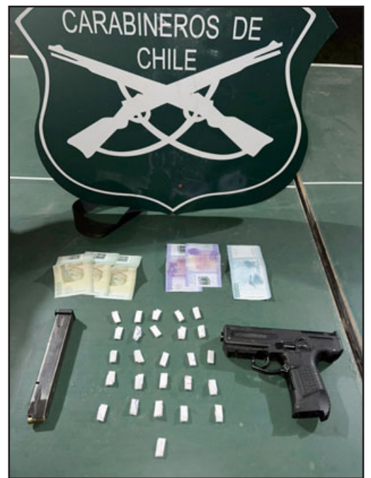
Drogas, arma y dinero decomisado por Carabineros de Santa María.

En este mismo contexto es que, en el control investigativo, se percata que este sujeto mantenía oculta esta sustancia ilícita y el arma a fogueo.