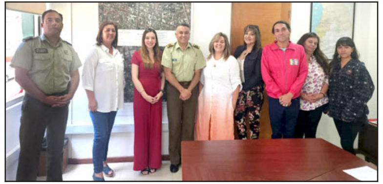
Las autoridades junto a los dirigentes sociales y los oficiales de Carabineros.

Otro tema que plantearon los dirigentes al jefe de la V Zona de Carabineros y que es de preocupación transversal en la comuna, es lo que ocurre con la mega 'Toma Yevide', donde existen actualmente más de 672 viviendas ocupadas en gran parte por