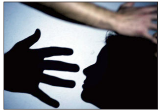
Mujer fue agredida por un hombre en Santa María. (Imagen referencial).