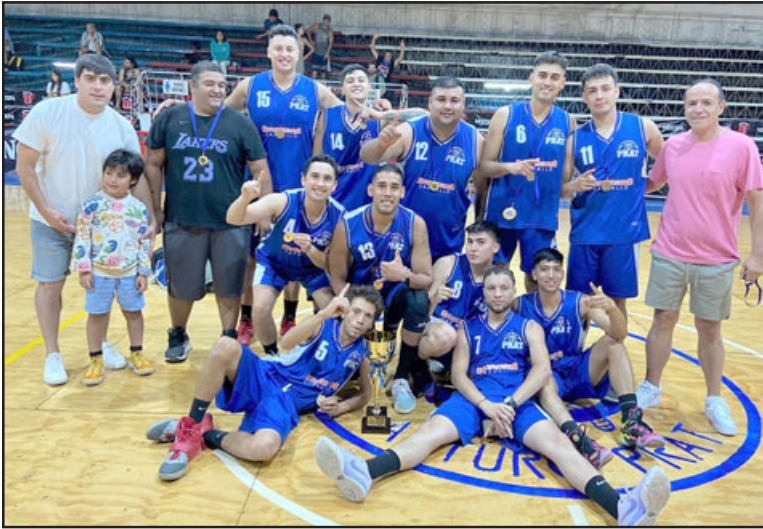
El Prat sacó partido de su condición de local para ganar la Copa Aniversario pratina.