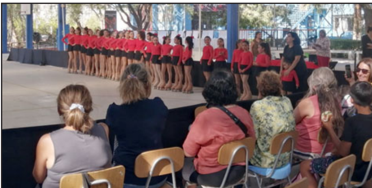
La gala se realizó este sábado en el Liceo Industrial y contó con un importante marco de público.

primera liga ganamos los cuatro campeonatos en primer lugar al medallero; o sea, en las cuatro competencias que fuimos ganamos todo, nos trajimos todas las medallas de