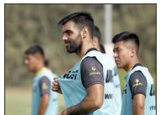
El volante de corte es uno de los jugadores de experiencia en el actual plantel albirrojo.

El jugador de 30 años da evidentes muestras de agrado por el poder continuar en la institución aconcagüina, y con estas palabras lo hizo saber. « Estoy muy contento por el haber tenido la posibilidad de seguir; este será un año distinto, con hartos cambios en la conformación del equipo, pero con la misma ilusión por lo-