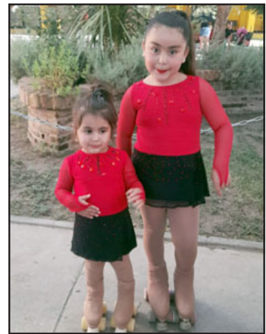
La patinadora más joven de la academia tiene solo dos años y medio de edad.