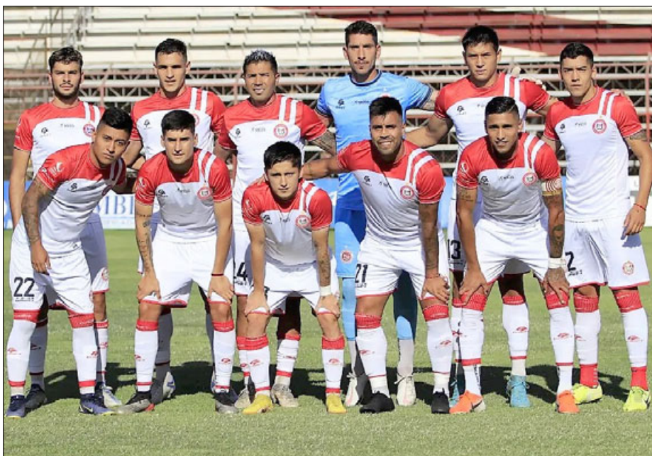
El sábado Unión San Felipe obtuvo su primer triunfo de la temporada.

tras el 0 a 0 del primer tiempo, obligó a Cavalieri cambiar de estrategia para el complemento. Así, apenas el juez Cristián Galaz (buen arbitraje), dio por reiniciadas las hostilidades, se observó de inmediato a un Uní Uní parado en campo rival, situación que descompuso a los forasteros. Antes de los 5 minutos, los dueños de casa se habían creado dos oportunidades, siendo la más clara, una de Briceño.