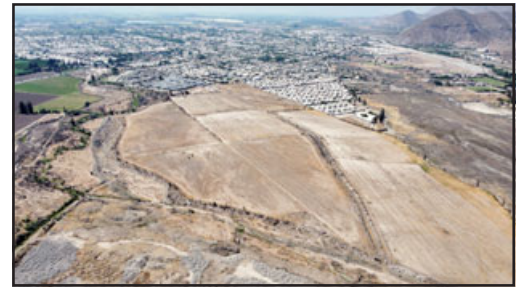
Este es el terreno de 33 hectáreas donde se construirán 1.600 viviendas.