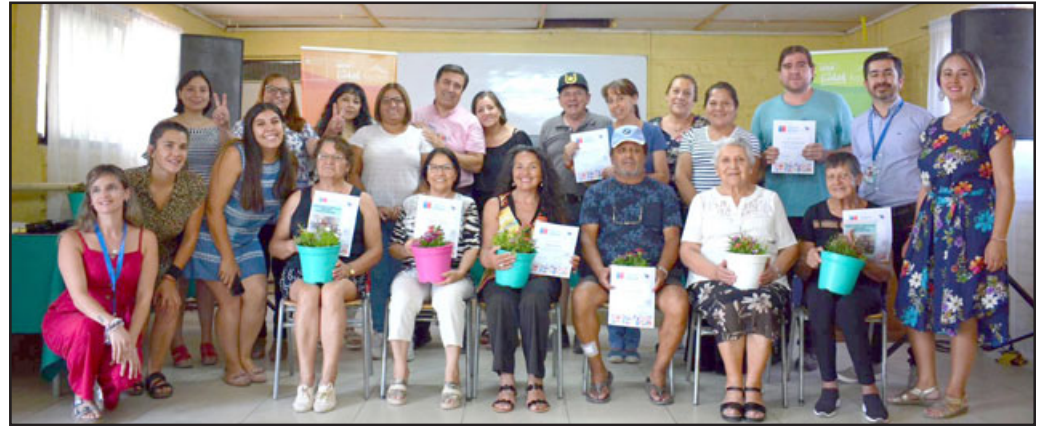
En fueron total 25 residentes de la población René Schneider los certificados tras participar del proyecto 'Mi barrio más sustentable'.

grama, dijo que «no éramos tan unidos antes, y los cursos nos sirvieron para unirnos y acercarnos más, cuidarnos entre nosotros y al barrio también. Cuando se vayan los profesionales que intervienen, los vamos a extrañar mucho, porque el equipo es excelente».