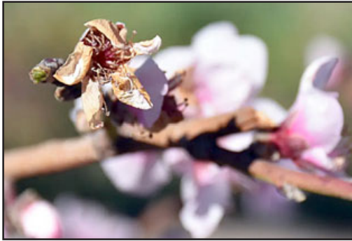
Las bajas temperaturas de septiembre pasado, causaron estragos en la flor del damasco. (Imagen referencial)