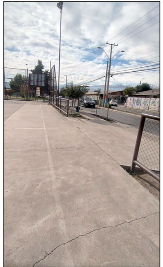
Así luce actualmente la multicancha de la Villa El Señorial.

«Anduvimos preguntando, estábamos medios inquietos, me contacté con un concejal y recién supimos que el contratista no había llegado a firmar, hay una reevaluación del proyecto porque los costos han subido bastante, vamos a tener que tener mucha paciencia, más o menos unos seis meses más», indicó la dirigente vecinal.