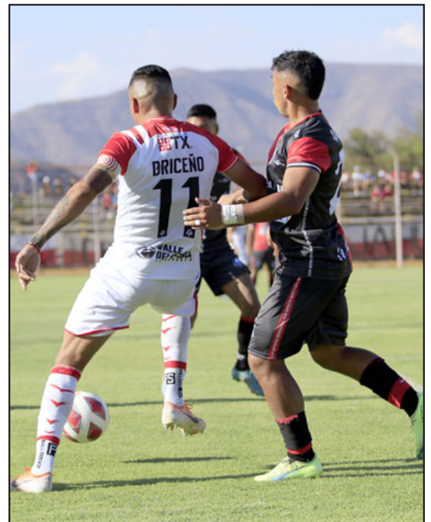
Tras superar a Deportes Antofagasta, el equipo albirrojo ahora apunta a San Marcos.