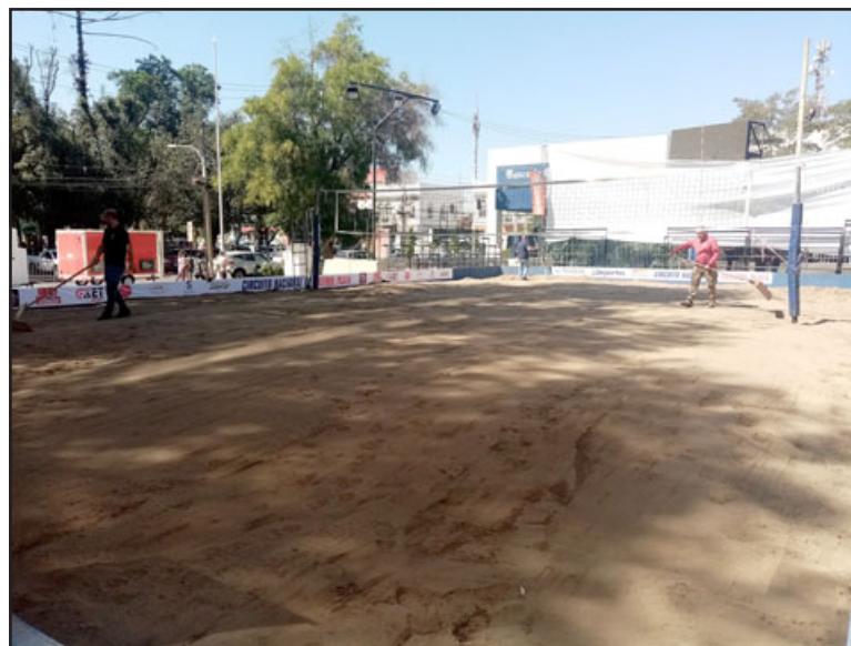
La cancha de arena ya está habilitada en la Plaza Cívica.