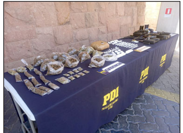
Esta es la droga incautada por personal de la Brianco.

Asimismo, el jefe de la Brianco detalló que «la droga incautada en cada uno de los domicilios corresponde a clorhidrato de cocaína, cannabis y los