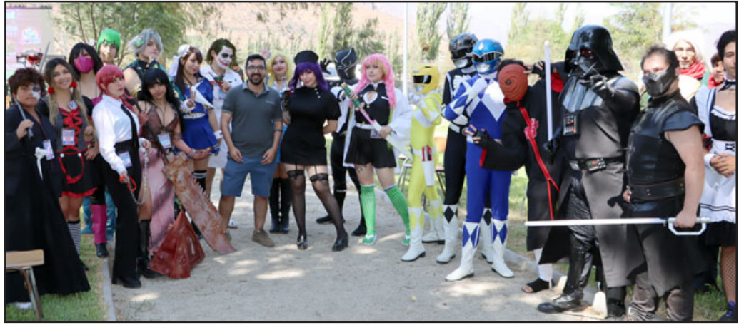
La Friki Fest contó con cosplayers invitados, quienes deslumbraron con sus mejores trabajos en este arte que conquista a chicos y grandes.

no son vistos. Y en ese contexto, poder generar actividades para la cultura friki que es muy popular entre los jóvenes de distintas edades, la respuesta ha sido maravillosa, vemos el gimnasio y el parque llenos, sintiéndose seguros y felices en su espacio, de participar en esta actividad y eso es lo que nos mueve como gestión. Estamos felices de abrir la caja para nuevas expresiones y estamos muy agradecidos de los jóvenes que vinieron, los expositores y especialmente a funcionarios municipales, quienes pusieron toda su fuerza para que esta actividad fuera un rotundo éxito. Estamos seguros que esta será la primera de muchas versiones de esta entretenida acti-