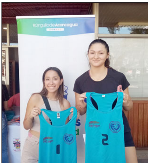
Alta participación tendrá la fiesta del vóleybol en arena.

disfrutar este campeonato que lo voy a jugar con mi papá. También conocer gente, conocer más personas que estén en el mundo del vóley, formar buenos vínculos y disfrutar», cerró.