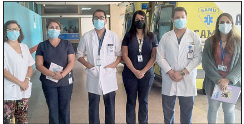
Hospital San Camilo cerró emergencia respiratoria covid.

En este mismo contexto, la doctora añadió que «el cambio que va a haber en las urgencias es que el flujo será igual para los pacientes respiratorios y no respiratorios, esto no significará un desmedro en la atención, en el recurso humano, tenemos mucho más recurso humano de antes que empezara la pandemia, los pacientes seguirán siendo atendidos con todas