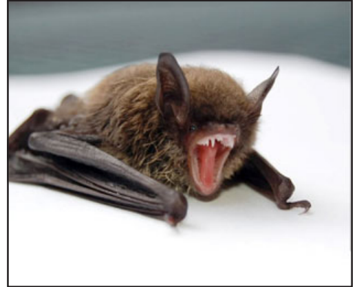
Murciélagos con rabia fueron encontrados en Los Andes y Llay Llay.

Junto con esto, el médico veterinario explicó que para estos efectos, se establece un radio de 300 metros partiendo del lu-