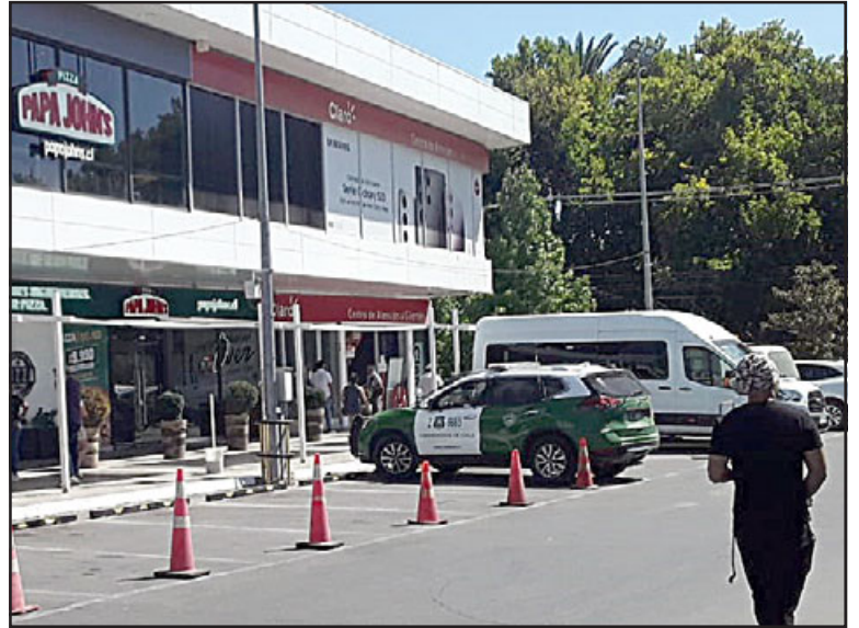
Carabineros en las dependencias de la tienda Wom en el Open Plaza.

conductor en el vehículo a la espera de la salida de éstos y sirviendo como ‘loro’ o el sujeto que está alerta para avisar en caso de cualquier situación. Posteriormente estos tres, ingresan e intimidan con armas de fuego a los dependientes del local, los obligan bajo la intimidación con las armas de fuego a abrir la caja de seguridad desde la cual sustraen la totalidad de los teléfonos celulares que se encontraban ahí. El número hasta el momento la empresa no nos lo ha señalado, pero son alrededor o sobre los 70 equipos de alta gama. Luego estos sujetos salen, suben el vehículo que los estaba esperando, el conductor abre la maleta y huyen del lugar», cuenta.