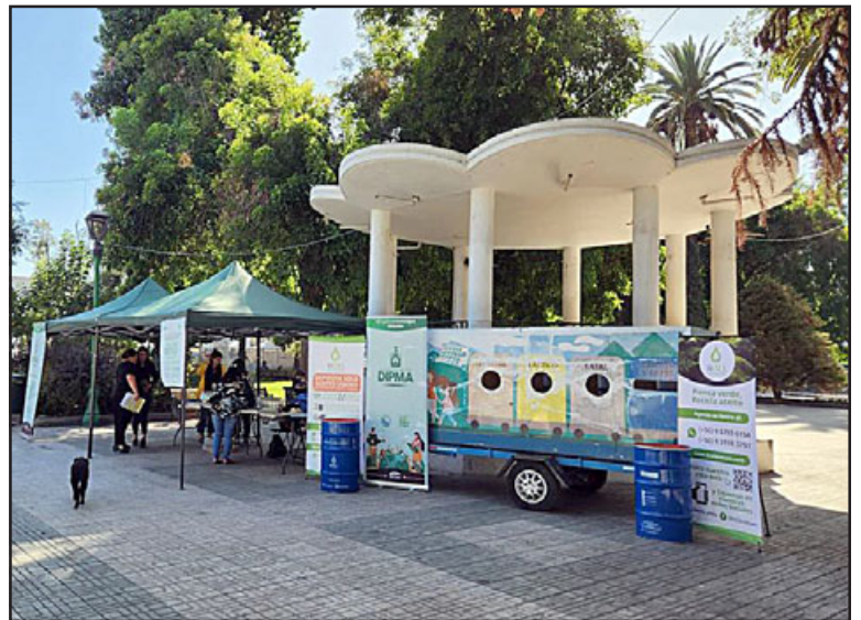
Con una campaña educativa, el municipio de San Felipe busca incentivar el reciclaje en la comuna.