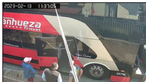
Bus que hace ocupación del lugar mencionado y que recoge pasajeros.