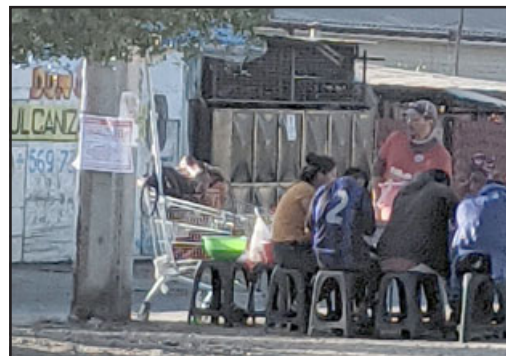
Este martes justamente ya estaban instalados los comedores.

«Si realmente hicieran la avenida de Diego de Almagro como hicieron la de Michimalongo, yo creo que se sanearían muchas cosas, porque allá arriba pusieron banquetas de cemento, basureros, pusieron rejón frente a cada casa, solamente no hay reja donde entra el vehículo de esa casa (...) Un con-