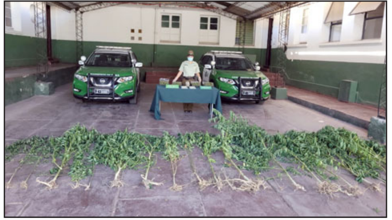
Esta es la droga incautada por Carabineros.