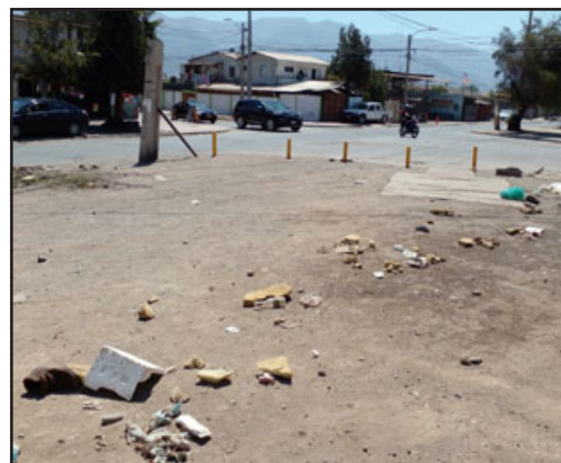
Basura y desechos fuera del domicilio de Eugenia (Fotografía del martes).