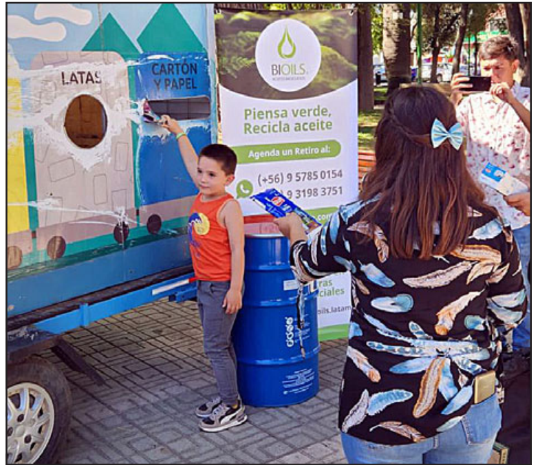
Los más pequeños aprendiendo a reciclar y tomando conciencia de la importancia que tiene para la vida en el planeta.

Finalmente, la alcaldesa Carmen Castillo sostuvo que «es muy importante el día del reciclador de base y promocionar lo que significa estar inscritos como recicladores de base, la idea es que cada vez podamos reciclar más y que tengamos una ciudad limpia con menos acumulación de desechos».