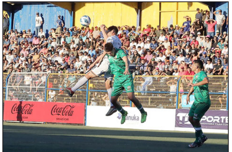
Trasandino se impuso como forastero a Provincial Osorno.