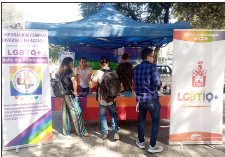
Los funcionarios estuvieron concientizando con respecto a la discriminación, prevención de ETS, entre otros.