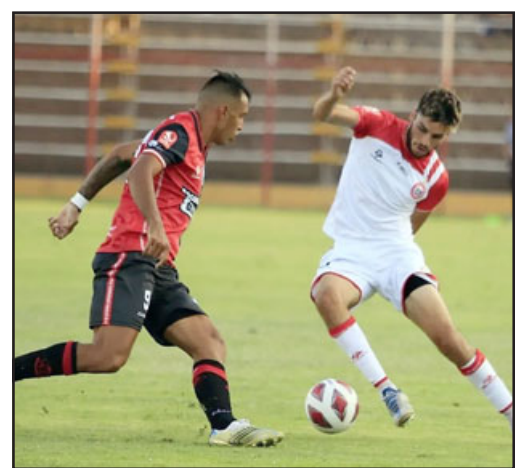
Los albirrojos buscarán estirar su tranco ganador ante Santiago Morning.