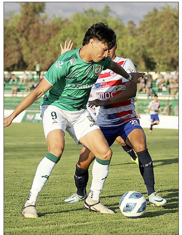
El cuadro andino venció de manera muy ajustada a los angelinos.