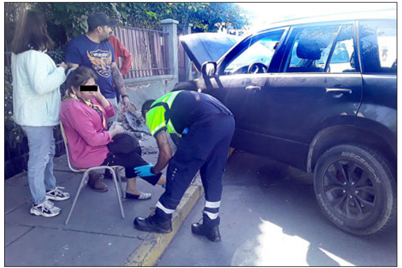
La conductora de la SUV marca Suzuki, modelo Nomade, siendo atendida por personal del SAMU en el lugar, luego de haber sido sacada desde su vehículo.

Desde Bomberos de San Felipe, en conversación con nuestro medio, el Comandante Juan Carlos Herrera Lillo reconoció que en este último mes han tenido tres accidentes vehiculares; «el penúltimo fue un volcamiento. Llegó Bomberos cerca de las seis de la mañana, el auto chocó con un árbol y se volcó y usted vio que ahí estuvo como tres, cuatro días el auto botado en ese sector, y ahora este accidente afortunadamente no pasó a mayores, la señora (conductora del jeep), iba con su cinturón de seguridad, fue fortuna que no haya pasado gente en ese sector a esa hora. En la mañana transita harta gente,