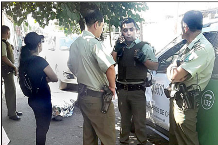
Carabineros en el lugar del deceso, a unos cuantos metros del puente de la Hacienda de Quilpué.

necesaria la concurrencia de la BH de la PDI Los Andes, producto que la muerte fue catalogada como natural, según lo ordenado por el fiscal de turno a los policías. También llegó hasta el sitio del suceso un familiar del fallecido.