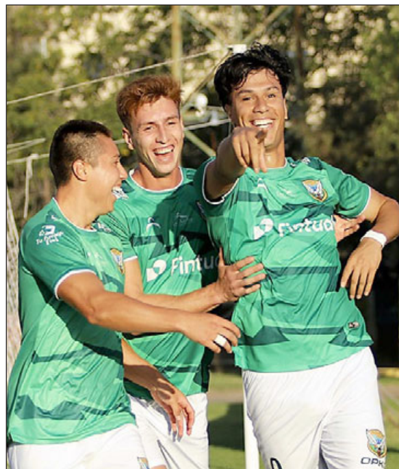
Jugadores de Trasandino celebran una de las anotaciones sobre Iberia.

Limache 1 – Osorno 0; Valdivia 0 – Melipilla 0; General Velásquez 2 – San Antonio 0; Real San Joaquín 2 – Rengo 1; Fernández Vial 2 – Linares 1; Lautaro de Buin 1 – Deportes Concepción 0; Trasandino 2 – Iberia 1