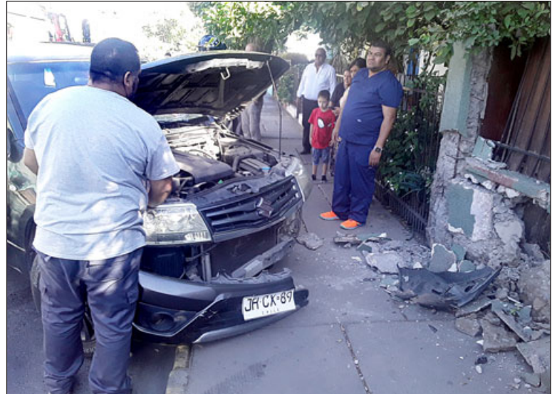
El vehículo y el muro resultaron con daños debido a un conductor irresponsable que se saltó el disco Pare y se dio a la fuga.