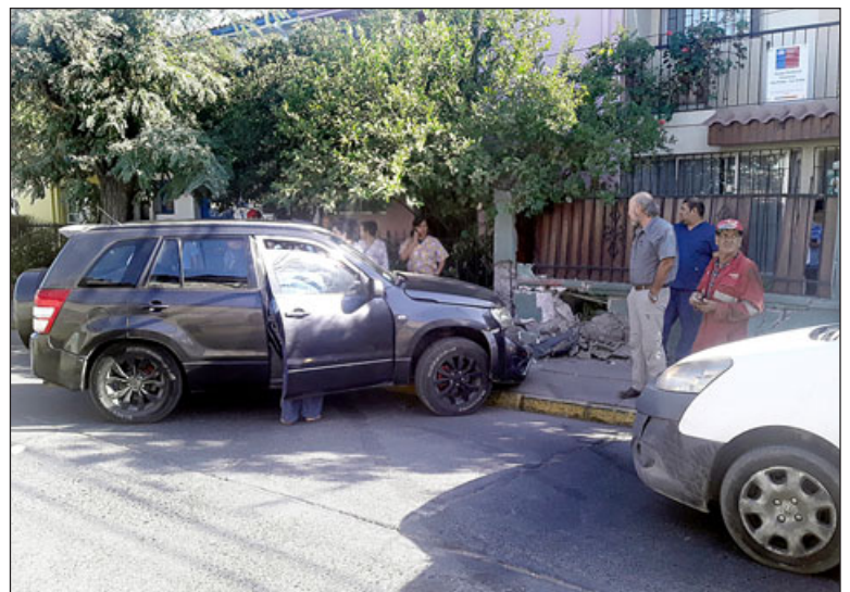
Tras ser impactada por el furgón, la conductora de la SUV se fue contra el muro donde terminó incrustado su vehículo.

niños que van al colegio, hay que tomar las precauciones correspondientes por tener un accidente de mayor magnitud», señala.