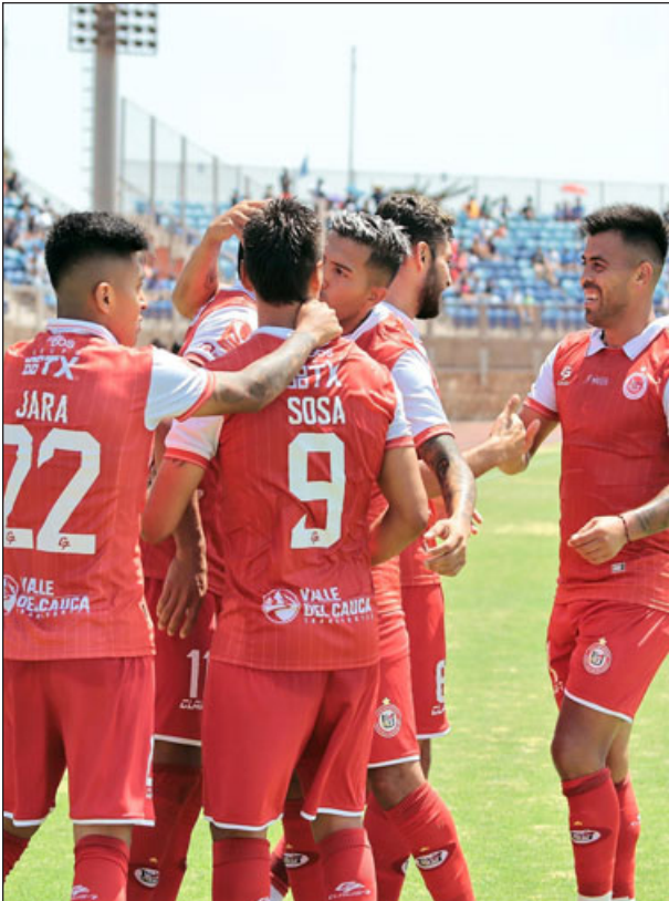
De ganar esta tarde, los sanfelipeños se instalarán en la parte alta de la tabla.