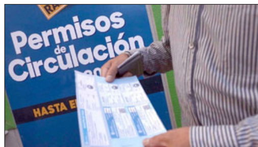
El permiso de circulación se cancela mayormente hasta el 31 de marzo.

«La tercera placa es un dispositivo en forma de sticker, desarrollado por la Casa Moneda, que se adhiere por el interior del parabrisas del auto y contiene una huella digital, que, al escanearla con un teléfono, entrega toda la información del vehículo, emanada por el municipio; número de patente, modelo, marca, año, municipalidad, fecha de renovación del permiso de circulación y otros beneficios», expresó.