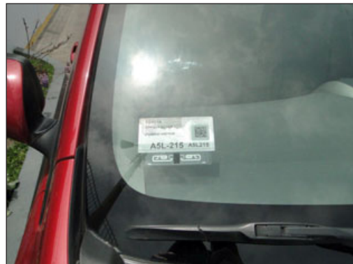
La tercera placa contiene huella digital, información del vehículo y de documentos, y se puede escanear con un teléfono inteligente.

Además, León sostuvo la importancia de este dispositivo, debido a la seguridad que entrega a la hora de comprar un vehículo, su protección y la validación del documento. En este sentido, dijo que al obtener el sticker «se tiene seguridad física y digital, georreferenciación, información en línea y en tiempo real, protección del vehículo y de la validación de la documentación, así que te invito a tener mayor seguridad para ti y