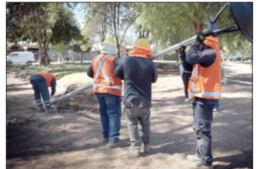
Los trabajadores en plena instalación de la iluminación LED en Avenida Yungay Norte, donde se dispondrán 122 puntos de alumbrado peatonal.