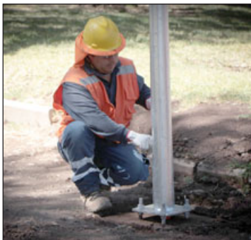
Los nuevos focos se ubicarán en puntos estratégicos, donde el alumbrado público era insuficiente.

dependiendo de la cantidad de focos dispuestos en cada sector.