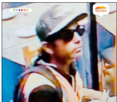
Este es el falso fiscalizador.

Llaman a vecinos a identificarlo y denunciarlo