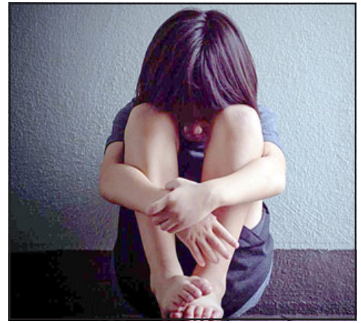
El depravado abusó y violó a la pequeña desde que tenía 5 años de edad y por un lapso de 8 años.

Agrega el persecutor que rendida la prueba, entre las que se cuentan «naturalmente la declaración de la víctima, de su madre, su abuela, así como personal de Carabineros que adoptó el procedimiento, personal especializado de la Brigada de Delitos sexuales de la Policía de Investigaciones de Los Andes y la perito del Centro de Atención de Víctima de atentados sexuales de la PDI, logró