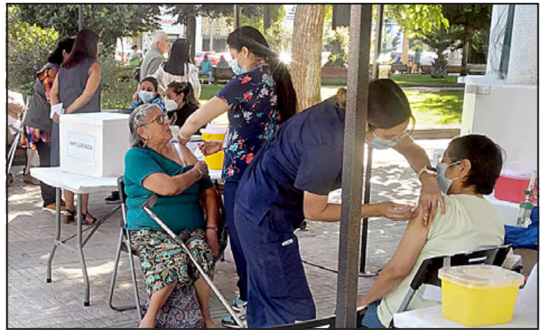
Con decenas de personas vacunándose, fue lanzada la campaña 'Vacúnate con la Dupla' en San Felipe.

Asimismo, el jefe de la Autoridad Sanitaria de Aconcagua aseguró que a nivel nacional se ha extendido la alerta sanitaria por la pandemia, «se tomó la decisión del Ministerio de Salud de ampliar la alerta sanitaria hasta el mes de agosto, estamos trabajando en los despliegues a las comunidades educativas, productivas, y esa es la señal, de que no hay que bajar la guardia, seguir con las medidas de