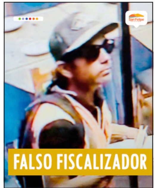
Este es el sujeto que el municipio está denunciando como falso fiscalizador.

Es en este escenario que la alcaldesa Castillo aseguró que ya se dio a conocer en la redes sociales del municipio la imagen del sujeto, por lo que, en caso de ser sorprendido nuevamente realizando este ilícito, se solici-