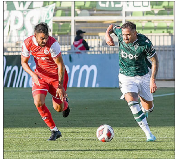
En un encuentro donde mostraron nulos avances, los sanfelipeños cayeron 3 a 2 ante Santiago Wanderers

Santiago Wanderers requirió de 12 minutos de entusiasmo propio y muchas dudas de los aconca-