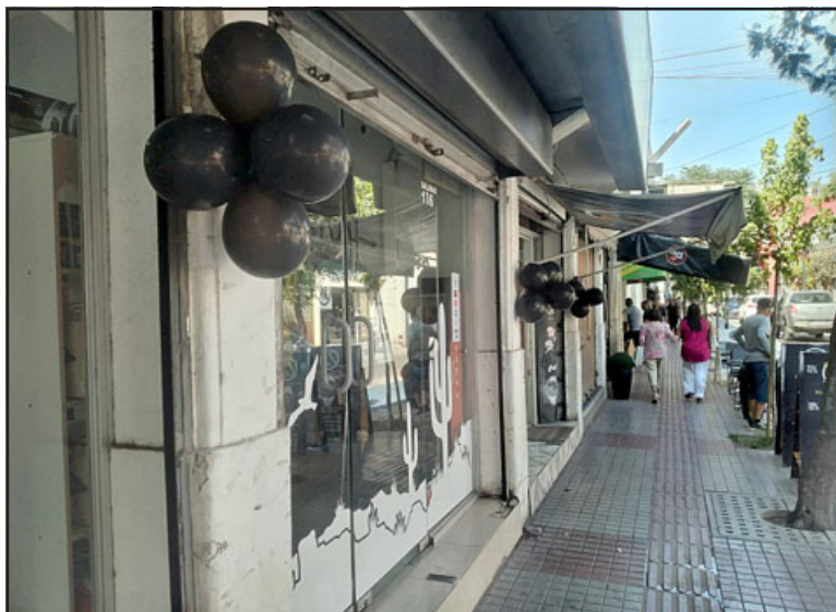
Comerciantes se manifestaron este martes con globos negros en sus fachadas por la ola de robos que los ha afectado.

Finalmente, y ante la consulta de la posibilidad de poder contar con una unidad de seguridad especializada en San Felipe, la edil manifestó que «di instrucciones al director jurídico que vea esta posibilidad para realmente cumplir con ello, y ojalá en la brevedad posible, incorporar más personal a esta función, algunos compartidos, y otros con dedicación exclusiva a la seguridad pública», cerró.