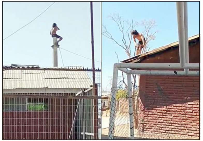
La última 'jugarreta' del Joto se convirtió en la gota que rebalsó el vaso. Ahora, si aparece por la población, va a ser detenido.

Además, la edil estableció la importancia de una ayuda médica para el sujeto señalado, enfatizando en la responsabilidad que tienen sus