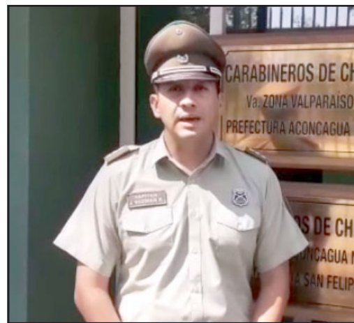
Mayor Jorge Guzmán, comisario de Carabineros de San Felipe.

mente fue la ronda que se hizo el día de ayer (martes), que en un tiempo record se logra la detención de ocho importantes sujetos, uno de ellos fue para cumplir condena por el delito de receptación de especies robadas, y es tomado de la calle, levantado de la vía pública y trasladado de forma inmediata a la cárcel pública a cumplir su condena. Entiendo la molestia, ojalá poder tener algún tipo de seguridad anexa, no obstante se están generando los cursos de acción, los canales de comunicación con parte del gremio de vendedores del casco histórico, con la finalidad de una manera conjunta logremos llegar a puntos de acuerdo que nos permitan a todos involucrarnos de manera diferente por parte de la Gobernación, actual Delegación, de la Municipalidad, por parte de la Cámara de Comercio, para poder llegar a un canal en que ellos puedan retomar su seguridad y por otra parte nosotros como Carabineros poder brindársela con gusto, porque como en todos los lugares hemos declarado la política de puertas abiertas que se declaró cuando yo asumo como Comisario de esta unidad, parto por eso, por hacerme cargo de seguridad, de poder colocar el mayor de los ímpetus, de poder entregar un servicio diferenciado y por sobre todo entender