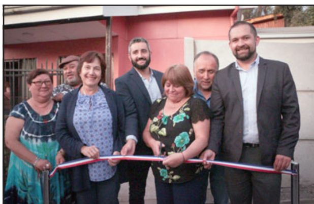
El tradicional corte de cinta que da por inaugurados los trabajos de mejoramiento de la sede vecinal.