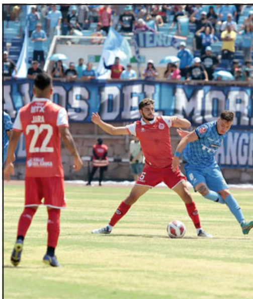
Unión San Felipe viene cumpliendo una campaña que por ahora está muy por debajo de lo proyectado.