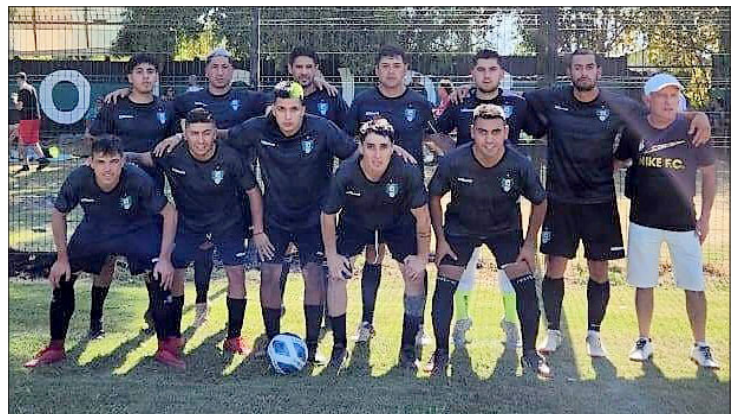
Golondrinas de San Esteban buscará en casa acceder a la 3ª fase.

12:00 Unión Delicias – Dinamo (Quillota)