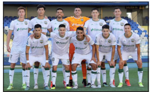
Los andinos tienen muchas posibilidades de seguir solitarios en la punta del torneo.

Domingo 26 18:00 Osorno – Concepción 18:00 General Ve-