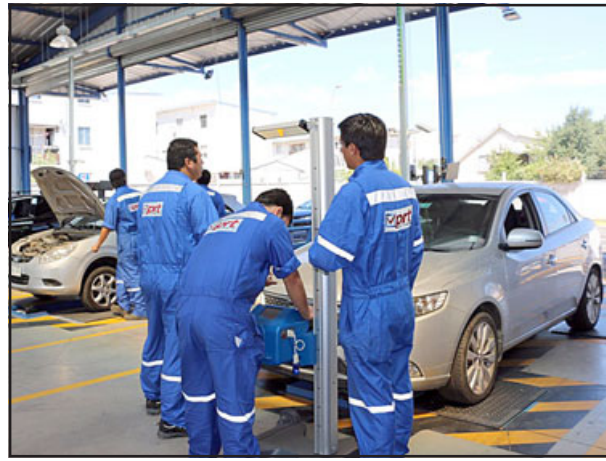
El Ministerio de Transportes licitó y adjudicó una planta de revisión técnica en el sector de Tres Esquinas. (Imagen referencial)

En este mismo sentido, Díaz explicó que la adjudicación que entregó la cartera de Transportes es el primer paso, y obligatorio, para que de esta manera se pueda continuar con el trabajo en la entidad edilicia. «La información que tenemos es que es en ese rol que estaría ubicada la nueva planta. El proyecto de la planta no ha ingresado nada a la Municipalidad de San Felipe y su Direc-