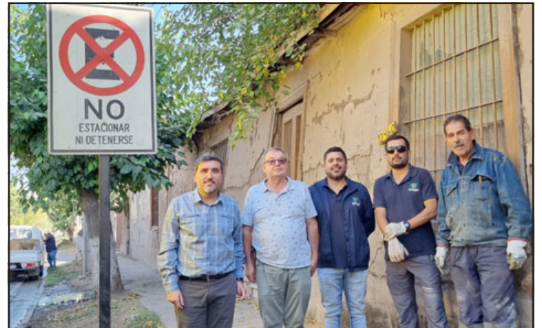
La medida fue aplaudida por vecinos del sector que pidieron poner término a esta práctica que tanto perjuicio les ha causado.

de La Florida, que además nos trae otros problemas, como lo es el daño al pavimento de la calle. Por eso es que hemos decidido modificar este punto, instalando una señalética para que no se estacionen los camiones aljibes», sostuvo.