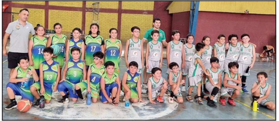
Los equipos del Árabe y Trasandino fueron protagonistas de la actividad cesterera.

Al tratarse de una actividad netamente formativa para jugadores (as) Sub 9 y Sub 11, el acento no estaba puesto en el resultado, ya que lo importante en esta fase de aprendizaje, se instala en el aspecto lúdico. Eso, en todo caso, no impidió que todos hicieran lo posible por ganar, lo que permitió ver duelos de buen alcance técnico, además que pudo observarse con mucha claridad que hay jugadores que tienen mucho potencial.