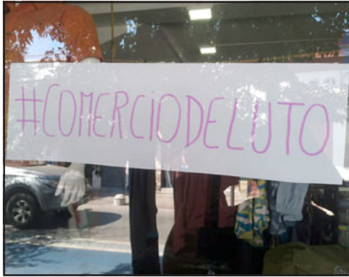
Legendas con el Hashtag #Comerciodeluto se vieron ese día también.