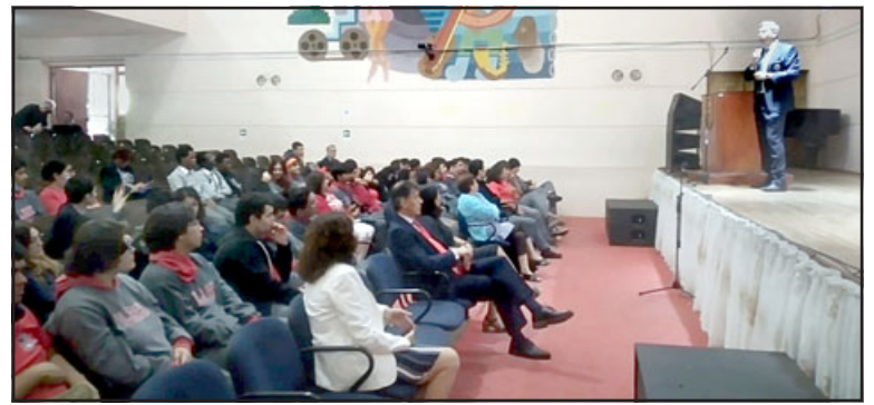
PDI realizó charla para la prevención de la violencia en el Liceo Roberto Humeres.

«Esto es muy relevante porque es una forma de darnos a conocer; en esta etapa de poder difundir la prevención, eso lo hacemos a través de nuestra unidad especializada sobre todo en la etapa de la juventud. Prevenir es una mane-