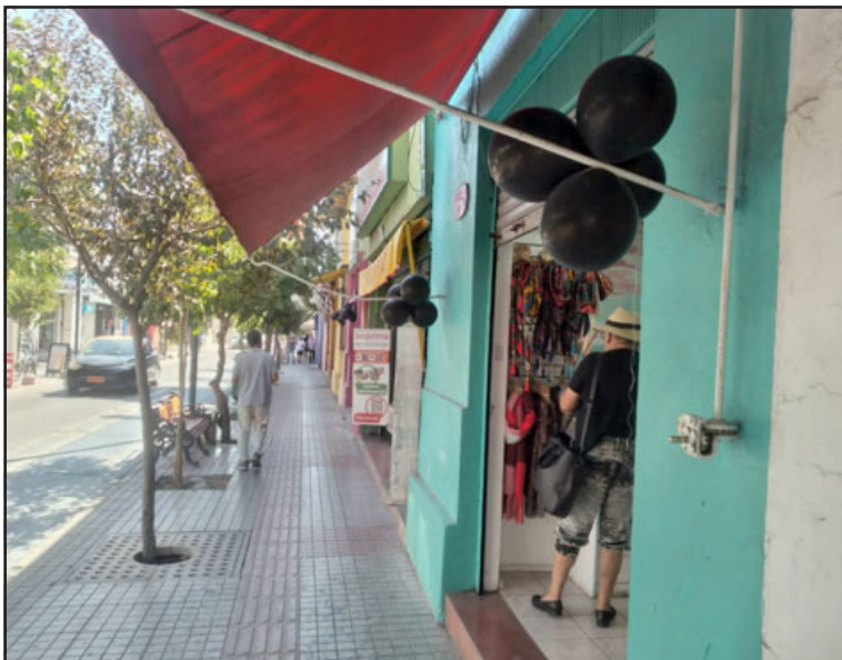
También otros locales exhibieron globos negros en protesta por la delincuencia que los afecta.

convencido de que la delincuencia que estamos viviendo hoy en día, es lo que nosotros mismos pedimos, jugar con demonios es esto y la violencia es un demonio, y en algún momento la vanagloriamos y la colocamos como heroica. Hoy día estamos sufriendo las consecuencias y somos nosotros mismos quienes debemos empezar a tomar el camino correcto, hoy día se deben hacer cargas en el asunto como dijo alguien por ahí, se debe empezar a usar el látigo, no podemos ya quedarnos en mesas de diálogo, hay que darse en acción y esas acciones no solamente tienen que venir de las autori-