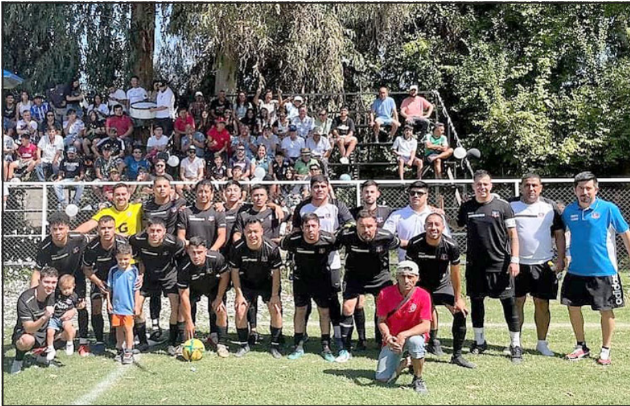
Colo Colo Farías de San Esteban se ilusiona con llegar alto en 'La Orejona'.

En el principal torneo de clubes de la Quinta Región, nueve (pueden quedar solo ocho) son los equipos de nuestra zona que han logrado mantenerse con vida en la competencia. A estas alturas, cuando ya se han jugado dos fases, el nivel de los conjuntos es cada vez más alto, por lo que no es aventurado afirmar que más de algún cuadro aconcagiuno podría alcanzar vuelo en la 'Copa de Campeones'.