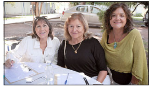
Cerca de 500 personas mayores de 60 años llegaron a inscribirse en los distintos talleres que se impartirán entre mediados de abril y el mes de noviembre del presente año.