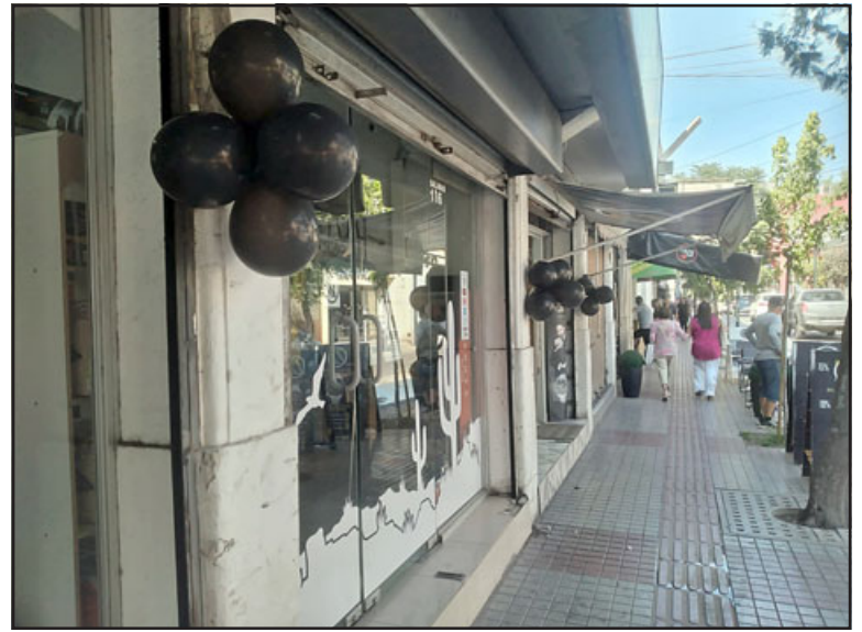
Globos negros en locales de calle Salinas al día siguiente del robo millonario que afectó a una joyería y relojería.

Reconoce que como presidente está cansado de andar «visitando colegas que le roban, asaltan, que no pueden ejercer sus labores de forma tranquila, y entiendo como lo dijo el General de Carabineros, 'estoy cansado de ir a funerales de Carabineros'. La verdad yo estoy