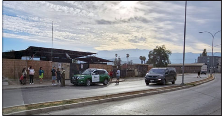
En un taller en Avenida Hermanos Carrera Norte, fue encontrado sin vida el conocido comerciante de San Felipe.

'Vitoko' además nos comentó que «lo vi en un taller en Encón pero parece que no le fue