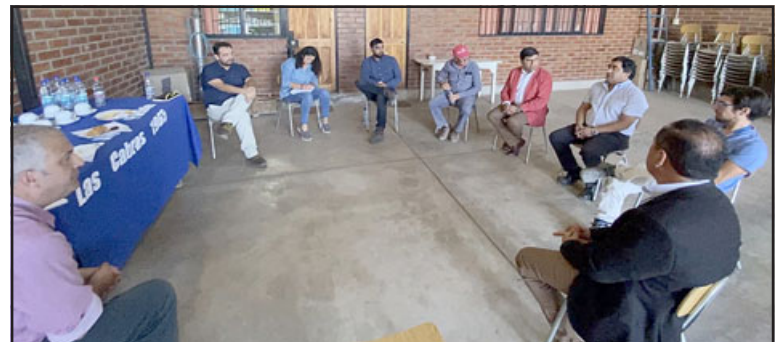
El alcalde de Santa María, junto a la directiva del APR del sector Las Cabras y equipo Municipal, se reúnen para ver el desarrollo del proyecto de construcción del Pozo Profundo.

Continuando con el lineamiento de trabajo colaborativo y participativo, el alcalde de Santa María, junto a la directiva del APR del sector Las Cabras, la DOH, Subdere, y equipo Municipal, se reúnen para ver el desarrollo del proyecto de construcción del Pozo Profundo, que asegurará el abastecimiento de