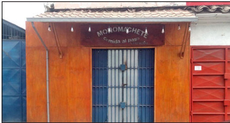
En este recinto funcionaba el 'Monomachete' .

bien, porque en la parte comercio es muy complicado. Yo estoy muy afectado, la comuna de San Felipe, al señor lo conocían hartos, sólo el pésame a la familia, a la señora, sus hijos».