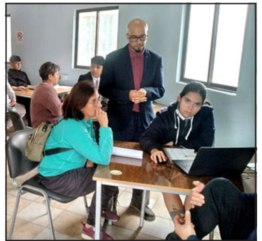
Decenas de personas acudieron a realizar la Operación Renta en el primer día de trabajo en el Liceo Roberto Humeres.

sido intenso, pero hemos estado bien y atendiendo con mucho gusto. A nosotros nos preparan los profesores desde tercer medio, donde vemos todo este tema, y en cuarto medio son más las charlas y ayudar a los terceros medios. Se nos facilita porque los profesores son muy buenos enseñando, la gente del Servicio de Impuestos Internos también nos hace charlas y quedamos sin dudas», manifestó la estudiante.