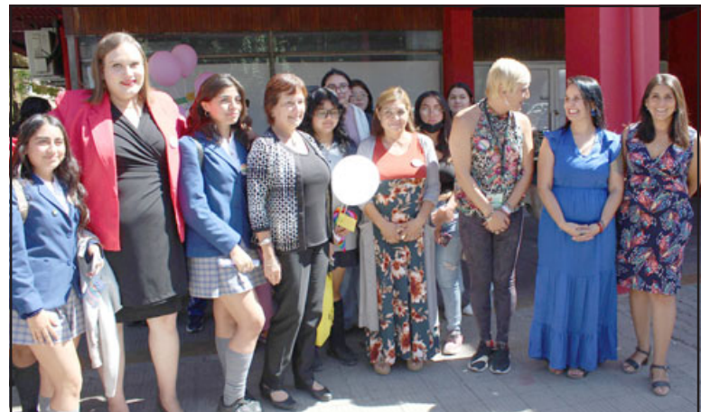
La iniciativa tuvo como objetivo conmemorar el 'Día Internacional de la Visibilidad Trans'.