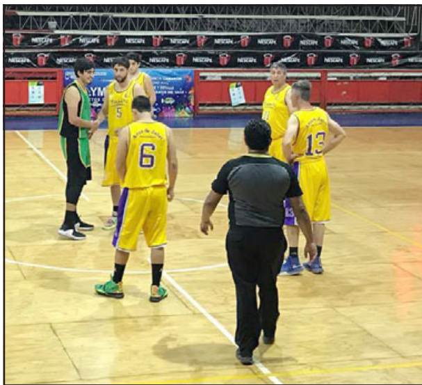
Habrá que esperar un rato para que la ABAR parta su temporada regular de este año.

Putando 0; Victoria de Morandé 0 – El Peumo 0; Miraflores 7 – Pedro Cabrera Colarte 1; Trinidad 1 – Los Húsares 1; El Roble 2 – Unión Retiro 1; Colo Delicias 1.