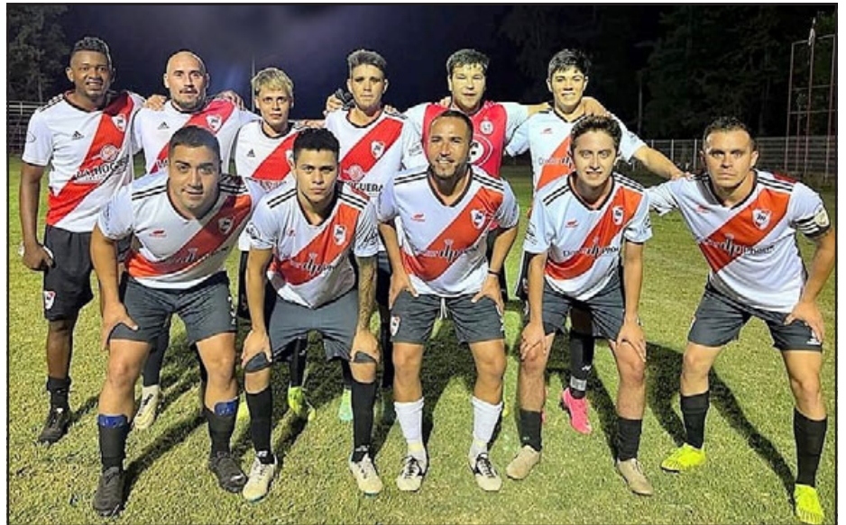
Miraflores de Santa María aplastó a su rival y prácticamente aseguró su paso de ronda en la 'Copa de Campeones'.

Putando 0; Victoria de Morandé 0 – El Peumo 0; Miraflores 7 – Pedro Cabrera Colarte 1; Trinidad 1 – Los Húsares 1; El Roble 2 – Unión Retiro 1; Colo Delicias 1.